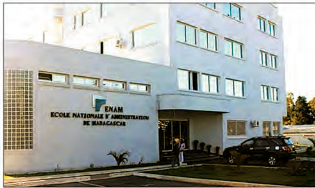
Le rayonnement international de l'Enam est un défi pour ses dirigeants.