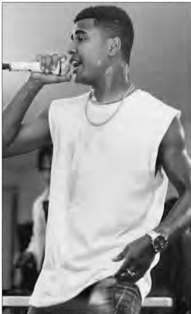
de Diego Suarez à l'Hôtel de la Baie qui clôturera son emploi du temps de ce mois de février.