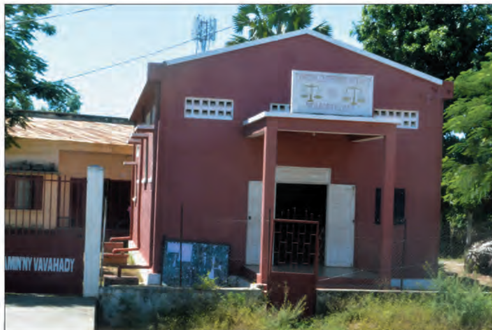
L'idéal serait au minimum d'avoir un TPI par district.

REPUBLIKAN'I MADAGASIKARA Fitaviana - Tanindrazana - Fandrosoana