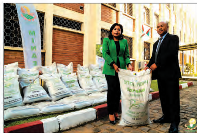
Lors de la remise du don au ministère de tutelle.