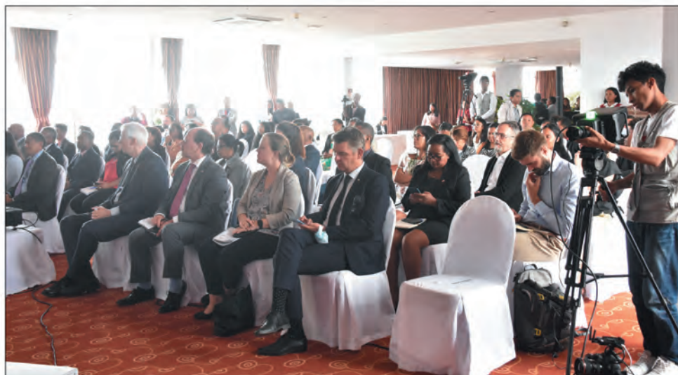
Lors de la présentation de l'Indice de Perception de la Corruption (IPC) 2022, Transparency International-Initiative Madagascar a alerté sur la stagnation inquiétante de Madagascar au niveau du score.