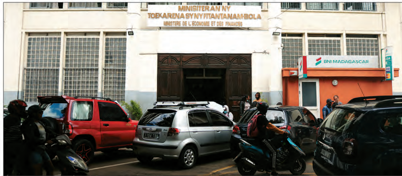
Le déficit de 2,276 milliards est à transférer au compte permanent du Trésor.

Adoptée par l'Assemblée nationale le 14 décembre 2022 et le surlendemain par le Sénat, la loi portant loi de règlement pour 2019 a été soumise par le président de la République à la HCC aux fins de contrôle de constitutionnalité le 22 décembre dernier. Dans sa décision, la HCC de rappeler que le contrôle de constitutionnalité des lois de finances s'exerce en référence à la Constitution stricto sensu mais également à la loi organique sur les lois de finances, tel que prévu implicitement par l'article 90 de la Constitution, ainsi qu'au rapport de la Cour des Comptes pour l'année concernée, en ce qui concerne la loi de règlement. Et de citer l'article 2 alinéa 7 de la loi organique sur les lois de finances qui dispose