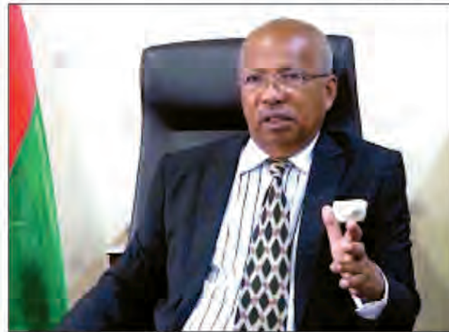
Le ministre des Transports et de la Météorologie, Rolland Ranjatoelina a jusqu'au mois de mai pour se décider.