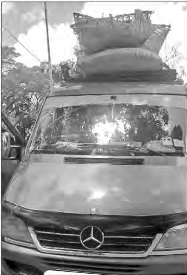
Mivezivezy eny amin'ny lalam-pirenena ny rongony.