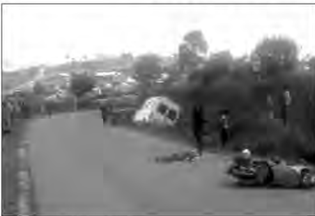
L'accident en pleine virage.

Dramatique accident. Un scooteriste s'est tué au guidon de son véhicule alors qu'il roulait sur la RN7, près du PK 59+020 à Amboniriana dans la commune Andriambilany, District d'Ambatolampy. Le