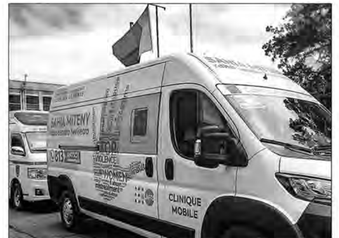
La caravane médicale a quitté Antananarivo, hier en milieu de matinée, et est prévue d'arriver à destination dans la nuit.