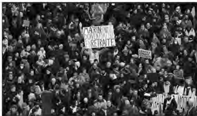
Selon une étude YouGov pour Le HuffPost menée en ce début février, le discours d'Elisabeth Borne et Emmanuel Macron ne passe pas du tout auprès de la population.

POLITIQUE - Quatre semaines de " pédagogie ", et sept points de perdus. Voilà le constat, peu reluisant pour le gouvernement, un mois après la présentation de sa réforme -phare- des retraites. Début janvier, les Français ne voulaient pas du texte proposé par Elisabeth Borne... Ils en veulent désormais encore moins.