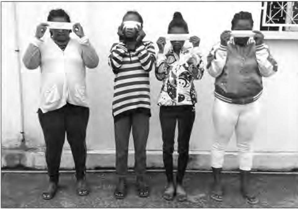
Ireo mpivarotra rongony voasambotra.

Miafina ao ambadiky ny fitazomanana varotra lasopy izy ireo. Kanjo moa tsy misy ratsy izay tsy natao ho sarona ka fantatra ihany fa misy bizina rongony, ireto vehivavy mpivarotra hani-masaka tetsy Ambohidrazana Fenoarivo ireto. Ny faran'ny volana teo