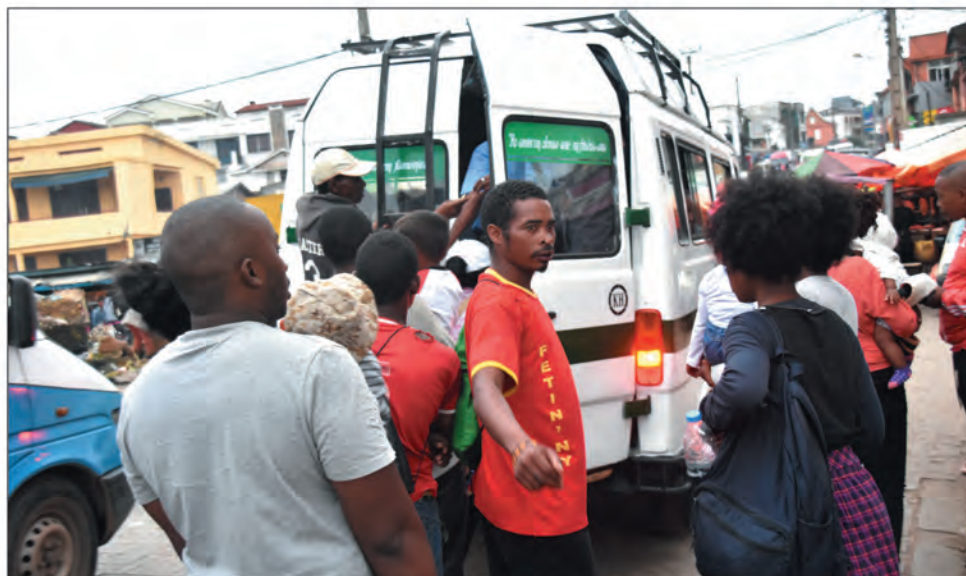
À Ambodivona, la file d'attente pour prendre le bus est interminable.