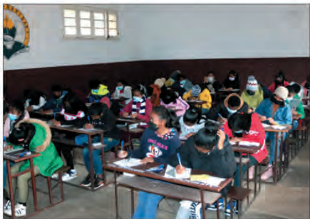
Les candidats auront jusqu'au 31 mars pour s'inscrire au BEPC.