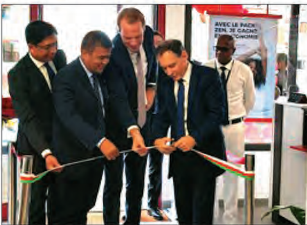
Inauguration de l'agence rénovée d'Ampefiloha.

ment l'organisation interne de l'agence et leur permettra d'être plus agiles" précise la banque dans un communiqué.