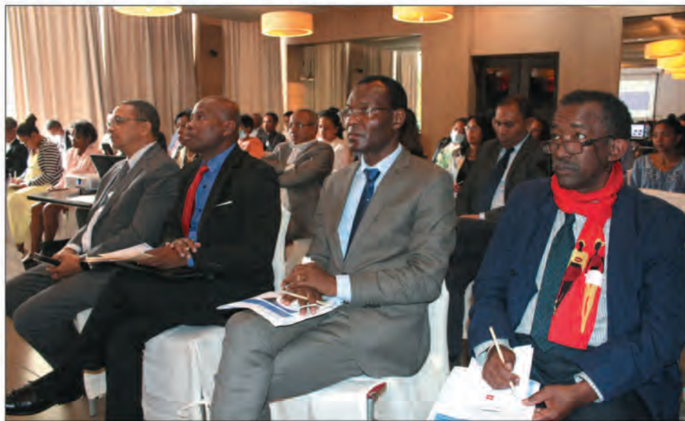
La présentation de la charte pour la promotion de la SST a été effectuée à Ivandry.

rôle central dans l'instauration d'une politique de prévention sur les lieux de travail ». Le groupement affirme également reconnaître « que l'amélioration de la sécurité et de la santé au travail impacte favorablement la qualité, la rentabilité et donc la productivité des entreprises ». À travers la charte, le Groupement des Entreprises Franches et Partenaires sensibilise « les entre-