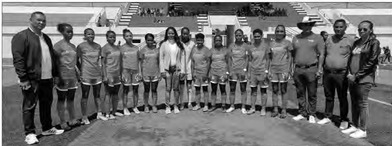
L'équipe de Disciples FF avec les représentants de la Fédération malgache de football.

La formation de Betafo caracole en tête du classement général du championnat de Madagascar de football féminin avec trois points. Les deux prochaines journées seront décisives.