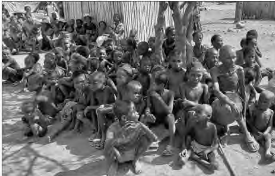
Ce projet contribue à l'amélioration de l'information sur la sécurité alimentaire et nutritionnelle à Madagascar.

toutes les informations qui seront constituées permettront de cerner les enjeux agricoles et déterminer en conséquence les stratégies à adopter.