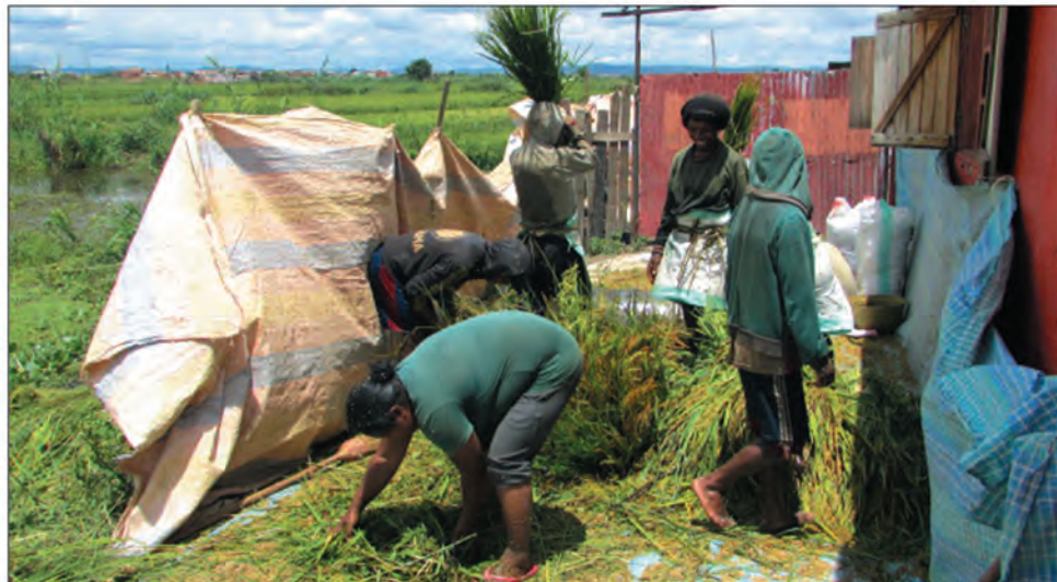
C'est la moisson du Ravak'i Betsimitatatra. La récolte est bonne cette année.