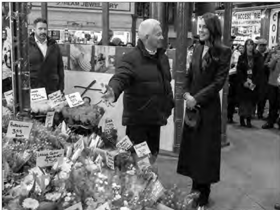
Kate Middleton au marché de Kirkgate à Leeds le 31 janvier 2023

La princesse de Galles a en effet profité de son déplacement dans la métropole du nord de l'Angleterre pour visiter le marché de Kirkgate qui est le plus grand marché couvert d'Europe. Alors qu'elle s'était arrêtée devant l'étal d'un fleuriste, ce dernier n'a pas manqué l'occasion de discuter