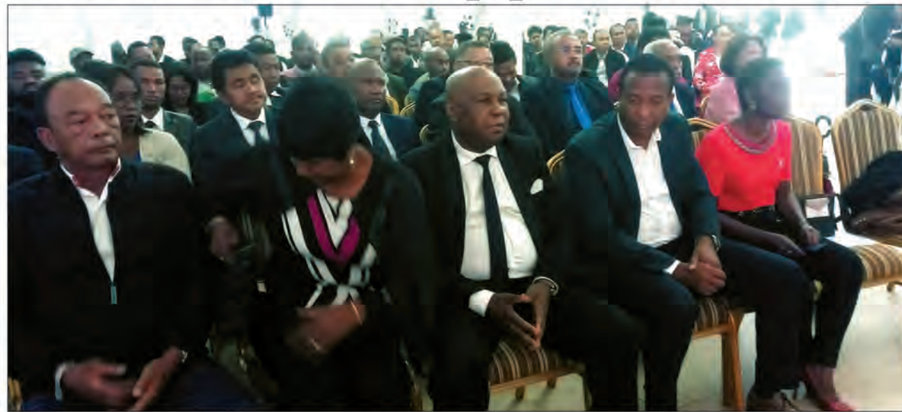
À environ 10 mois de la présidentielle, l'opposition se cherche.

La mise en place de la nouvelle plateforme C LERA, regroupant des parlementaires, des organisations de la société civile, des responsables d'Eglises et de simples citoyens, jeudi dernier, devrait apporter une nouvelle dynamique à l'échiquier politique. Son ambition de rassembler tous ceux qui ne sont plus d'accord avec l'actuel régime devrait constituer un élan fédérateur. Elle cache, cependant, une toute autre réalité. La division risque de devenir insurmontable. Trois plateformes, dont le RMDM, le PANORAMA et C LERA, vont chacune essayer de tirer la couverture de l'opposition alors que ses ténors sont bien conscients qu'une opposition divisée ne fera jamais le poids contre Rajoelina.