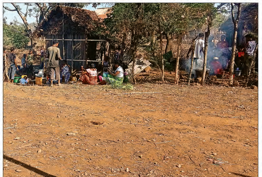
Le monde rural accepte le zarana.