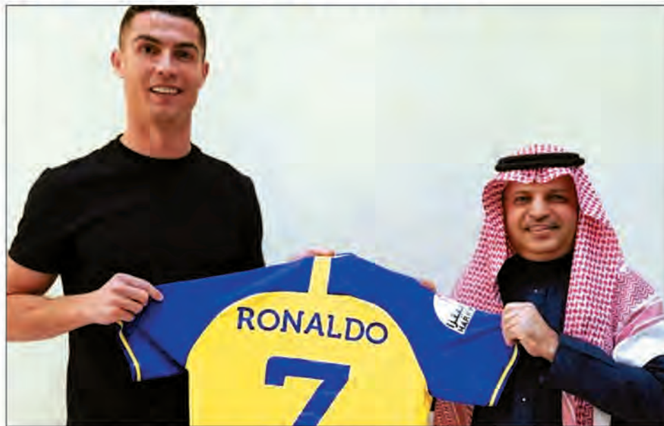
Cristiano Ronaldo s'offre un crépuscule doré en Arabie saoudite.

La nouvelle a très vite fait le tour du monde. Et elle a été très commentée, que ce soit sur les plateaux TV, les émissions radio ou les réseaux sociaux. Cristiano Ronaldo jouera désormais avec Al-Nassr, le leader provisoire du championnat saoudien. Le tout, avec un énorme salaire à la clé puisqu'on parle d'un contrat de deux ans et demi à raison de 200 millions d'euros par an. Difficile à refuser diront beaucoup. Pourtant, divers médias indiquent que les plans de Cristiano Ronaldo ne passaient pas forcément par un exil doré dans un championnat dit de seconde zone. Bien au contraire. Depuis sa signature, plusieurs publications européennes ont indiqué que le Lusitanien voulait rester en Europe et jouer au plus haut niveau. Seulement, il n'aurait tout simplement pas