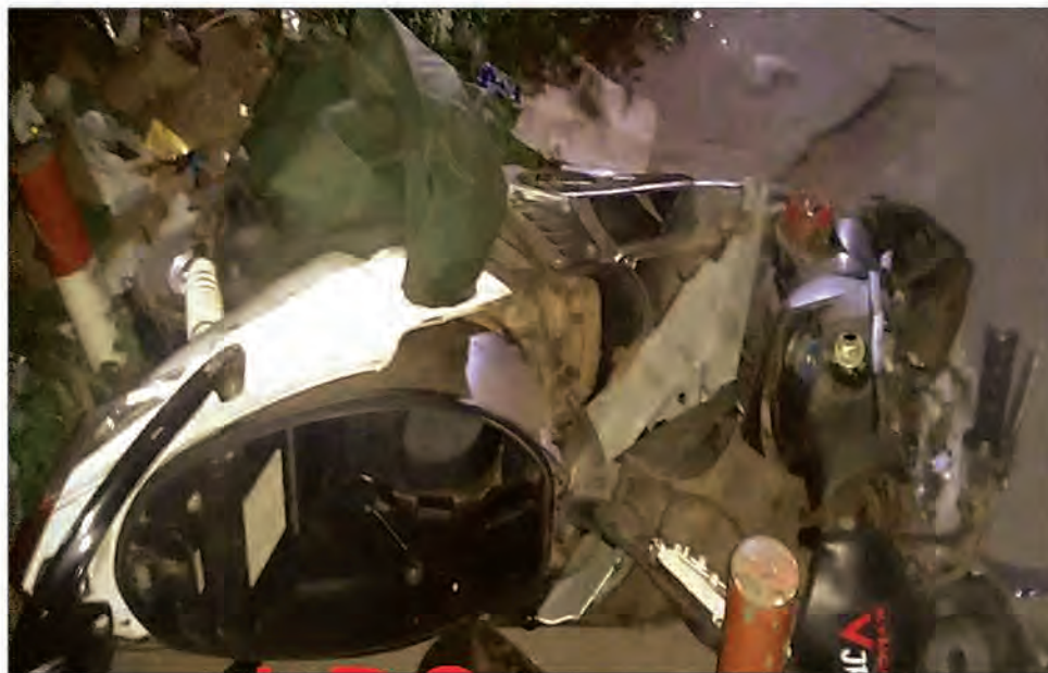
Un accident parmi tant d'autres durant les fêtes.

Rocade Tsarasaotra, hier. Une berline qui roulait à vive allure a fait une sortie de route tout près du croisement d'Ambodifasina. La voiture a fini les quatre roues en l'air dans une rizière. Les riverains et les forces de l'ordre se sont précipités sur les lieux afin d'apporter de l'aide. Le conducteur et quelques passagers ont été mal en point et ne pouvaient