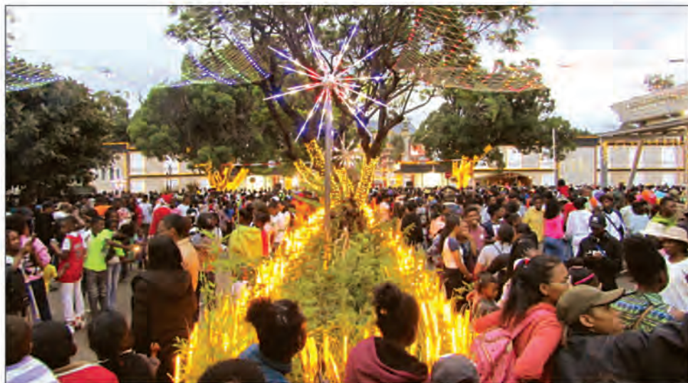
Antaninarenina et ses alentours ont vécu une véritable liesse.