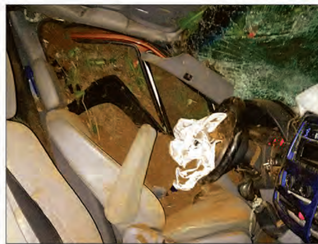
Le taxi-brousse accidenté.