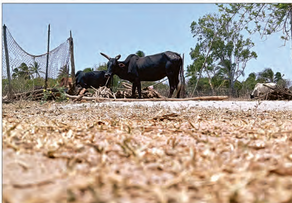
Lors des joro plusieurs centaines de zébus sont abattus.