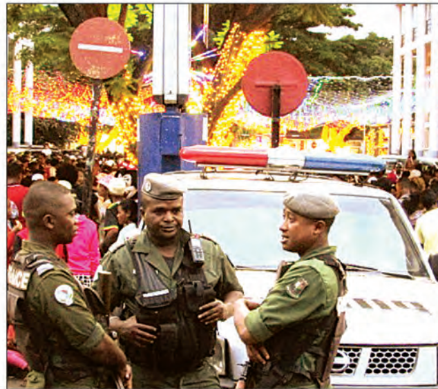
Le Réveillon du 31 décembre et le Nouvel an 2023 en images. C'est une occasion de féliciter les 25 millions de Malgaches et pourquoi pas, les 8 milliards de Terriens.