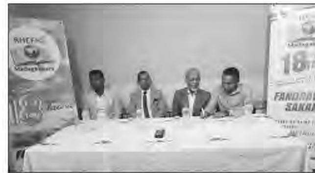
Ireo komitin'ny faha-18 taona nihaona tamin'ny mpanao gazety.