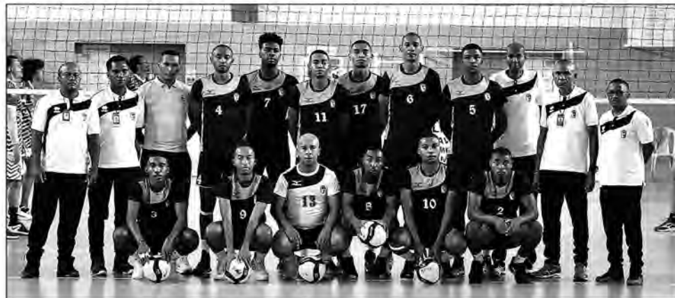
Les gendarmes ont terminé premiers de leur poule.

Les champions de Madagascar filent pour les quarts de finale de la CCC Zone 7 à Maurice. L'équipe de la Gendarmerie Nationale Volley-ball (GNVB) s'est imposée par 3 sets à 1 devant Quatre Bornes de Maurice. Le match a été âprement disputé hier entre les deux équipes. Les hommes de l'entraîneur Honoré Razafinjato ont remporté le premier set par 25 à 22 non sans difficulté. Le second set a été enlevé par les Mauriciens par 25 à 23 après une belle résistance des gendarmes. Avec cette égalité d'un set partout, la