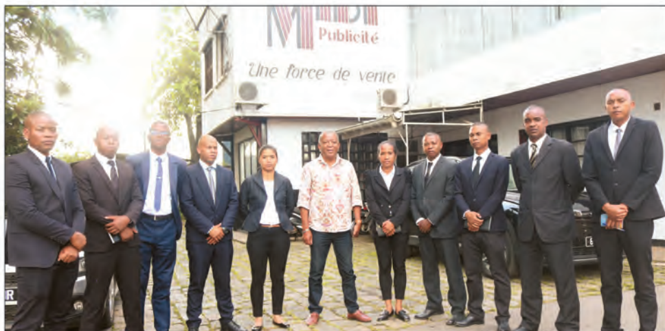
Des élèves Commissaires et Officiers ont visité hier le desk de Midi Madagasikara .