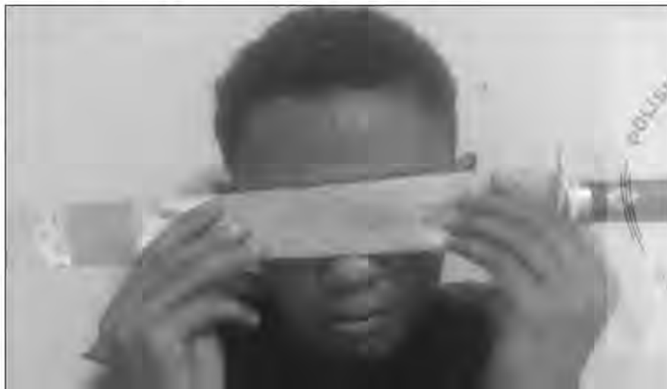
Le détousseur avec son sabre.

les endroits reculés. La police ont mis en place une surveillance discrète afin d'appréhender les voleurs. Ainsi, des policiers en tenue civile se sont rendus sur place pour être au plus près des malfrats. Au final, un des voleurs a été arrêté. En garde à vue, il aurait reconnu les faits de vol à la tire et cambriolage. Il aurait commis