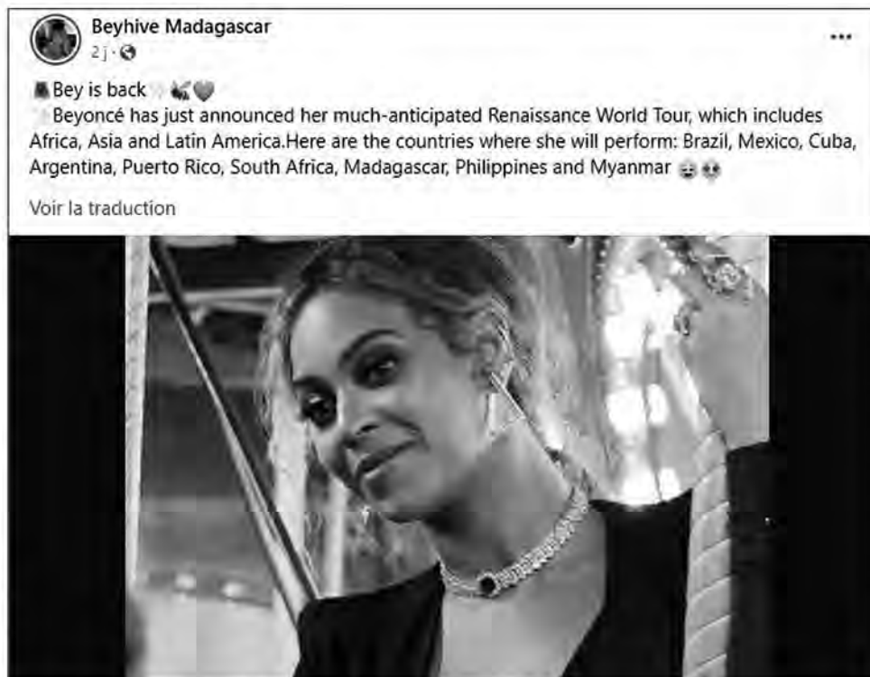
La publication à l'origine du buzz

incrédules, suscitant l'espoir de certains fans. D'après les commentaires, on a pu constater que certains internautes malgaches y ont cru. Mais beaucoup se sont posé la question sur la véracité de cette nouvelle.