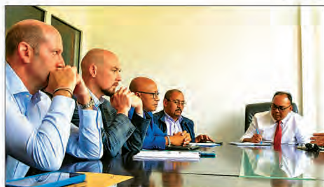
Le ministre Solo Andriamanampisoa exige la transparence dans le cadre de toutes les opérations menées dans le secteur des hydrocarbures.