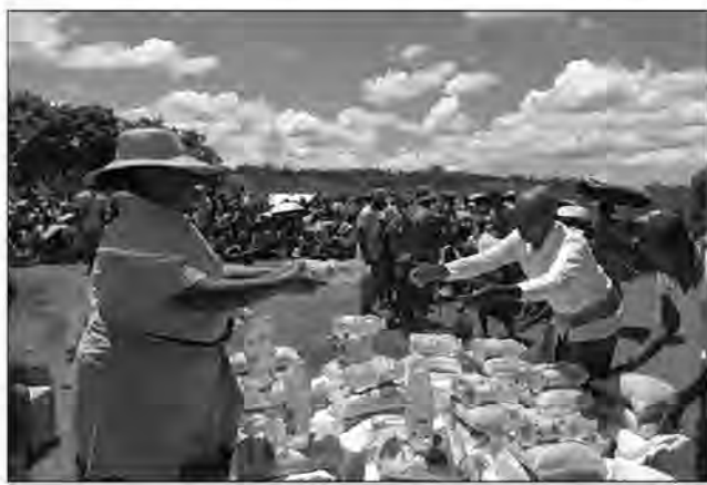
Fizarana ireo fanampiana.