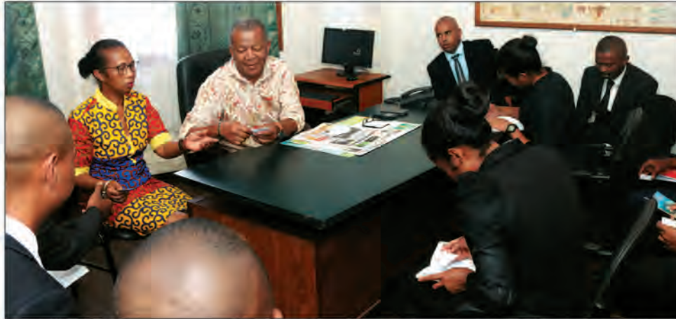
La visite des élèves Commissaires et Officiers entre dans le cadre de leur formation à l'ENSP.

Echange d'informations. La rencontre s'est déroulée dans une ambiance à la fois conviviale et professionnelle qui augure des prochaines relations de travail entre les futurs cadres de la Police et les deux quotidiens qui ont d'ores et déjà procédé hier, à un échange d'informations et à