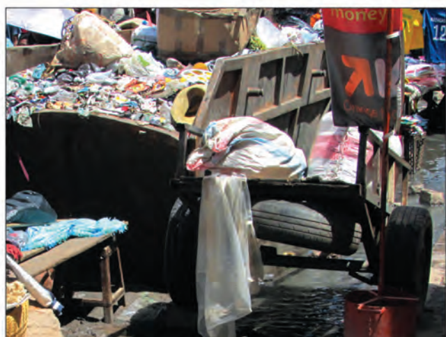
Pour les automobilistes, évitez de circuler à Andra-voahangy surtout tous les mercredis jusqu'à ce que la portion de quelques mètres de route soient réfectionnée ( 1 mois et demi à peu près).