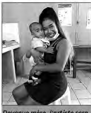
Devenue mère, l'artiste sera plus féministe qu'avant. Elle assume !