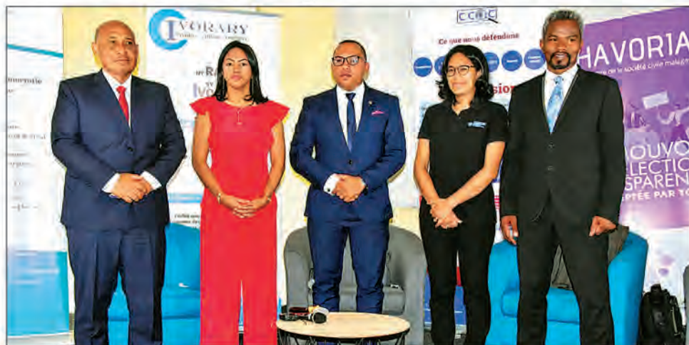
Transparency International Initiative Madagascar reste sur sa position en faveur d'une élection propre et exempte de corruption.

Et ils s'accordent à dire qu'il est nécessaire de mettre en place une loi favorisant la transparence et le plafonnement de la dépense électorale.