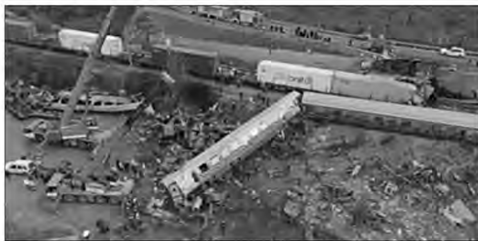
Cette photo aérienne prise par un drone le 1er mars 2023 montre des équipes de secours examinant l'épave après un accident de train dans la vallée de Tempi, près de Larissa, en Grèce.

La collision s'est produite mardi peu avant minuit au nord de la ville de Larissa, dans le centre du pays, à la sortie d'un petit tunnel au-dessus duquel passe une autoroute. Le train de passagers effectuait la liaison entre Athènes et Thessalonique, la deuxième ville de Grèce dans le nord du pays, tandis que le train de marchandises effectuait le trajet inverse. Sous le violent choc frontal, les locomotives et wagons de tête ont été pulvérisés et les conducteurs des deux trains tués sur le coup. Le wagon-restaurant du train de passagers a lui pris feu. "Nous avons ressenti la collision comme un grand tremblement de terre", a témoigné un passager, Angelos, 22 ans, sur les lieux de l'accident. "Heureusement, nous étions dans l'avant-dernière voiture et nous en sommes sortis vivants. Il y a eu un incendie dans les premières voitures et la panique s'est ensuivie. C'est un cauchemar que j'ai vécu (...) Je tremble encore", a-t-il poursuivi.