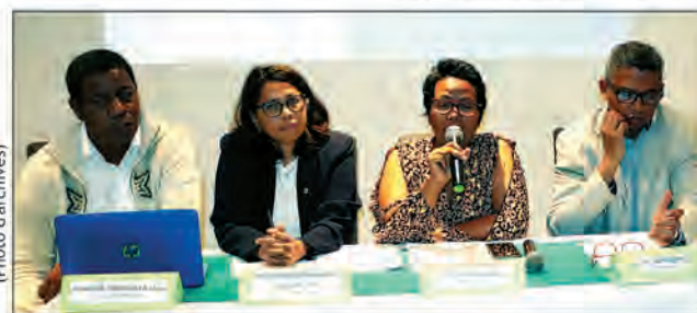
Le Mouvement Rohy estime qu'il y aurait un contexte pré-électoral très sensible.

Organisation mondiale de la Santé AVIS D'APPEL D'OFFRE OUVERT ITB N° 106 – 2023 SDSPSM / MDG RELANCE ITB N° 215 – WHELBSM – MDG – 2022 TRAVAUX DE REHABILITATION Date de première publication : mercredi 1 er mars 2023 Date de clôture : vendredi 10 mars 2023 à 12 heures