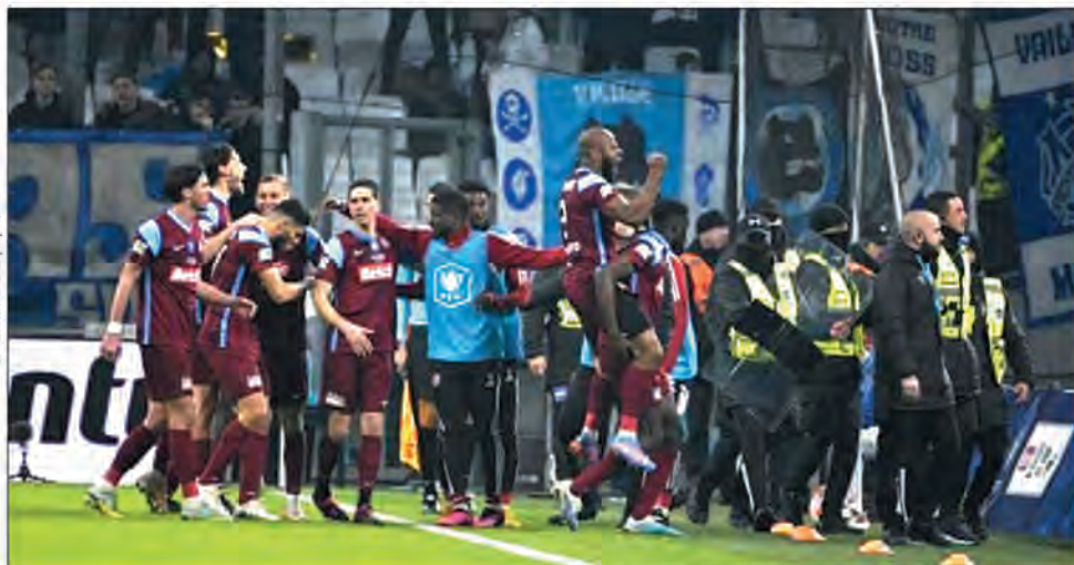
Les joueurs d'Anncy après le deuxième but.

Le match : 2-2 (7 tab à 6) C'est une énorme désillusion. En l'espace de quelques jours, l'Olympique de Marseille a sûrement perdu le titre en Ligue 1 (après sa défaite dans le Classique contre le PSG, 0-3) et son rêve de soulever un trophée cette saison.