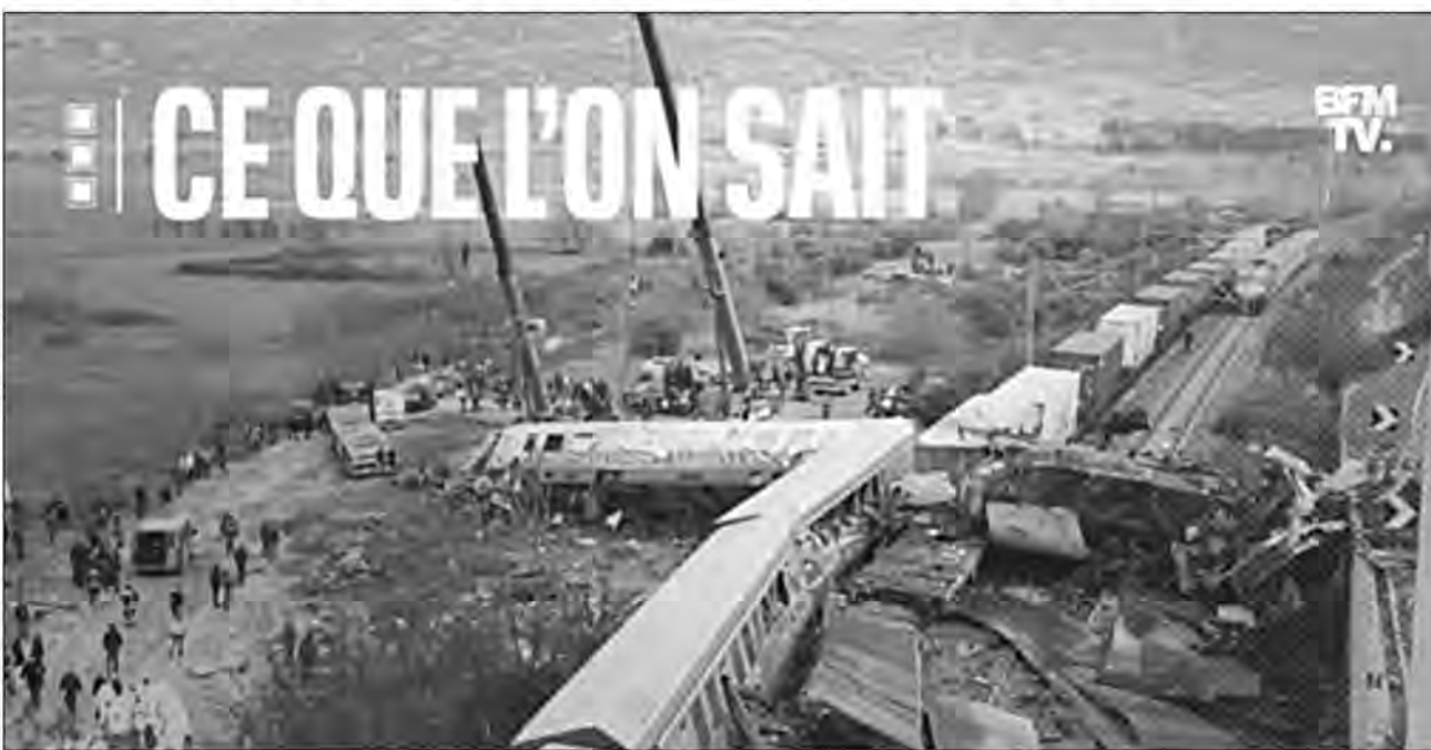
Au moins 32 personnes ont péri et 85 ont été blessées mardi soir dans une collision entre un convoi de marchandises et un train de passagers effectuant le trajet entre Athènes et Thessalonique, en Grèce.

L'accident survenu dans la nuit de mardi à mercredi a fait au moins 38 morts et 85 blessés. Un décompte qui "devrait augmenter" alors que les opérations de secours se poursuivent. Pour une raison pour l'instant inconnue, les deux trains circulaient sur la même voie "depuis plusieurs kilomètres". Aux premières lueurs du jour, des images montraient des wagons calcinés dans un enchevêtrement de pans de métal et de fenêtres brisées, des secouristes tentant de dégager des survivants tandis que d'épaisses fumées s'échappaient encore d'autres wagons accidentés et renversés sur le côté. D'après les médias locaux, il s'agit du "pire accident ferroviaire que la Grèce ait jamais connu". Un train avec 342 passagers à son bord est entré en collision avec un convoi de marchandises, faisant au moins 38 morts.