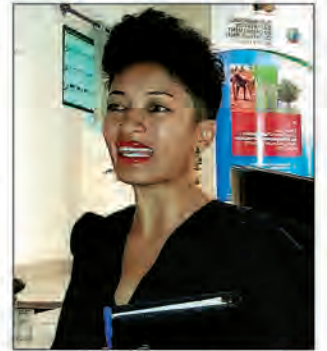
La nouvelle directrice du cabinet du président de la République parle couramment le russe.