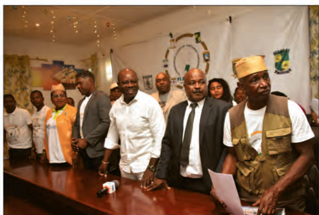
L'association FIZAFALI a organisé une grande cérémonie pour célébrer la nouvelle année.