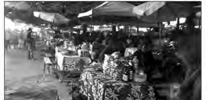
Les adeptes du " vendredi joli " seront servis ce soir.