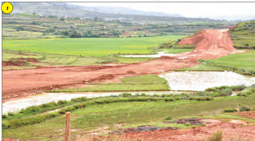
Photo (1) (2) : Quel avenir pour la construction de l'autoroute Tana-Toamasina devant le choix du président de se pencher sur les besoins vitaux de la population ?