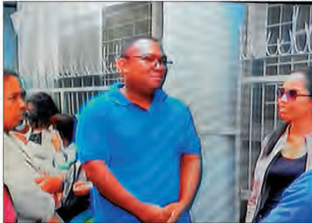
Les représentants des entreprises qui réclament le paiement de leurs factures, devant le Trésor Public à Antananarivo.

Les signes se multiplient. L'Etat manque-t-il vraiment de ressources financières pour assurer ses dépenses incompressibles ? Hier, les fournisseurs et entreprises prestataires ayant contracté des marchés publics ont manifesté devant le Trésor public à Antananarivo, pour réclamer le paiement de leurs factures. « Nous sommes des milliers d'entreprises à travers la Grande île, à souffrir de cette situation. Mais nous ne sommes ici que des représentants