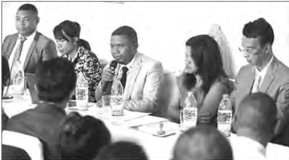
Lors de la conférence-débat sur la lutte contre la corruption dans l'enseignement supérieur.

mais présente dans 17 régions de Madagascar, a pour vocation d'orienter les étudiants à créer leurs propres projets de développement ou à monter leurs propres entreprises. Ils deviendront ainsi un vivier de dirigeants de demain. Raison pour laquelle, « il s'avère important de former ces étudiants à ne jamais être tentés par la corruption dès leur formation à l'université. Et à l'instar des stages pratiques offerts