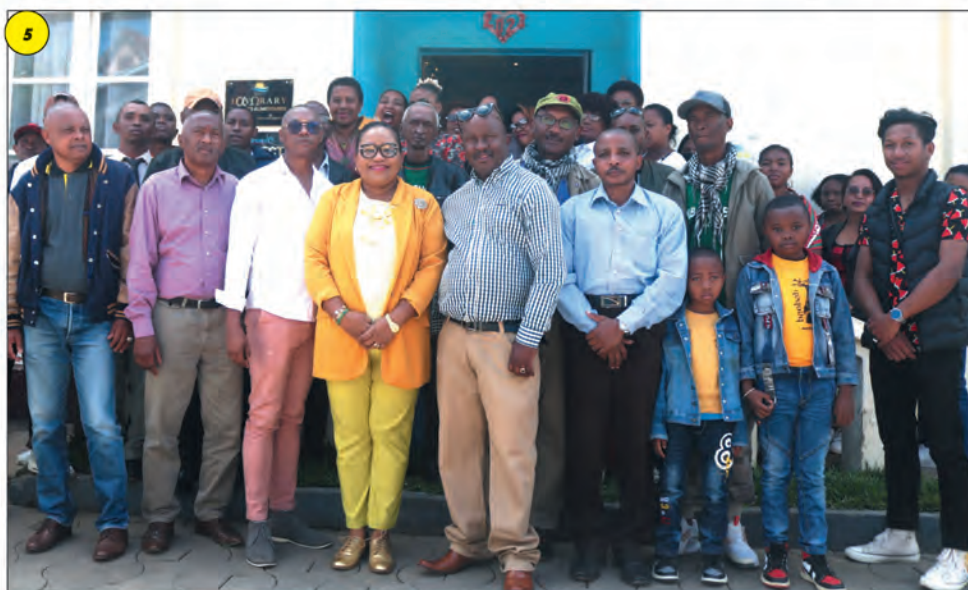
Photo (4) : La digue reliant le FKT d'Ambohimangidy, commune d'Ampitatafika au FKT d'Arombato dans la commune d'Alatsinainy Ambazaha est totalement submergée.