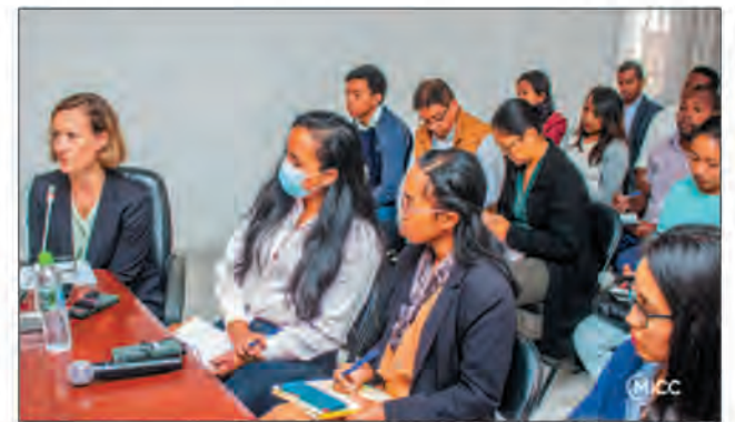
Les parties prenantes ayant participé à cette réunion organisée par le MICC, hier.