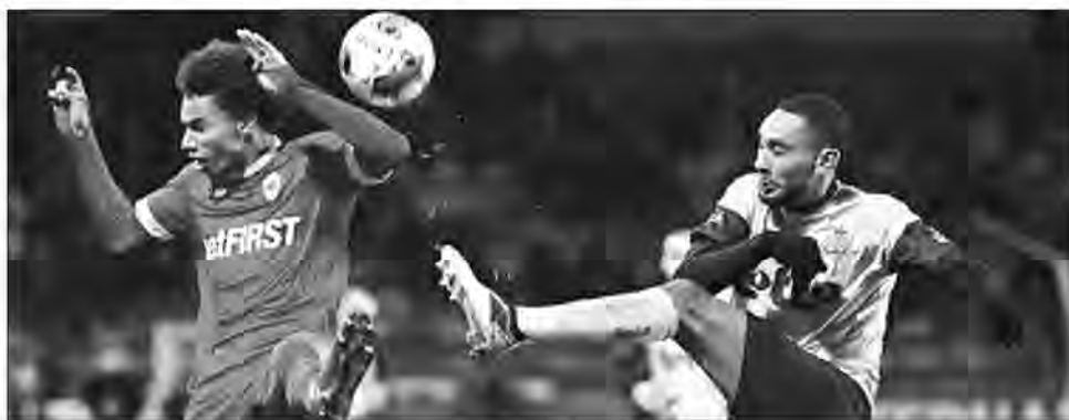
Après quelques galères, Lapoussin is back.