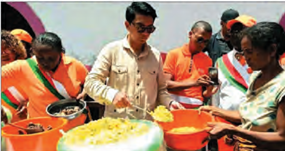
Le président de la République a offert des repas chauds, hier, à Marovoay.

plusieurs centaines de déplacés, des zones inondées et des maisons détruites. Rien qu'à Ankaboka, 167 foyers ont été déplacés. Andry Rajoelina a annoncé des chapelets de dons en guise de premier secours et qui seront destinés à soutenir les sinistrés de cette zone. En tout cas, il a réitéré que la question sociale sera son nouveau credo, comme il