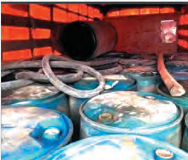
Carburant frelaté, de nouvelles victimes se plaignent.

Impunité. À Toamasina, des chauffeurs et de simples employés ont été incarcérés mais pas les gros poissons. Un scénario qui se perpétue. La dernière en date est l'affaire