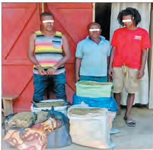
Ilay mpamily sy ny mpanampy azy ary ilay mpitondra rongony natao andrimaso.