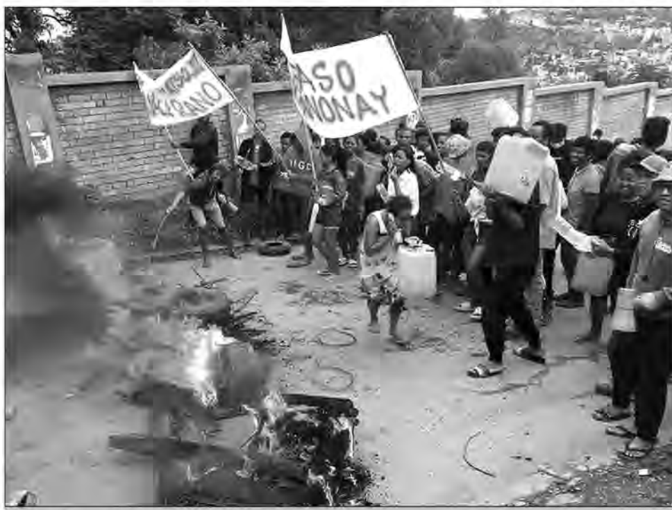
Les étudiants sont descendus dans la rue.