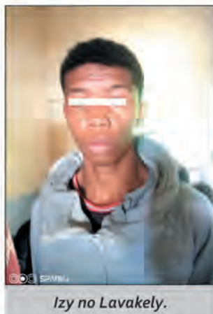
Izy no Lavakely.

Efa ikoizana teny amin'ny faritra Ambohimanarina sy ny manodidina iny ry zalahy ireto amin'ny asa ratsy sy ny fanendahana olona, indrindra raha vao manomboka miha-hariva fotsiny ny andro. Ny talata lasa teo, tsy naha-Lavakely an-dry zalahy intsony ny pôlisy mpanao fisafoana. Tra-tehaka teo am-panaovana ny asa ratsiny. Ho an'ireo mponina sy ny mpandalo eny Ambohimanarina eny dia samy miara-mahafantatra fa anisan'ny faritra mena amin'ny resaka tsy fandriam-pahalemama, indrindra moa fa hoe miditra elakelan-trano, somary mangingina na maizimaizina, tsy dia misy mpandalo. Fantatry ny eo anivon'ny pôlisy misahana iny faritra iny raha-