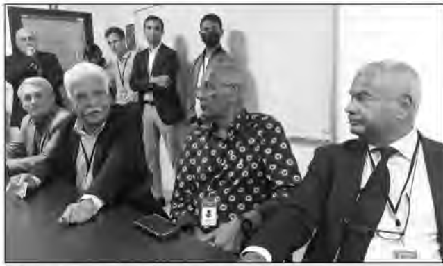
Dîner-débat organisé par le Carrefour des Entrepreneurs de l'Océan Indien.