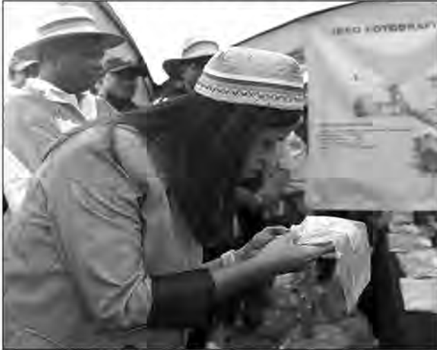
La ministre de l'Environnement et du Développement durable visitant le stand d'Ambatovy.

qui marquait également le début de la campagne de reboisement de la région Alaotra Mangoro, s'est tenue à Maromahatsinjo, dans l'aire protégée de Torotorofotsy qui abrite un des sites RAMSAR de Madagascar, dans le district de Moramanga.