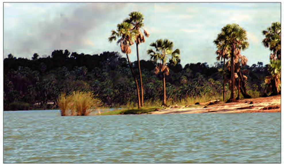
Le fleuve Mahavavy, qui traverse le district d'Ambilobe.