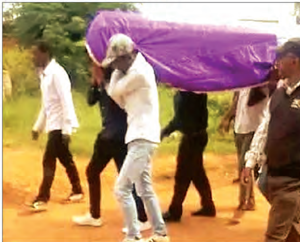
Le père de famille décédé dans l'incendie.

intervenues très rapidement, à leur arrivée, le feu était déjà très avancé et quatre maisons en bois étaient la proie des flammes. Ces derniers ont quitté les lieux quelques heures après. Sur