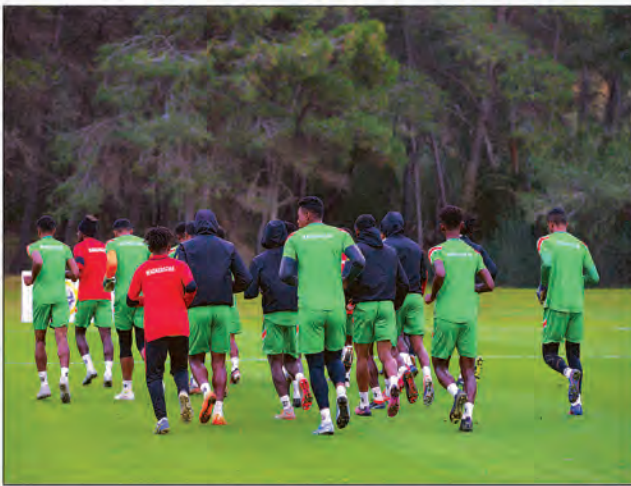
Premier test des Barea ce jour en Tunisie.

gural contre les Ghanéens. « C'est un match très important et nous nous devons de le remporter, c'est notre premier objectif », a fait savoir le coach. Les Lions de l'Atlas du Maroc, les tenants du titre, seront au menu des Barea lors de la deuxième journée du 19 avant d'affronter les Crocodiles du Nil du Soudan le 23 janvier. À propos du Maroc, l'incertitude plane toujours au sujet de sa participation au tournoi à huit jours du coup d'envoi. En colère contre son voisin et pays-hôte, l'Algérie, qui a coupé les vœux directs en provenance du Royaume en raison des relations diplomatiques tendues, le double tenant du titre menace en effet de boycotter la compétition si sa sélection ne peut pas rejoindre directement Constantine. « Ce pro-