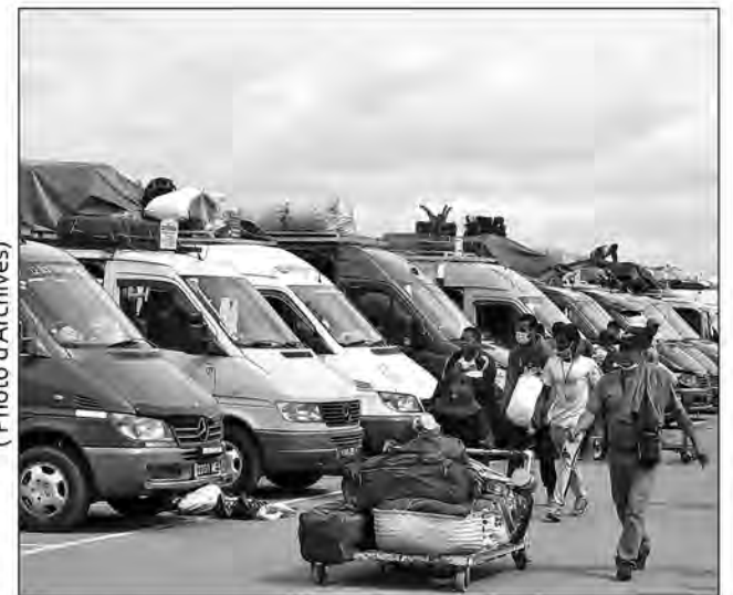
La gare routière d'Andohatapenaka reste passablement animée.