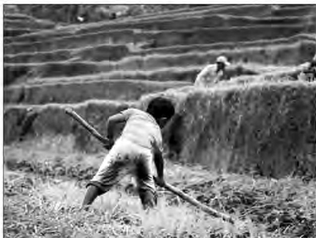
Le travail agricole touche davantage les garçons tandis que le travail domestique ou d'aide familiale, concerne davantage les filles.