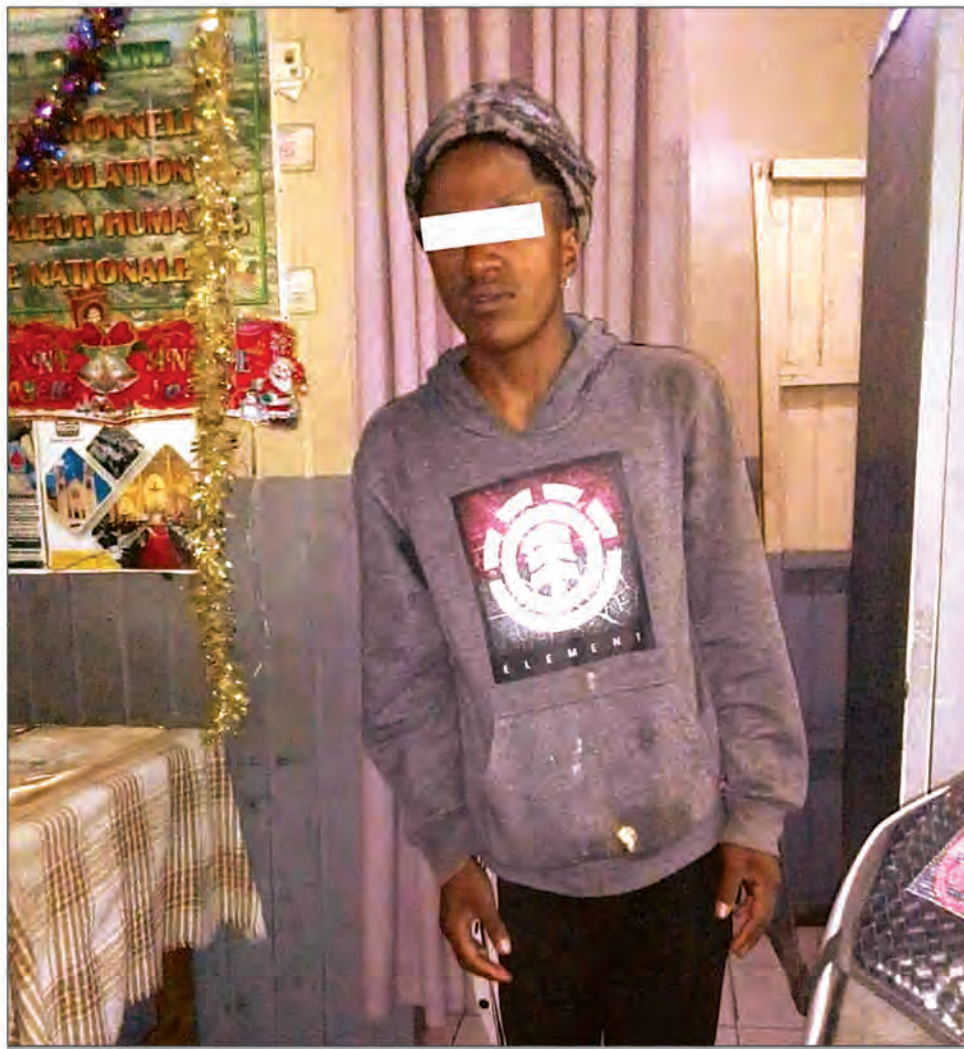
Le jeune homme arrêté.