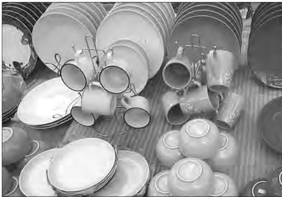
Les vaisselles et les ustensiles de cuisine font partie des articles proposés à la vente par des ménages en difficulté, pour pouvoir tenir jusqu'à la fin du mois.

tany. Le rideau est tombé, en effet, sur les fêtes de fin d'année au cours desquelles les familles ont effectué des dépenses plus ou moins conséquentes. La reprise du train-train quotidien, se fait avec difficulté si l'on se réfère aux soucis financiers auxquels font déjà face certains ménages, dont le nombre est difficilement quantifiable. Ces cas sont néanmoins visibles sur le terrain comme sur les réseaux sociaux, canaux choisis par cer-