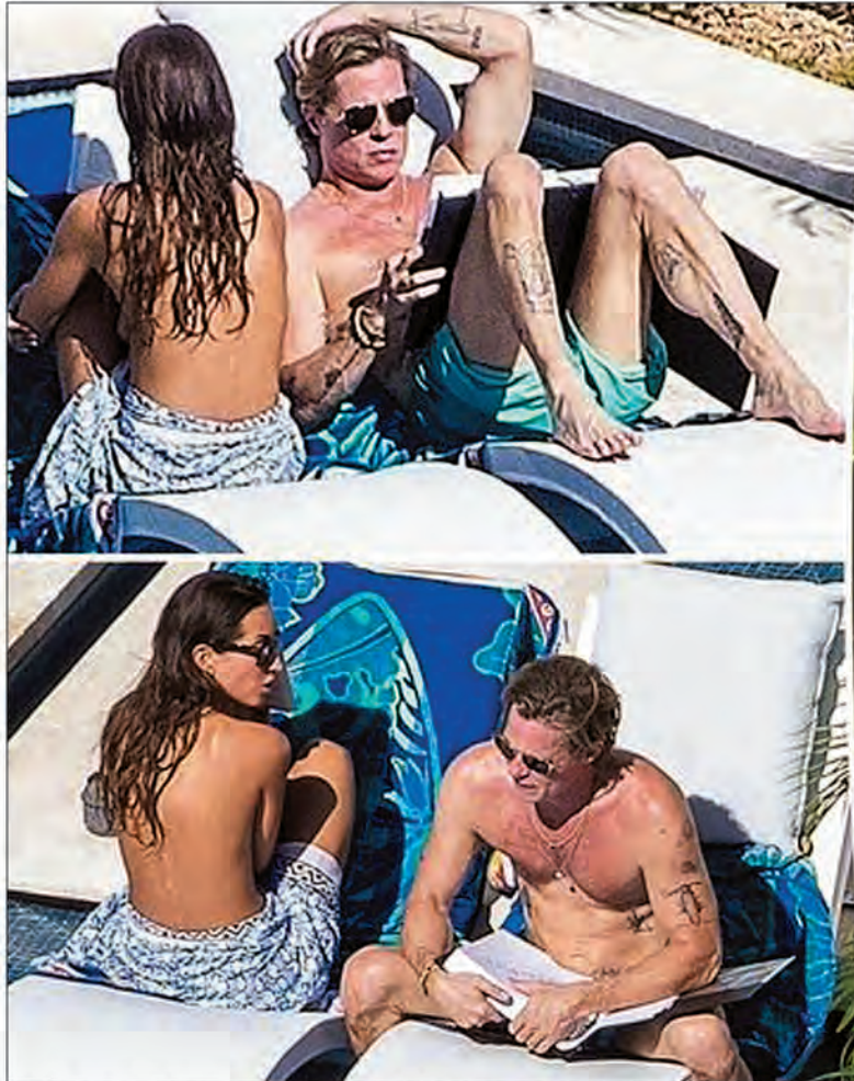
en tant qu'amis et apprécient vraiment la compagnie l'un de l'autre,» expliquait-on dans la

Brad Pitt très « amoureux » d'Ines De Ramon. Ce n'est pas la première fois que Brad Pitt, anciennement en couple avec Angelina Jolie ou Jennifer Aniston, est aperçu auprès d'Ines de Ramon. Les tourtereaux avaient été repérés, pour la première fois, alors qu'ils allaient applaudir un concert de Bono à Los Angeles, en novembre 2021. C'est au côté de la jeune femme de 32 ans, toujours, que l'acteur a célébré ses 59 ans le 18 décembre dernier. Selon Us Weekly , ces deux-là ne seraient pas « officiellement ensemble » mais l'acteur serait assurément « amoureux » de la belle créatrice de bijoux. « Ils ont passé du temps ensemble