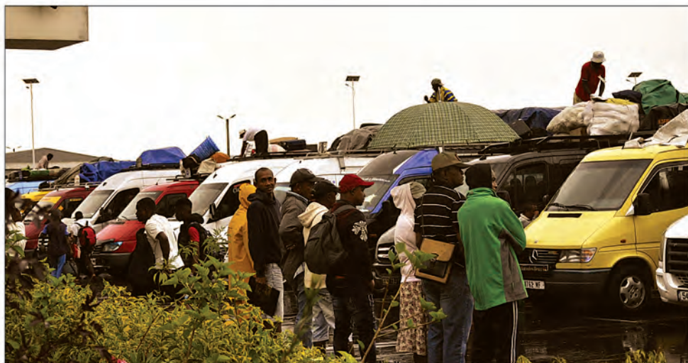
Le flux des passagers est important à la gare routière d'Andohatapenaka en cette période de fin de vacances.