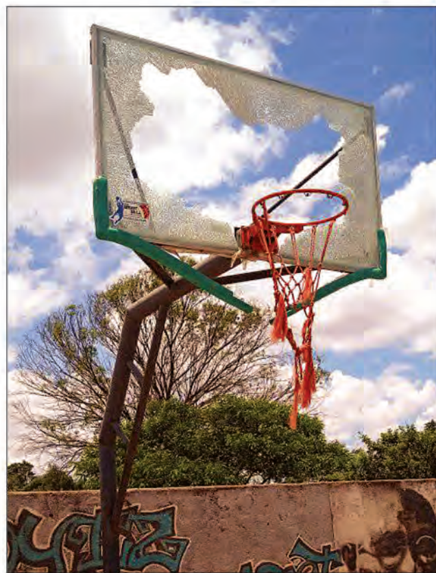
Le reste du panneau en plexiglas du terrain de basket numéro 1 d'Ankatso.