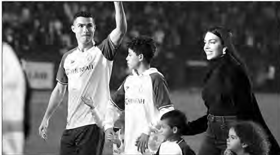
Un accueil triomphal pour Cristiano Ronaldo en Arabie Saoudite

La superstar du football mondial, Cristiano Ronaldo, ne peut pas encore jouer à Al-Nassr car le club saoudien a dépassé son quota de joueurs étrangers, ont indiqué jeudi des responsables du club à l'AFP. L'attaquant portugais, considéré à 37 ans comme l'un des plus grands footballeurs de tous les temps, avait affirmé mardi à Ryad vouloir jouer dès que possible, à commencer par le match à domicile contre Al-Ta'ee initialement prévu jeudi, et reporté à vendredi. Mais Cristiano Ronaldo, dont le contrat jusqu'en juin 2025 est estimé à 200 millions d'euros, est le neuvième joueur étranger à rejoindre Al-Nassr, dépassant le maximum de huit autorisés par la fédération saoudienne de football. «Al Nassr ne l'a pas encore enregistré car il n'y a pas de place vacante pour un joueur étranger», a déclaré à l'AFP un responsable du club, sous couvert d'anonymat, n'étant pas autorisé à parler aux médias. «Un joueur étranger doit partir pour que Ronaldo puisse être enregistré, soit à