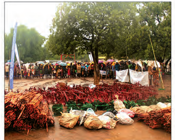
Remise de petits matériels agricoles aux participants du projet CERF, dans le district d'Ampanihy.