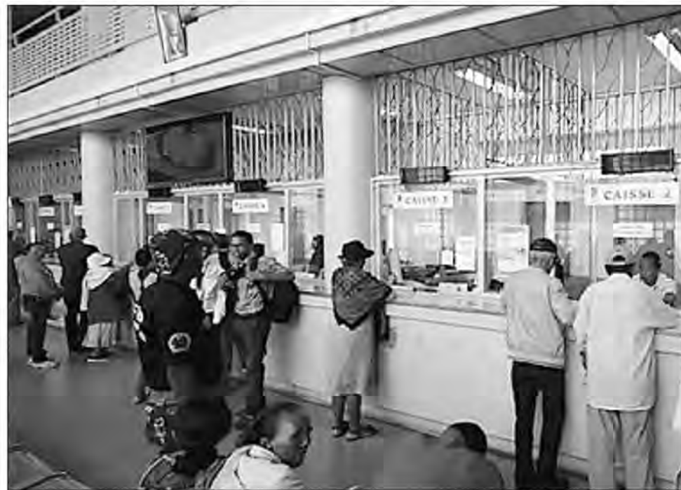
Selon le calendrier du Trésor public, les retraités seront payés à partir du 10 du mois

Sésame. Le décret 2023-006 du 4 janvier 2023 portant répartition des crédits autorisés par la loi n° 2022-015 de finances 2023 a été adopté en conseil de gouvernement, apprend-on de source autorisée. Une étape suivie normalement de la publication de l'arrêté d'ouverture de crédits qui constitue en quelque sorte le sésame qui ouvre la porte des dépenses publiques dont les salaires des fonctionnaires. En effet, comme leur nom l'indique, ces deux textes réglementaires répar-