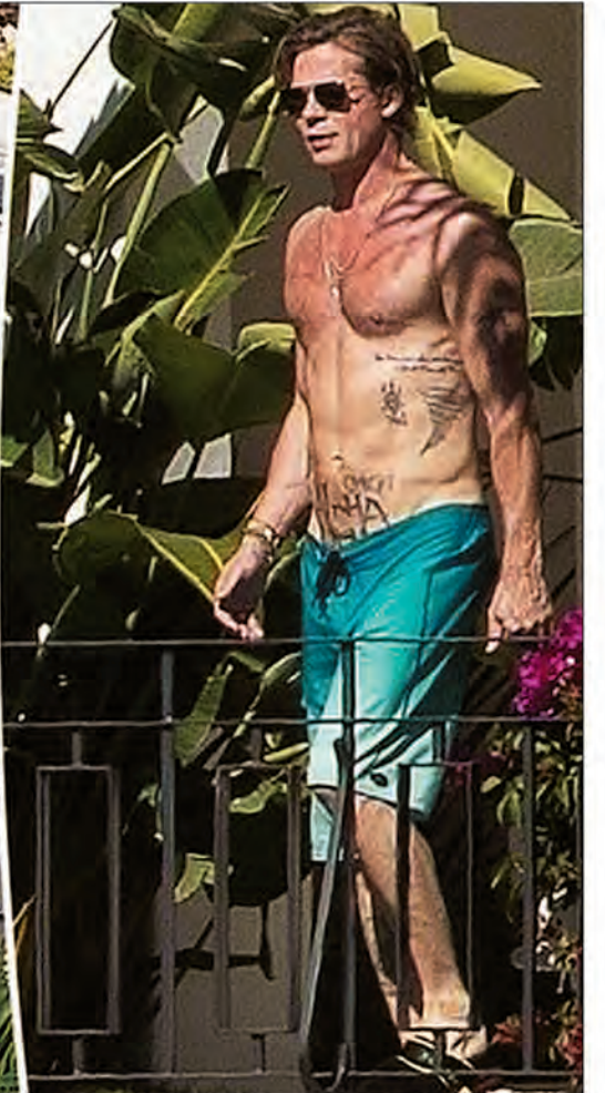
publication. « Brad Pitt ne s'attendait pas à trouver quelqu'un d'aussi extraordinaire