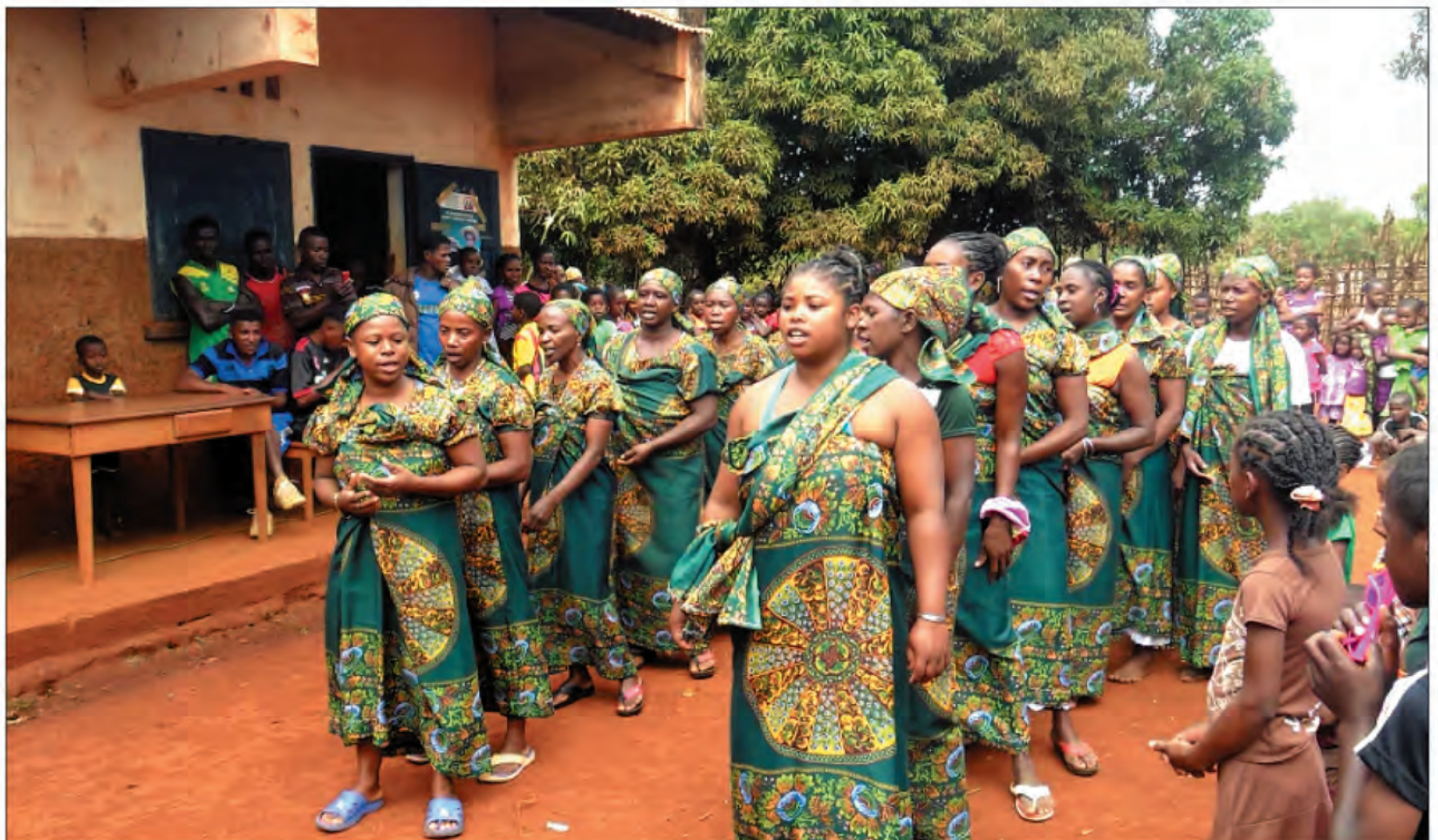
Le tsanga-tsaina , la cérémonie culturelle héritée de Tsimatahodrafy.

Comme toutes les légendes, les versions sont différentes, parfois s'entre mélangent, il est difficile de saisir un récit sans prequel. En outre, les connaisseurs de la légende