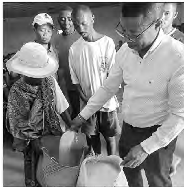
Les bénéficiaires des dons de l'association TMT.