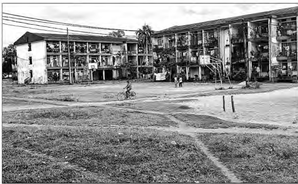
Les travaux de réhabilitation sont prévus prendre fin le 21 janvier.