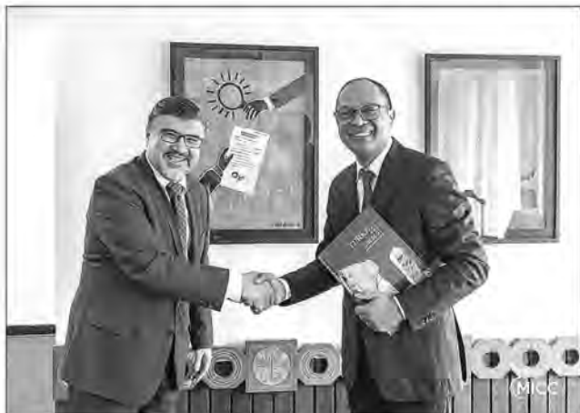
C'est partie pour le renforcement des échanges entre Madagascar et la Turquie