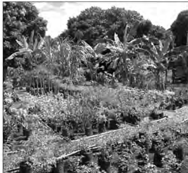
Reboiser 100 ha de terrain dans toute l'île est l'objectif attendu lors de cette campagne.