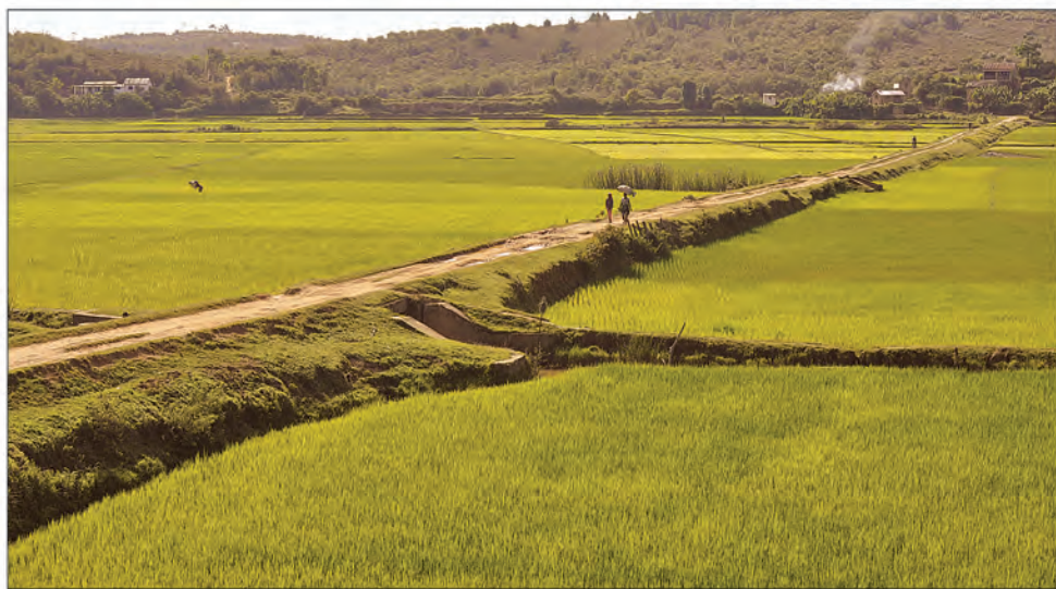
Des rizières aux couleurs verdoyantes longeant la RN3 après le repiquage.