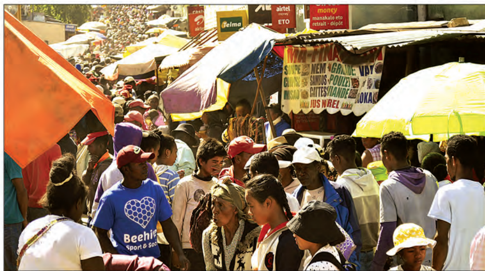
Le samedi, jour de marché de Mangamila, connaît toujours une affluence énorme.