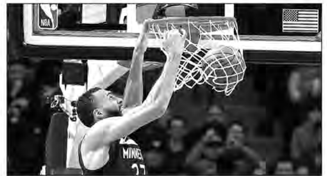
Rudy Gobert a inscrit 17 points lors de la victoire des Timberwolves.