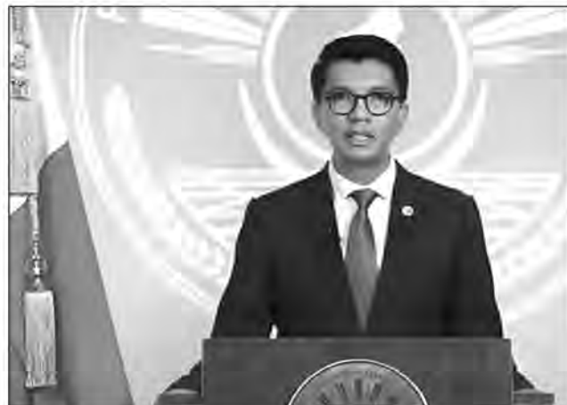
CASEF figure parmi les projets performants cités par le président de la République, dans son discours de fin d'année 2022.