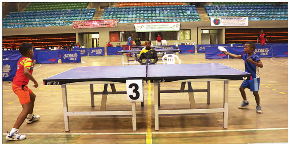
Le Palais des Sports Mahamasina hébergera les championnats nationaux de tennis de table toutes catégories jusqu'au 8 janvier 2023.