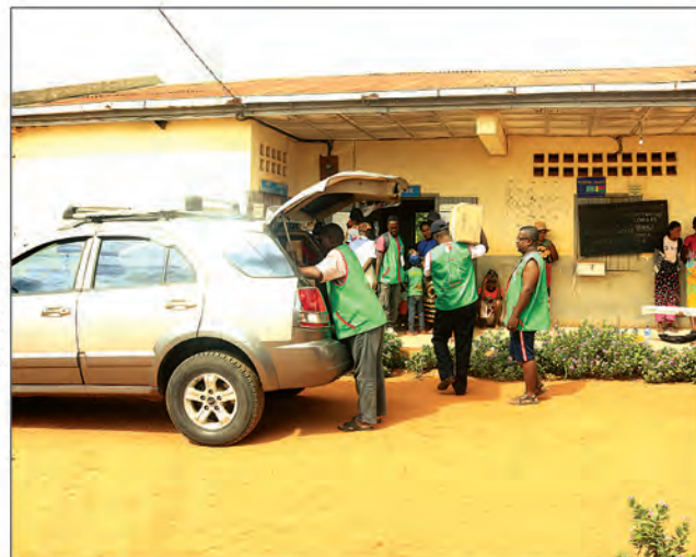
ONG E.F.F.M, soutien à Belo sur Tsiribihina.