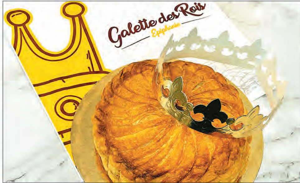
La galette des rois proposée à l'occasion de la célébration de l'Épiphanie.

d'une tradition culinaire faite à base de pâte feuilletée garnie de frangipane et d'une pâte d'amande sur laquelle sont parsemées des amandes effilées. En outre, un petit objet appelé fève qui est souvent en porcelaine est caché à l'intérieur de cette galette des rois avant sa cuisson. La personne qui le trouve devient le Roi ou la Reine de la journée tout en portant la couronne en papier doré qui accompagne ce gâteau spécial. A l'instar de