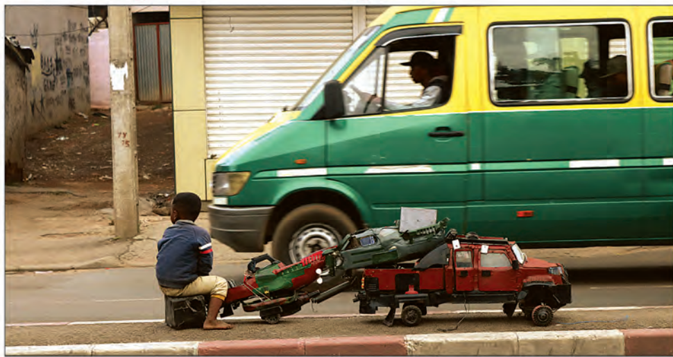
"Un jour je conduirai une vraie voiture"