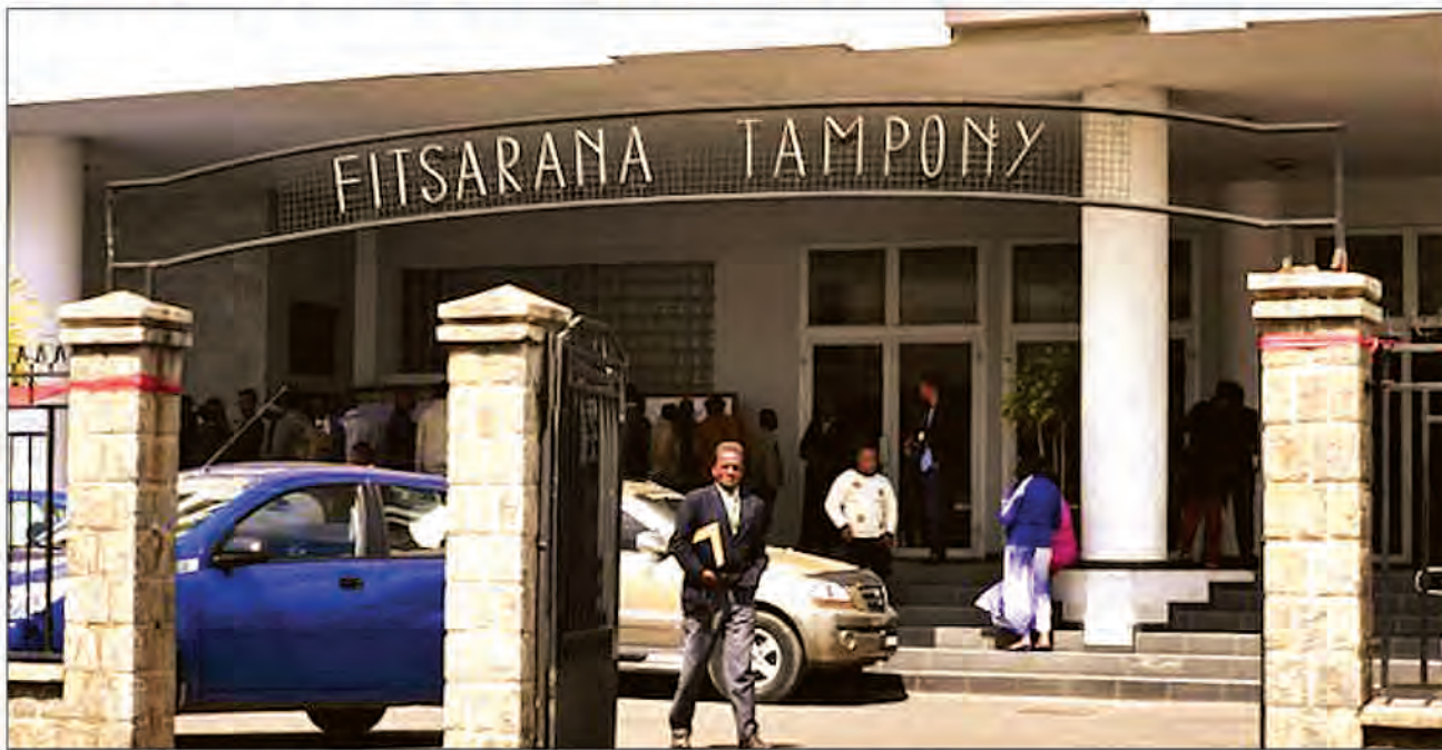
Le Conseil d'Etat ne s'est pas encore prononcé sur la note du président de la CENI

niveau du Fokontany pour une période de quatre mois allant du 1er octobre 2022 au 31 janvier 2023".