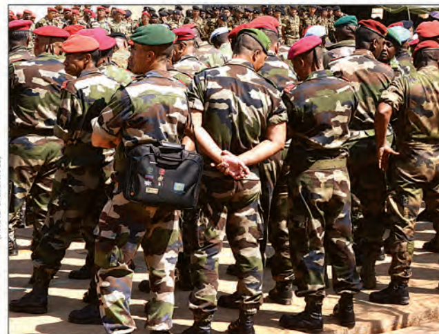
Les forces armées font l'objet de propos provocateurs ces derniers temps.