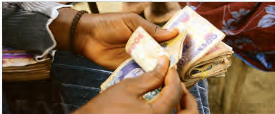
Les Nigériens ne pourront plus retirer que 20 000 nairas par jour en "cash", soit 42 euros, dans une limite de 500 000 nairas par semaine, soit 1 050 euros environ.