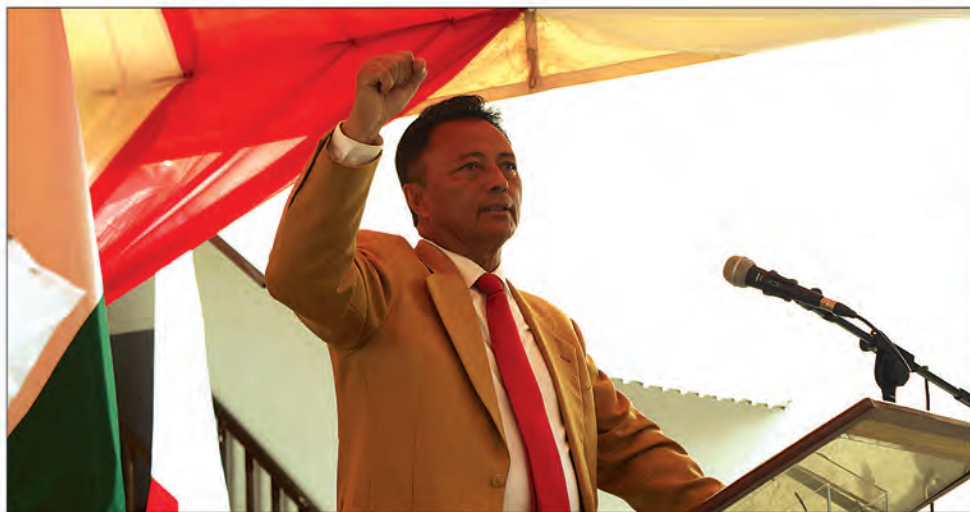
Le Rodoben'ny Mpanohitra ho an'ny Demokrasia eto Madagasikara (RMDM), regroupant la majorité des partis politiques de l'opposition, a présenté ses vœux à l'ancien président Marc Ravalomanana à sa demeure, à Faravohitra.