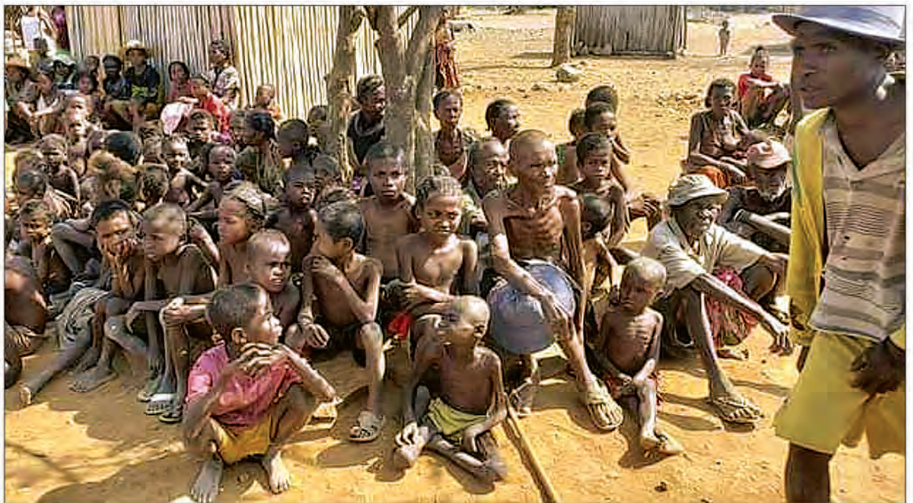
La faim persiste dans le Sud malgré les millions et milliards d'ariary alloués chaque année.

Intacts. La situation serait moins alarmante pour le Grand Sud Est de Madagascar. À en croire l'IPC, les moyens d'existence restent plus ou moins intacts sauf pour les districts de Nosy Varika,