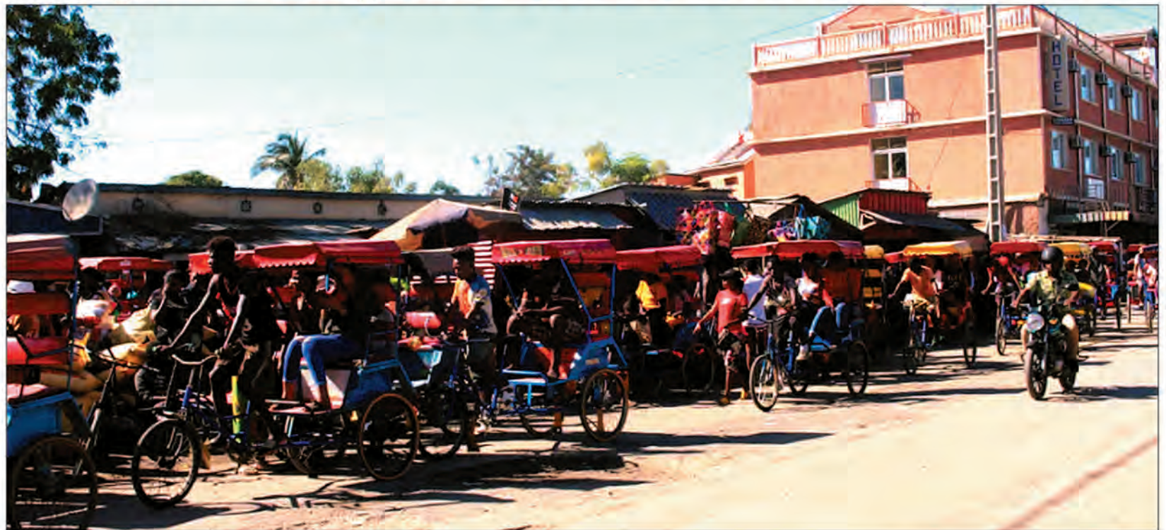
Les cyclo-pousses font la loi dans la circulation urbaine à Toliara.