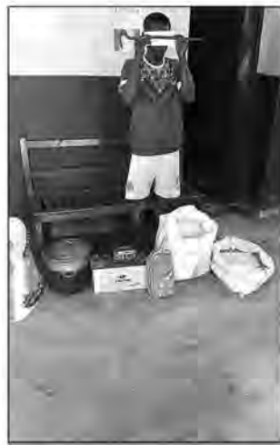
Le bandit arrêté et ses butins.