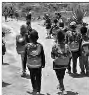
Investir dans l'éducation génère un excellent rendement.

Aide aux enfants touchés par des crises. C'est dans ce sens qu'une conférence, de haut niveau sur le financement (HLFC) de l'Education Sans Délais (education cannot wait ou ECW), sera organisée à Genève en Suisse les 16 et 17 février prochains. Le Conseil du gouvernement du 4 janvier a donné son accord pour la participation du ministère de l'Education nationale (MEN) à cette rencontre. L'étude de l'organisation "éducation sans délai" révèle que 222 millions d'enfants touchés par des crises ont urgemment besoin d'aide en matière d'éducation. Sur ces 222 millions d'enfants et d'adolescents ayant besoin d'un soutien éducatif urgent, pas moins de 78 millions sont déscolarisés et près de 120 millions, bien que scolarisés, n'atteignent pas les compétences minimales en mathématiques ou en lecture. Avec cette interruption brutale de l'éducation de 222 millions d'enfants dans le monde, le chef de l'ONU exhorte les gouvernements, les entreprises, les fondations et les particuliers à soutenir le travail essentiel accompli par l'éducation sans délai. « Rendons l'éducation accessible à chaque enfant, où qu'il se trouve. Aidez-nous à faire perdurer 222 millions de rêves », a