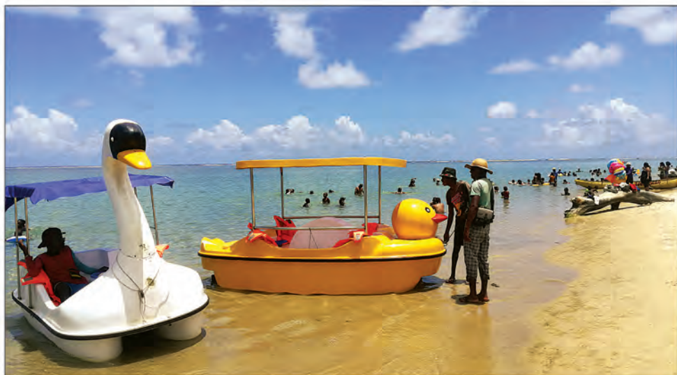
La plage de Foulpointe se vide petit à petit en cette période de début du second trimestre.