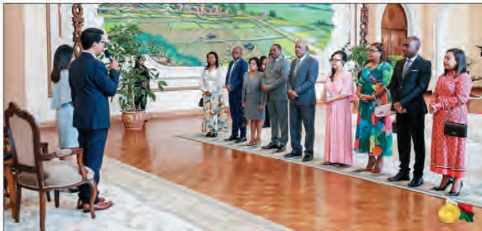
La Haute Cour Constitutionnelle présentant ses vœux du nouvel an au couple présidentiel.

Comme à l'accoutumée, depuis les quatre années de pouvoir du président Andry Rajoelina, il n'y aura pas de banquet officiel de présentation de vœux réservé aux corps constitués cette année. Politique d'austérité budgétaire oblige. En revanche, le couple présidentiel a donné une occasion à tous les hauts responsables étatiques de présenter leurs vœux de Nouvel An lors d'une rencontre sobre et sans tam-