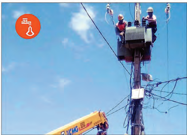
De très nombreuses micro coupures d'électricité ont été constatées, hier, à Antananarivo.