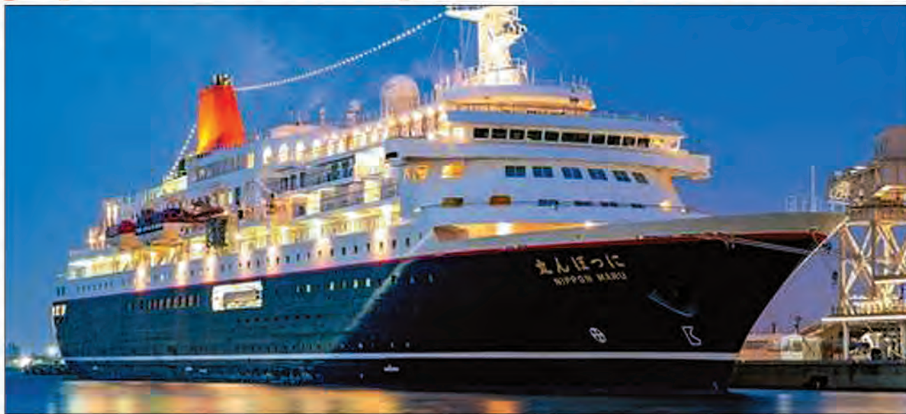
C'est le paquebot japonais Nippon Maru qui va faire escale au port de Toamasina.

de cette capitale économique de la Grande île. « En débarquant à terre, les passagers de Nippon Maru auront déjà l'occasion d'acheter, en guise de cadeaux souvenirs de Madagascar, les différents produits artisanaux fabriqués par la population Betsimisaraka. En effet, des stands servant à présenter des « arts malagasy » seront érigés à quai. Ils pourront en même temps s'en procurer au moment de leur visite au « Bazary Be » tout en découvrant les produits fait-main des artisans locaux », a-t-elle poursuivi. Outre le tour