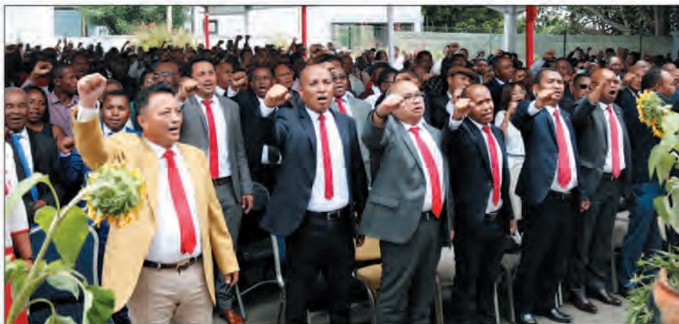
Marc Ravalomanana, leader du RMDM, appelle ses partisans à l'unité et à la solidarité pour redresser le pays.