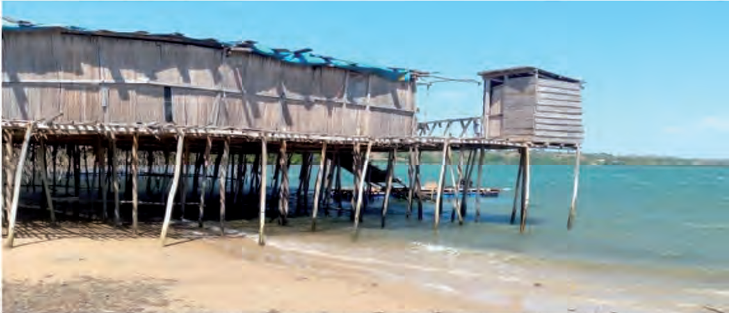
Trano eva natsangan'ireo mpamboly lomotra izay manary maloto anaty ranomasina

Tandidomindoza ny helidrano Mer d'Emeraude, ao amin'ny kaomina Andranovondronina, ao DIANA. Faritra mahasarika mpizaha tany, kanefa dia amin'ny hekitara maro ny fambolena lomotra mena nanomboka ny taona 2018 ary miteraka fahasimban'izany faritra izany.