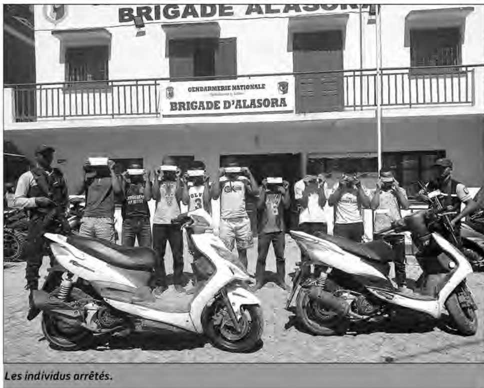
Les individus arrêtés.