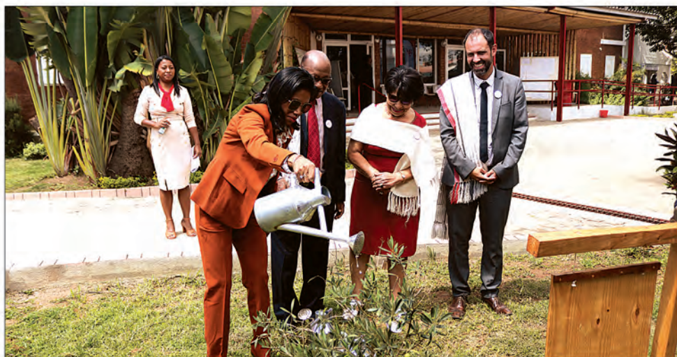
La ministre de la Culture et de la Communication et le staff de l'AFT ont clôturé le 75e anniversaire de l'AFT par la plantation d'un olivier et par l'inauguration d'un nouveau bâtiment comprenant neuf salles de classe, samedi dernier à Andavamamba.