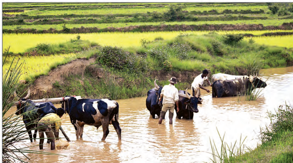
Les zébus ont mérité un bon bain après un dur travail.