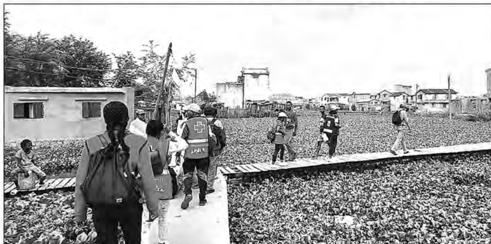
Descente au niveau des fokontany pour l'identification des ménages vulnérables.

et catastrophes (BNGRC) avec la CUA ont prévu de mettre en place quatre sites pour les accueillir. Il s'agit de l'ANS Ampeloha pour les sinistrés issus des fokontany Andavamamba Anjezika I et Antetezanafovoany I; le Gymnase Mahamasina pour les fokontany Mandrangombato I; Anosibe Ouest II et Ambanin'Ampamarinana; Tanimainty pour le fokontany Ankasina et le centre SEBA pour le fokontany IIIIG Hangar. Des améliorations seront également apportées au niveau de l'accueil des sinistrés abrités dans les tentes. Ils