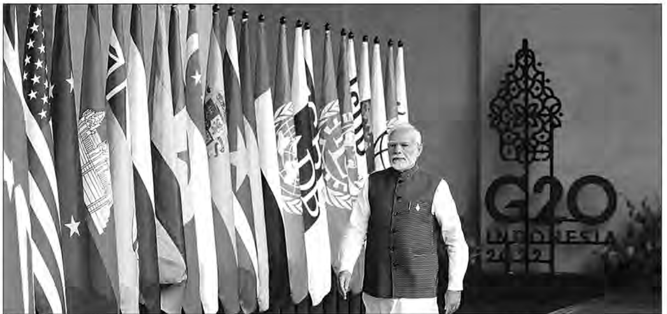
Le Premier ministre indien, Narendra Modi, est prêt à porter la voix des pays du Sud au Sommet des plus grandes puissances mondiales, prévu se tenir en septembre de cette année à New Delhi.

Actuellement à la présidence du G20 ou le Groupe des vingt, l'Inde veut offrir aux pays qui ne font pas partie du processus du G20, l'opportunité de partager leurs idées et leurs attentes vis-à-vis de ce forum intergouvernemental annuel. En rappel, le Groupe des vingt (G20) comprend les pays du G8 (Allemagne, Canada, États-Unis, France,