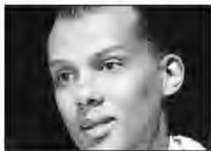
Pour les Victoires, Stromae devance OrelSan, avec trois nominations, et une autre Belge, Angèle, avec trois nominations également.

L'artiste belge est notamment nommé pour le meilleur album de l'année et pour la meilleure chanson au côté d'OrelSan et d'Angèle.