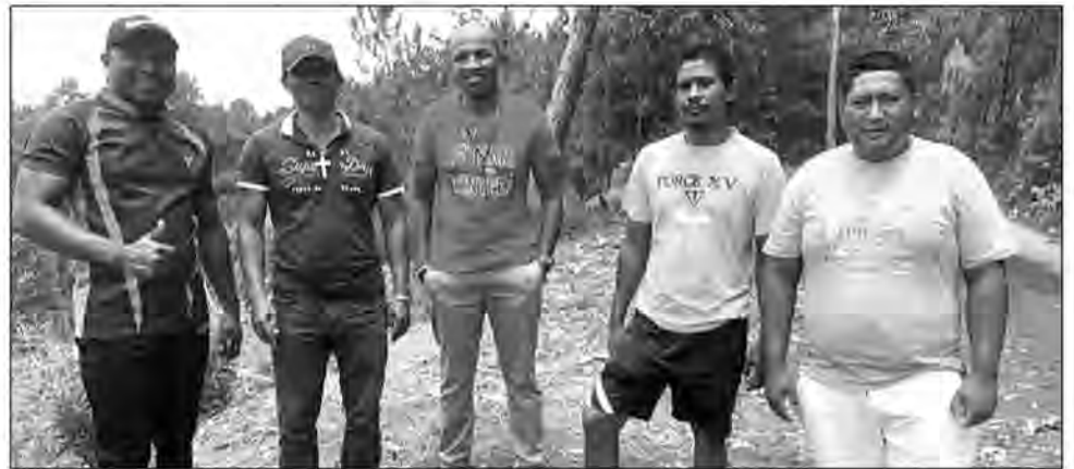
Les présidents des ligues insistent sur l'organisation d'une AG Extraordinaire.