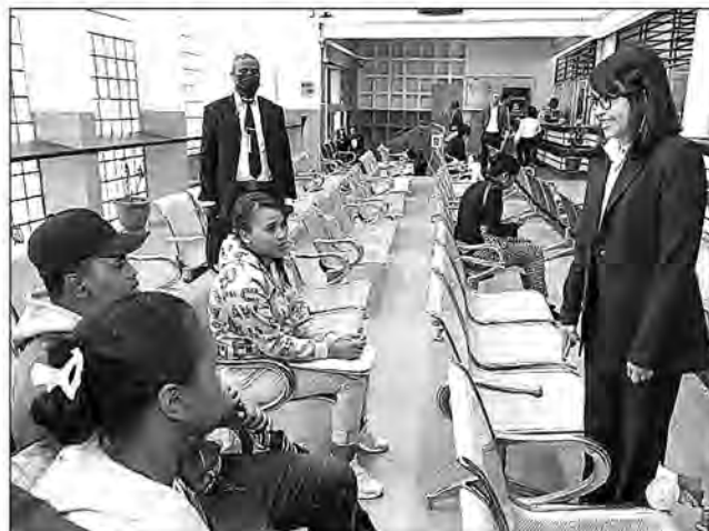
Descente inopinée de la ministre de l'Economie et des Finances, hier à la Paierie Générale d'Antananarivo.