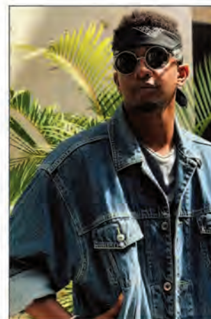
Le mélange à lui tout seul.

Par ailleurs, cette créolisation linguistique ne se fait pas uniquement à Madagascar, les pays ex-colonies française, anglaise, portugaise, espagnole, mélangent les langues. En réalité, c'est le langage des citadins. La mondialisation a permis aussi de faire circuler l'art oratoire urbain. La fluidité de la communication et des diffusions par le biais des réseaux sociaux promeuvent ce courant culturel, envahit les pays africains. Madagascar, bien qu'elle soit une île située à 400 km du continent noir, est receptrice de la culture urbaine venant des pays riverains de l'Océan Indien et même en Afrique de l'Ouest. Les années passent, l'art progresse avec le temps, le langage aussi. « Ils prononcent