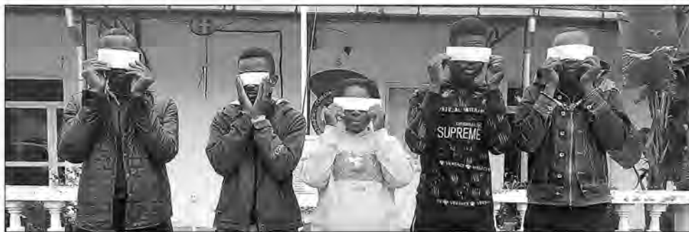
Izy dimy mianadahy, tompon'antoka tamin'ilay fanafihana nahafaty olona tetsy Behoririka ny faran'ny taona teo.