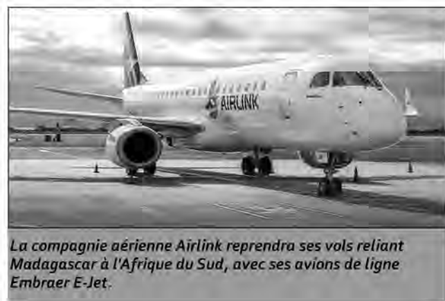
La compagnie aérienne Airlink reprendra ses vols reliant Madagascar à l'Afrique du Sud, avec ses avions de ligne Embraer E-Jet.