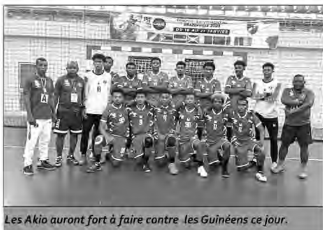
Les Akio auront fort à faire contre les Guinéens ce jour.