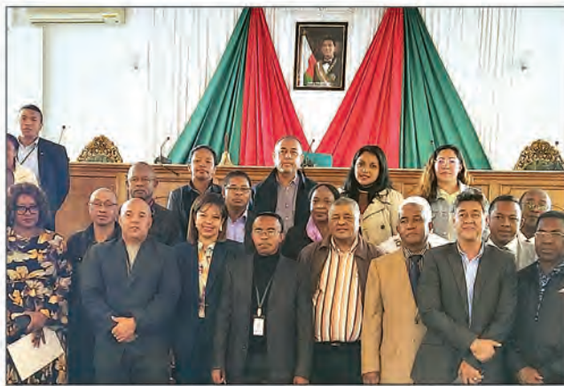
Ce sont les acteurs engagés pour la réussite de ce projet de reforestation du Sénat.

Reverdissement de la nation. Cette année, le Sénat prévoit de mettre en terre 64 000