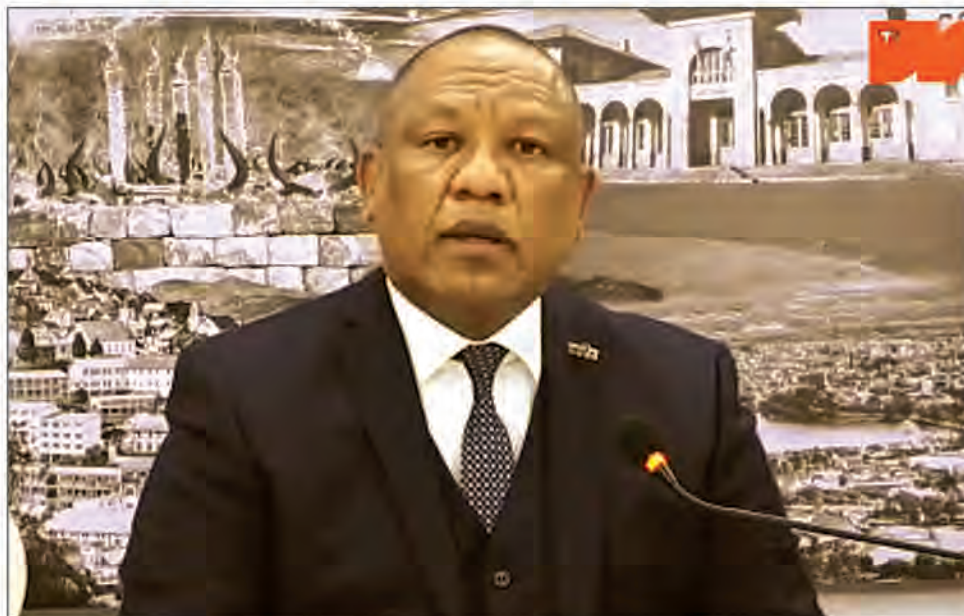
Le PM Christian Ntsay va sortir de son silence ce soir.

presque en même temps voire ensemble, laisse libre cours à toutes les spéculations et supputations dans le microcosme et au sein des états-majors politiques. Qui plus est, l'actuel Premier ministre sera ce soir l'invité d'une émission spéciale sur TVM. L'occasion pour Christian Ntsay de sortir de son silence après la motion de censure avortée qui a sapé les rapports entre le gouvernement et l'Assemblée nationale, mais aussi face aux bruits de remaniement qui se font de plus en plus insistants, même s'"il n'en est pas encore question jusqu'ici". Du moins jusqu'à lundi dernier, le jour où on l'a appris en haut lieu. Les choses ont peut-être évolué ou pas, en l'espace de quatre jours. A l'image du cyclone Cheneso qui pourrait se dissoudre ce jour. Reste à savoir si ce sera également le sort du gouvernement dont les rumeurs de dissolution ou de démission collective ont fortement circulé la semaine passée. Le Premier ministre Christian Ntsay - en place depuis 2018 - en touchera peut-être "maux" ce soir. Il n'est pas exclu qu'il dresse le bilan des actions du gouver-