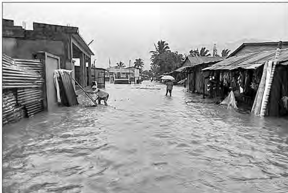
L'eau est montée dans la majeure partie des fokontany du district de Sambava.