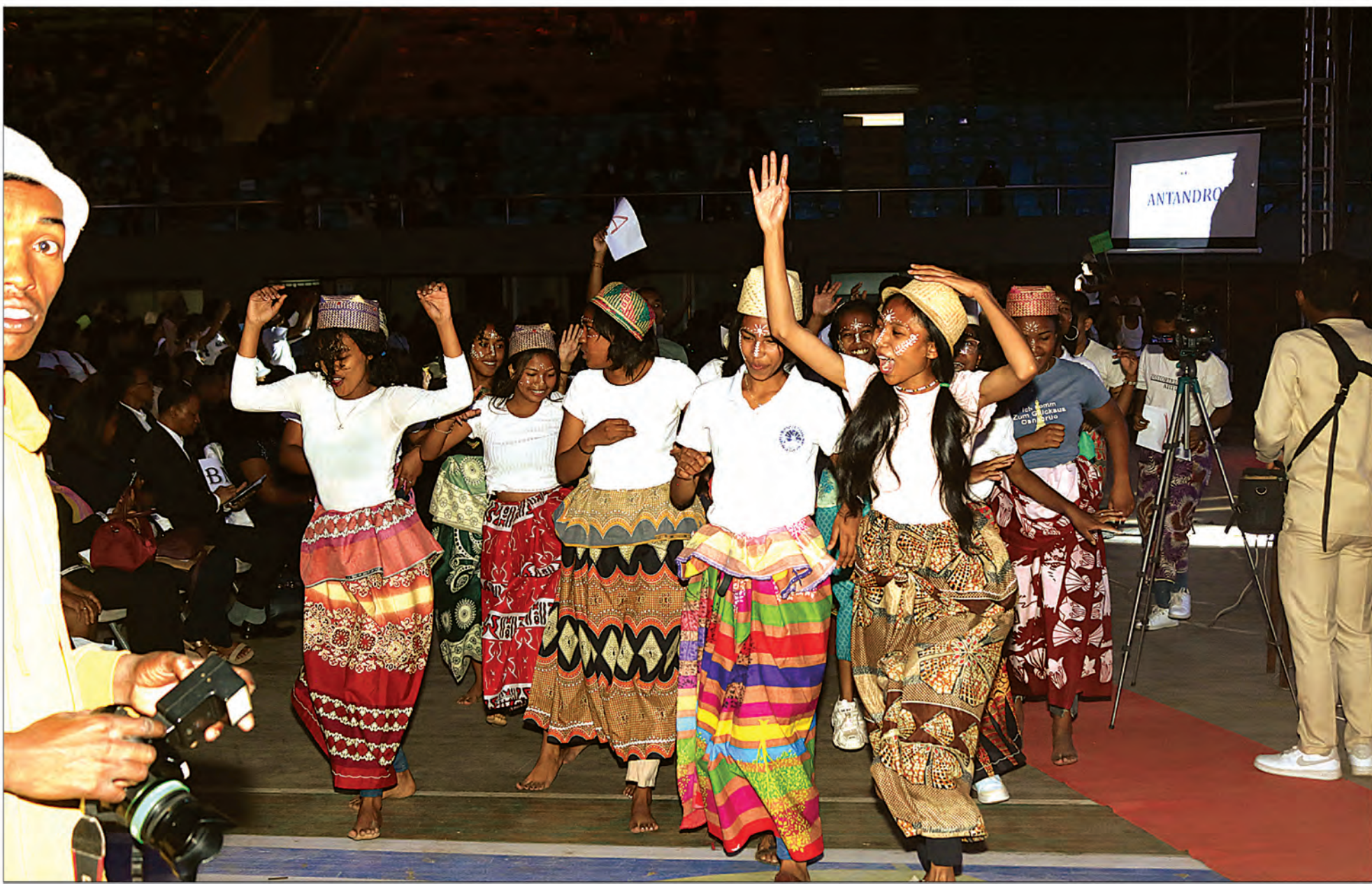
La cérémonie officielle du début de l'année scolaire 2023 de l'université FJKM a commencé hier au Palais des Sports de Mahamasina. En plus du culte, plusieurs manifestations ont été organisées.