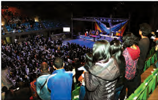
Etudiants et professeurs de l'Université sont venus nombreux pour l'occasion.