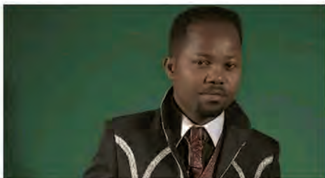
Il a révolutionné la mozika mafana.