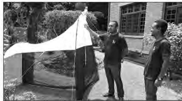
Les chercheurs malgaches présentent à la presse le "piège Malaise" qui capture les insectes.