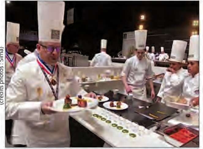
Les membres du jury de l'International Catering Cup prenant la trilogie de porc concoctée par l'équipe malgache, les deux chefs à l'extrême droite.

WSUP | Water & Sanitation for the Urban Poor