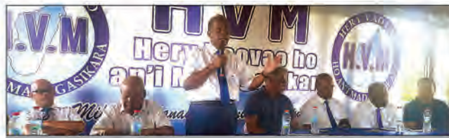
Le HVM dans la région de Fitovinany au mois de décembre dernier.

Si les trois premières semaines de ce mois de janvier ont été marquées par les différents déplacements du leader du parti Tiako i Madagasikara (TIM) et de celui du Malagasy Miara-Miainga (MMM), le parti de l'ancien président Hery Rajaonarimampianina entrera en lice avec un déplacement dans la Capitale de la région de Vakinankaratra, ce week-end. En effet, les "Manga" donnent rendez-vous à la population d'Antsirabe, ce samedi, pour une conférence-débat autour des affaires nationales à l'Espace Rojo-Tsarasaotra. Le Hery Vaovao ho an'i Madagasikara (HVM) prévoit également dans son agenda, à cette occasion, le recrutement de nouveaux membres qui veulent grossir