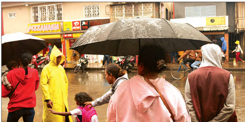
En cette période cyclonique, les dangers sont imminents sur tous les flancs du Rova de Manjakamiadana. En ce temps de chien, les Tananariviens ne se séparent pas de leurs effets personnels pour se protéger du froid et de la pluie.