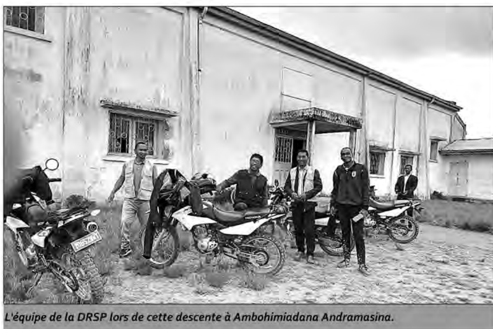
L'équipe de la DRSP lors de cette descente à Ambohimadana Andramasina.