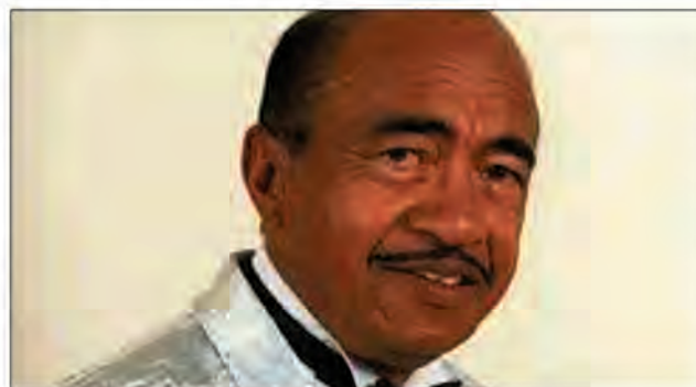
Le lamba blanc, la musique de l'indianocéanité.