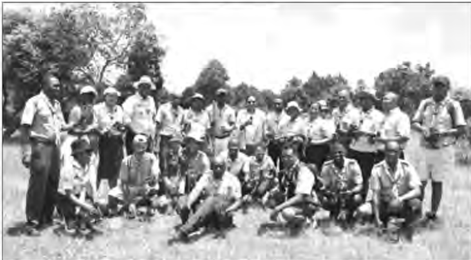
La journée de reboisement organisé par Antil'in'i Madagasikara.