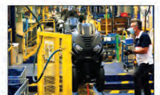
L'allemand Mutares prend le contrôle de Peugeot Motocycles.