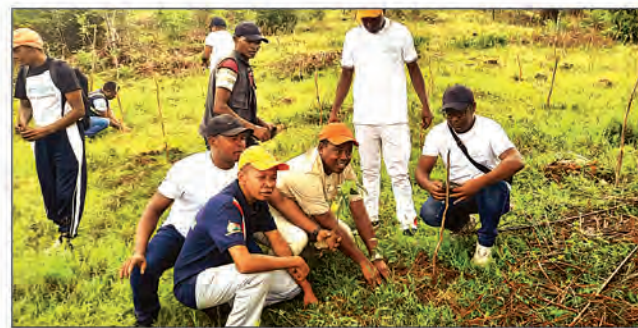
Izay mamboly hazo manome aina, izay mamboly hazo mamelona an'i Madagasikara