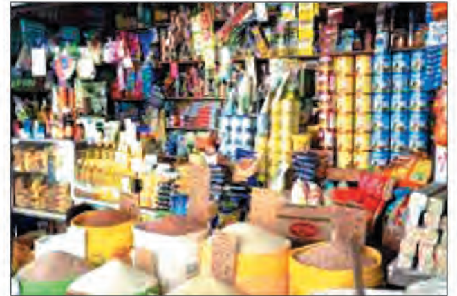
Des sacs de riz destinés aux zones menacées.

Retrouvez chaque MARDI votre cahier économie dans Midi Madagasikara