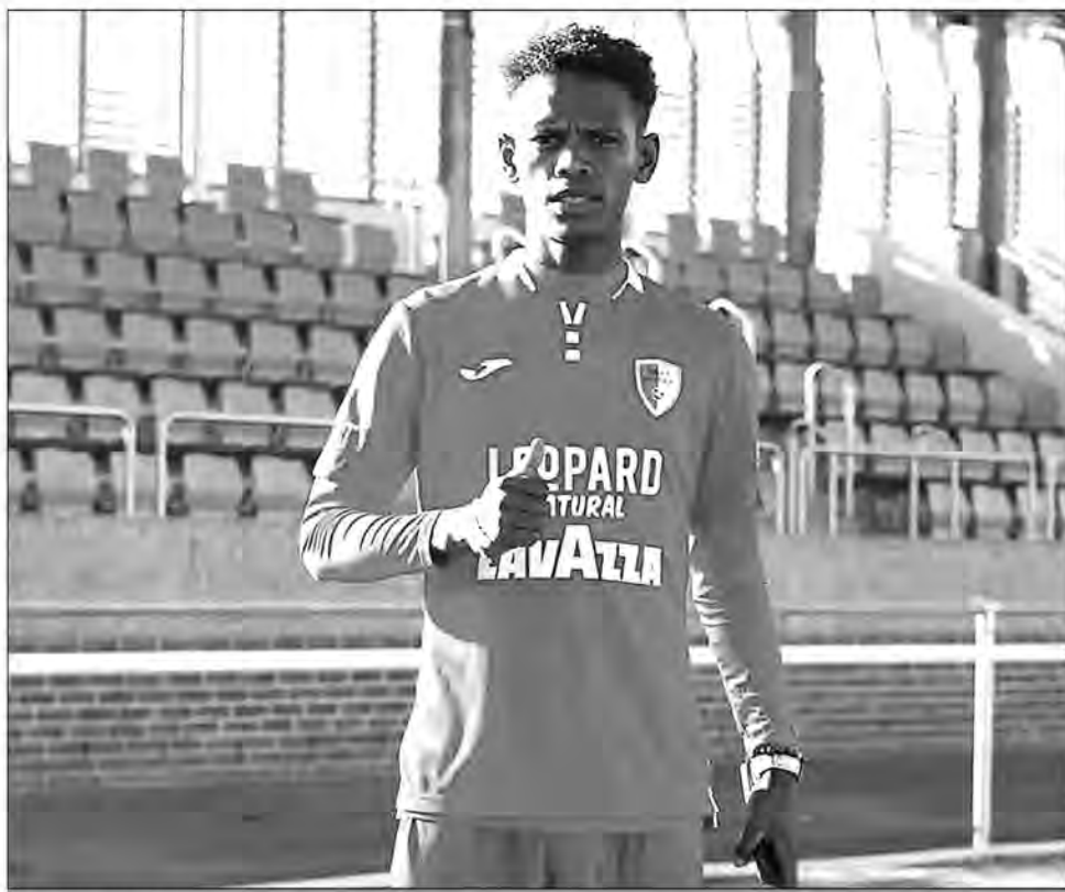
Berajo avec le maillot du Swift Hesperange.

REPUBLIKAN' MADAGASKARA Fitiaivana - Tanindrazana - Fandrosoana