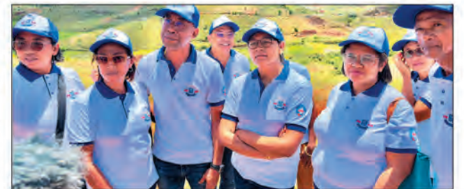
Parmi les dirigeants de l'AMIT.