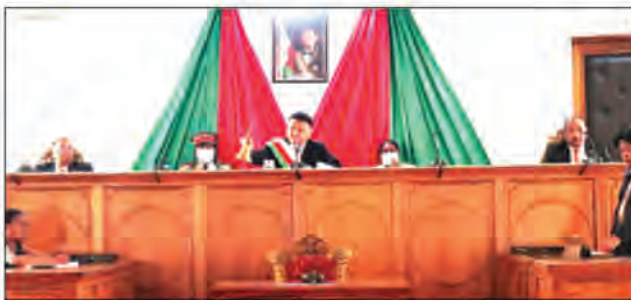
Le perchoir du Sénat pourrait changer de configuration.

Chef d'Etat par intérim. Si le Conseil de gouvernement avise la date du 09 novembre 2023 pour la tenue du premier tour avancée par la Commission Électorale Nationale Indépendante (CENI) et validée par la Haute Cour Constitutionnelle (HCC), le président en exercice devra démissionner 60 jours avant le