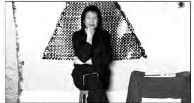
L'exposition inaugurale sera donnée en honneur à Madame Zo et son immense talent.

REPUBLIKAN'I MADAGASIKARA Fitiavana - Tanindrazana - Fandrosoana JIRO SY RANO MALAGASY PERSONNE RESPONSABLE DES MARCHES PUBLICS