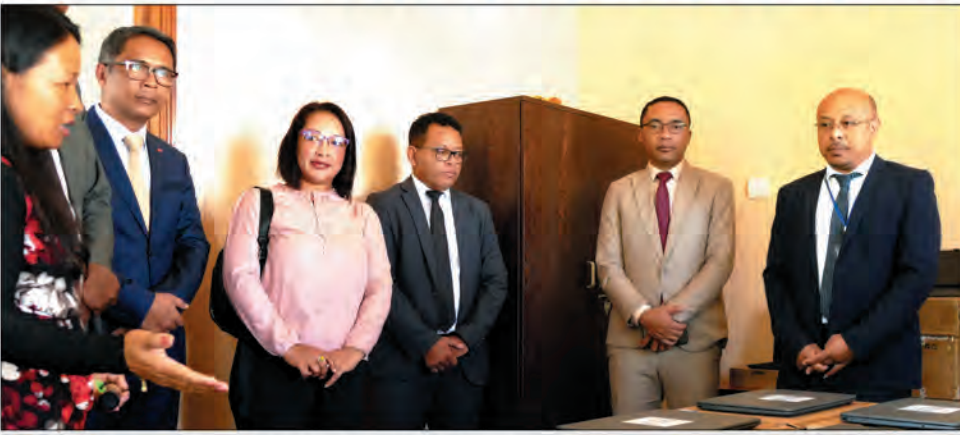
Lors de la remise des matériels informatiques pour les IMF.

Le ministère de l'Economie et des Finances multiplie les actions pour l'inclusion financière. Et ce, à travers le Projet d'Inclusion Financière de Madagascar (PIFM) qui vient de doter des institutions de microfinance de matériels de nouvelles technologies.