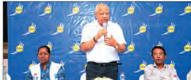
Avant la tenue de son congrès national, le MMM multiplie les descentes sur terrain.