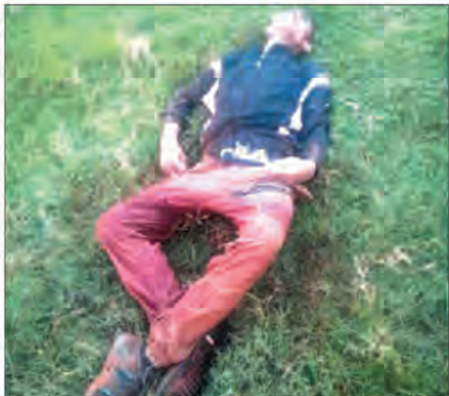
Le corps sans vie de l'homme.