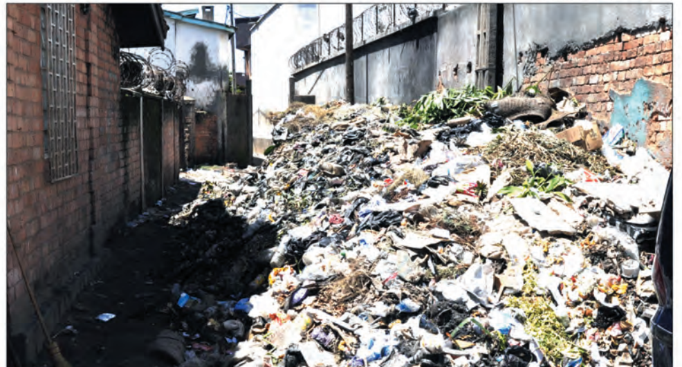
La ruelle qui se situe entre l'entrée de Tana Water Front et le mur derrière l'Ambassade sud-africaine est quasiment obstruée à cause des ordures.