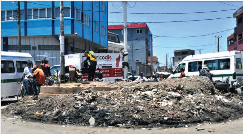
Les travaux de curage effectués à Andravoahangy, en pleine saison de pluie, vont-ils résister aux cascades d'eaux venant des parties hautes de la Capitale ?