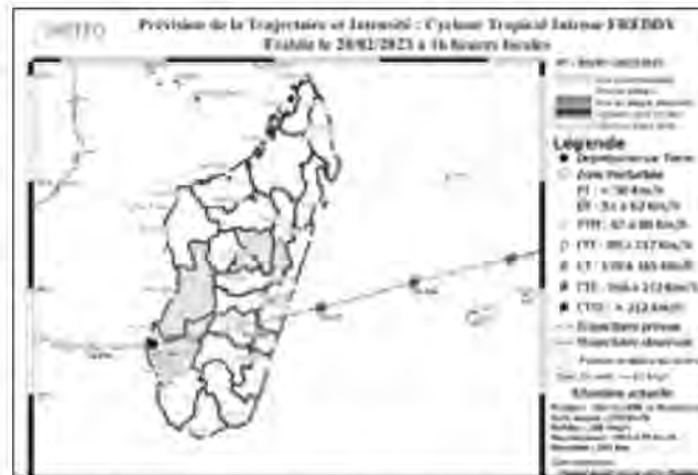
L'impact est prévu ce soir entre Mahanoro et Manakara.