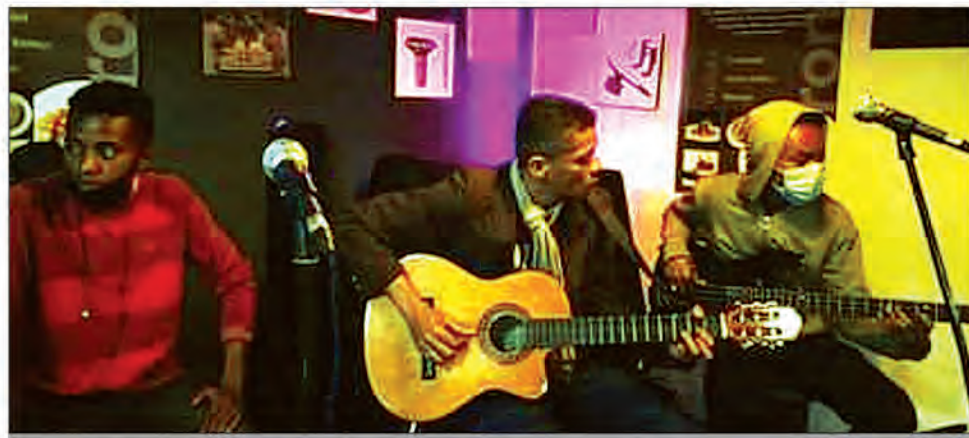
Le groupe est au top de son art.

Le 17 février 2023 est une date inoubliable pour Nanah Gona. Ce collectif malgache a été sélectionné à la compétition musicale "Programma musico mundo" proposée par la chaîne de radio mexicaine "Radio mundo international".