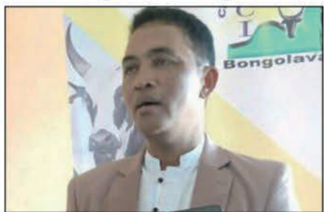
Vonona hitondra ny traikafany ny Filohan'ny Antenimieran'ny varotra any Bongolava.

Vokatra fanondrana nahafantaran'ny firenena eoropeana sy ny japoney an'i Madagasikara ny "baie rose", avy any amin'ny faritra Bongolava iny. Anka-dinondry, Mahasolo, Fierenana sy Tsiroanomandidy no tena mamokatra azy. Betsaka ny azo ampiasana ny "baie rose". Ny an'ny Frantsay hanaovana ranomanitra. Ny japoney mampiasa azy amin'ny sakafo. Ataon'ny firenena tatsinanana savony ihany koa, azo anaovana Rhum arrangé, sns. Isan'ny mpanondrana azy ny firenena brezilianina, kanefa resintsika eo amin'ny kalitao. Nisedra olona anefa ity seha-pihariana "baie rose" ity ka efa nanomboka niha-maty. Nisy fotoana, efa natao kitay sy