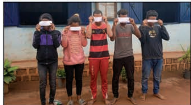
Ireo olona voasambotra.

Tra-tehaky ny zandary ny olona dimy ao anatin'ny tambajotran-jiolahy nangalatra « coffre fort » tao amin'ny mpampiasa azy. Taorian'ny fahaverezana dia nandeha nankany amin'ny biraon'ny zandary nametraka fitoriana ilay lasibatra. Nandray ny andraikiny avy hatrany ireo mpitandro filaminana nanao famotorana sy nikaroka ny olon-dratsy. Rehefa nandeha ny fanadihadiana dia fantatra fa mpiasa tao ihany no nangalatra niaraka tamin'ireo mpiray tsikombakomba taminy. Olona iray no tratra tany Antananarivokely, any amin'ny kaominina Antsapandrano, distrikan'Ambatolampy, tamin'ny 27 janoary lasa, teo niaraka tamin'ny sakaizany izay tena atidoha nikotrika izany asa ratsy izany. Nitohy hatrany ny fikarohana ka tratra ihany koa ireo mpiray tsikombakomba tamin'izy ireo, nisy voasambotra tany Ivato centre, any amin'ny distrikan'Ambositra, ary ny sasany kosa tra-tehaka teny Andavamamba. Efa nentina nankany amin'ny biraon'ny zandary nalaina am-bavany izy rehetra ireo ka nandritra ny famotorana dia voalaza fa nialky ny heloka vitany, samy nahazo tamin'ilay vola halatra sy nandany izany. Fantatra fa vola mitentina 13 tapitrisa ariary sy finday enina ary antontan-taratasy maro samihafa no very, ka vola 800 000 ariary sisa no tsy lanin-dry zalahy tamin'izany, ary efa naverina any amin'ny tompony niaraka tamin'ny antontan-taratasy rehetra.