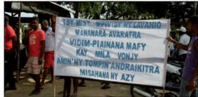
Toy izao ny hetsika nisy tany Mananara Avaratra omaly.