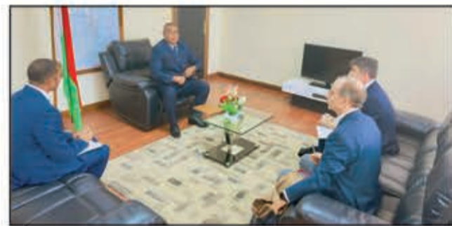
Ny ministry ny Asa Vaventy sy ireo iraka manokana nihaona taminy.