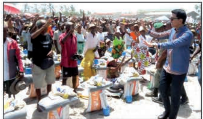
Ny Filoha Andry Rajoelina nanolotra fanampiana ho an'ireo traboina tao Nosy Varika.