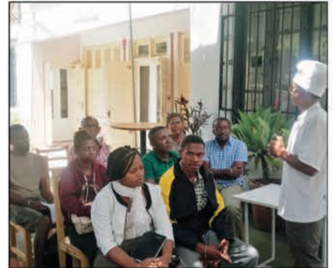
Liana amin'ny fanodinana ny "Cacao" ireo mpamboly.