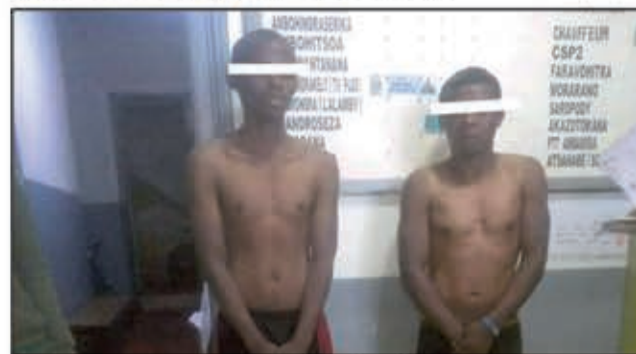
Entana maro no tratra teny amin-dry zalahy ireto.

Tovolahy roa namaky trano no saika niharan'ny fitsaram-bahoaka omaly vao maraina tokony ho tamin'ny 5 ora sy sasany teny Ambolokandrina Ravitoto. Mbola tra-tehaky ny olona teny amin-dry zalahy ireo rahateo ny entana nangalariny izay nataony tao anaty gony toy ny kojakoja fampiasa ao an-dakozia ka vilany no maro an'isa tamin'izany. Tsy afanitsoaka intsony izy roa lahy tamin'io fotona io fa voasambotry ny fokonolona. Tezitra ireto farany satria araka ny fantatra dia tokantrano maro no efa lasibat'io asa ratsy io teny an-toerana ka saika nanamparan'ny olona ny hatezerany ireto tratra ireto. Efa saika niharan'ny vono sy daroka mihitsy ry zalahy no tonga teny an-toerana ny polisy avy ao amin'ny kaomisarian'ny boriborintany faharoa eny Ambohitato. Soa fa tonga ara-potoana ireo mpitandro filaminana satria vantany vao nahazo ny antso izy ireo dia nidina ifotony teny an-toerana. Voasoroka araka izany ilay fitsaram-bahoaka nokasain'ny fokonolona natao saika naharatra ary mety nitarika fahafatesana ho azy roa lahy. Nosamborina izy ireto ary nentina nankany amin'ny biraon'ny polisy taorian'izay. Natao avy hatrany ny famotorana. Fantatra fa olona mipetraka eny By Pass sy Anosibe izy roa lahy izao tratra nanao asa ratsy teny Ambolokandrina izao.