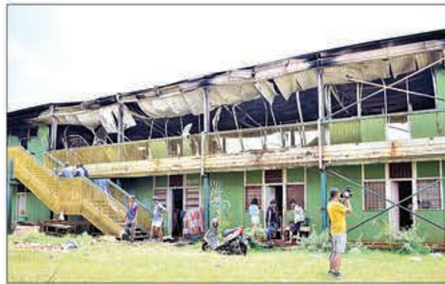
Nikorapaka ireo mpianatra izay anatin'ny filalan-tsasatra raha vao naheno ny voina.

Omaly tokony ho tamin'ny 5 ora maraina, may ny "bloc 15" ao amin'ny tranon'ny mpianatra eny Vontovorona. Ny rihana ambony misy efitra 8 no voakasik'izany fahamaizana tanteraka izany. Tsy nisy azo noraisina ny entana rehetra tao anatin'ny raha nanam-potoana nanavotra ny kojakoja sy entana ny tao ambony rihana. Mpianatra 50 no traboina noho izany hain-trano izany. Araka ny tombana nataon'ny "électriciens" eo anivon'ny CROU-A, "court-circuit" no nitarika ny hain-trano. Niditra an-tsehatra tamin'ny famonoana izany afo izany ny sampana mpamonjy voina ka nahafehezana ny afo.