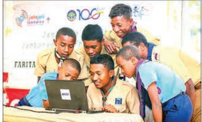
Nisy ny lesoka teo amin'ny fanabeazana noho ny Covid-19 saingy tsy mitaraintana-miepaka hanarina izany.