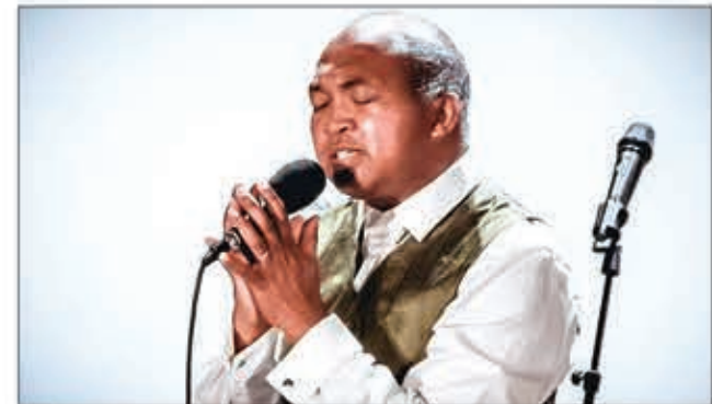
Fy Alefa mivantana ao anatin'ny pejy fesiboik'ny tarika ny fampisehoana.

"Hira fiderana sy filazan-tsara" no lohahevitra entin'ny Tarika Vonjy manamarika ny fampisehoana maimaimpoana izay hataony. Ny Asabotsy 7 Janoary izao ety amin'ny Ccesca manomboka amin'ny 2 ora sy sasany no hanomezany fotoana ny rehetra ary mandritra izany no hifampiarahabana noho ny taona voavao. Araka ny fanazavana anefa dia tapitra tanteraka ny taratasy fanasana ahafahana miditra tetsy amin'ny Tsena Zina Analakely. Nanome toky ny mpankafy rehetra izay tsy nahazo fanasana anefa ny zareo fa alefa mivantana ao anatin'ny pejy fesiboik'ny tarika ny fampisehoana an-tsehatra. Marihana fa ny taona 1996 no nasian'ny tarika Vonjy. Tamin'izay fotoana izay ihany koa no namoahan'izy ireo ny rakikirany voalohany mitondra ny lohateny hoe " Tsy miova Jesosy". 18 Mianadaha no nandrafitra ny tarika tamin'izany fotoana izany ary mbola ao avokoa fa iray ihany no nindaosin'ny fahafatesana. 5 ny isan'ny mpitendry, 9 mianadaha mpihira ary mpandihy 4 mirahavavy no nandrafitra ny Tarika. Vonjy avokoa no mamorona ny hira rehetra fa ny fandrafetana azy kosa no iarahan'ny rehetra. Hatramin'ny 1996 dia 6 no isan'ny rakikiran'izy ireo dia " tarigetra tsara ny mihira", hoe " nandondona", " loharanompifaliana" ary ilay "Aba Ray" nivoaka tamin'ny 2017. Anisan'ny hira tena nahafatanrana azy ireo ilay hoe "Aba Ray", "fiarovana ho ahy", "Tsara ny Mihira".