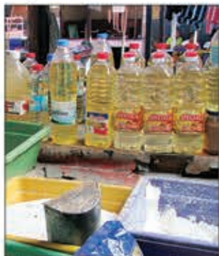
Raha mbola ho mafy noho ny tamin'ny lasa ity taona ity dia hanao ahoana indray izany ny ho fiakaran'ny vidim-piainana? (sary tahiry)

Anisan'ireo heverina ho antony ahazoana manazava izany ny ady ao Ukraine, ny sondro-bidim-piainana, ary ny fiakaran'ny tahan'ny zanabola.