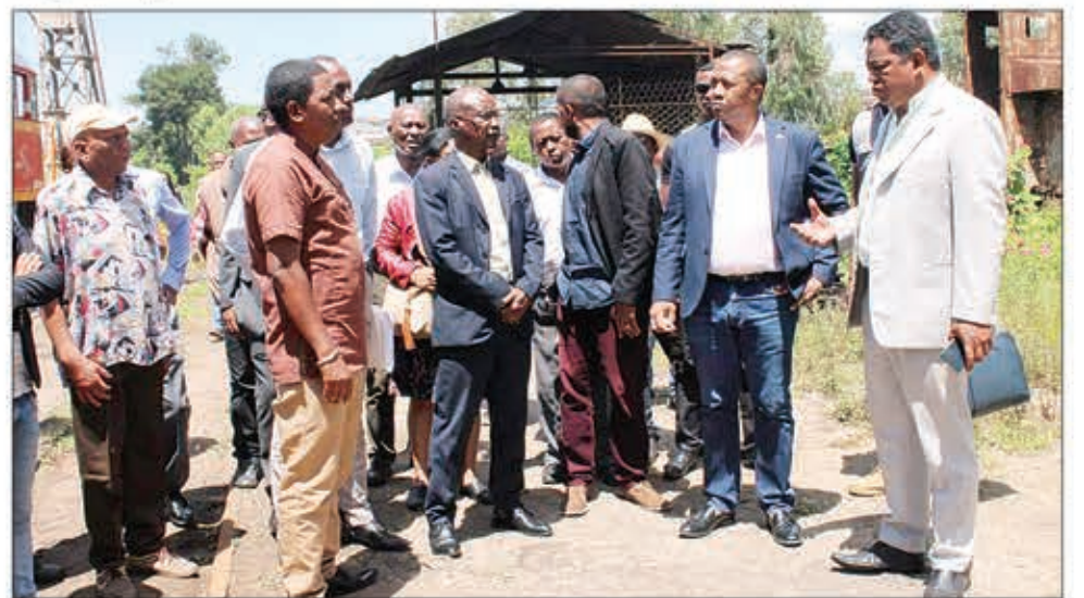
Ny minisitry ny Fitaterana niaraka tamin'ireo tomponandraikitra isan-tsokajiny namaha ny olan'ny FCE.