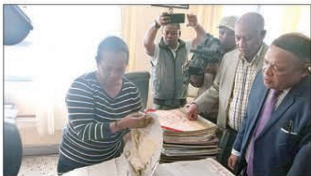
Notsirihin'ny minisitra tsirairay ireo biraon'ny fananan-tany teny Anosy.