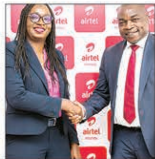
Hampiroborobo ny tolotra ara-bola ho an'ny rehetra ny Baobab sy Airtel.

Mampivondrona mpampiasa an-tapitrisany manerana ny faritra sy izao tontolo izao amin'ny alalan'ny "Airtel Money" ny Orinasan-teraserera Airtel. Amin'izao fotoana izao dia misokatra indray ny fiaraha-miasany amin'ny Banky Baobab. Omaly alakamisy tetsy amin'ny foiben'ny Airtel Madagasikara etsy Ivdry ny fampahafantarana izany tamin'ny fomba ofisialy. Ny fiaraha-miasa dia niompiana betsaka tamin'ny fampiroboroboana