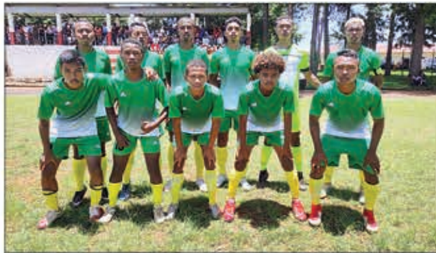
Isan'ireo ekipa sangany sy mila arahana akaiky izy ireto.

Fandresena hatrany no azon'ny ekipa voafantina avy amin'ny ligin'i Vakinankaratra, nandritra ny dingana voalohany, tamin'ny fiadiana ny amboara ho an'ny seleksiona rezonaly, latsaky ny 19 taona, taranja baolina kitra. Resin'izy ireo, tamin'ny isa 2 no ho 0 ny avy any Menabe, teo amin'ny andro voalohany, ho an'ny vondrona Antsirabe, ary mbola niondrika nanaoloana azy, tamin'ny isa 3 no ho 2 ihany koa ny avy eto