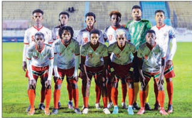
Hiezaka hanarina ny faharesena azony tamin'i Congo Brazzaville anio ny Barea.

Hisy fiovana ny mpilalao hiakatra an-kianja voalohany saingy tsy betsaka izany, hoy ny mpanazatra.