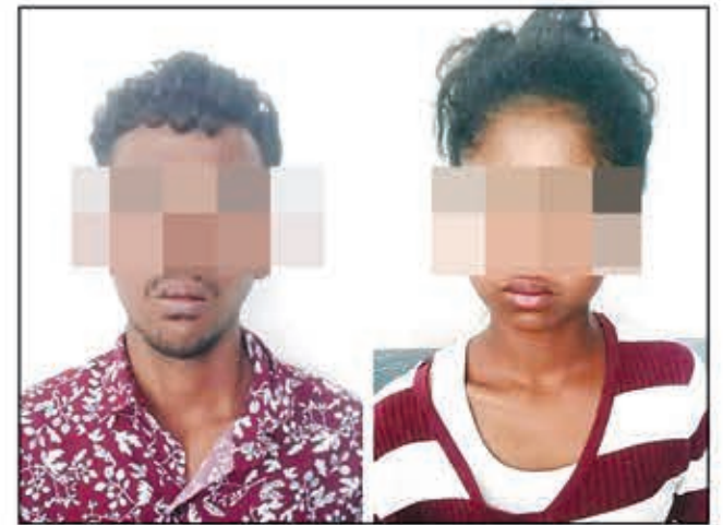
Ireo olona voasambotra.

Olona roa, lehilahy iray 24 taona sy vehivavy 20 taona, no voasambotry ny polisy miasa ao amin'ny kaomisarian'ny boriborintany fahadimy eny Mahamasina ny sabotsy lasa teo tokony ho tamin'ny 1ora tolakandro noho ny resaka halatra. Niditra tao amin'ny trano fivarotana iray izy roa ireto ka mody mividy zavatra ilay vehivavy ary ilay lehilahy kosa manararaotra maka izay zavatra mipetraka eo amin'ny latabatra fivarotana izy. Nisy olona nahatsikaritra teo ampanaovana izany asa ratsy izany izy ireo ka nampilaza tamin'ny polisy miasa tsy lavitra an'io toeram-pivarotana io. Vantany vao naheno izany ny polisy dia mandeha tany antoerana nisambotra ireto olona roa nangalatra ireto. Nisy ny fisavana natao azy roa nandritra izany ka tratra tany am-paositray lehilahy ny finday sy ny vola 40 000Ar nangalariny. Taorian'ny fisamborana dia nentina tany amin'ny biraon'ny polisy izy ireo.