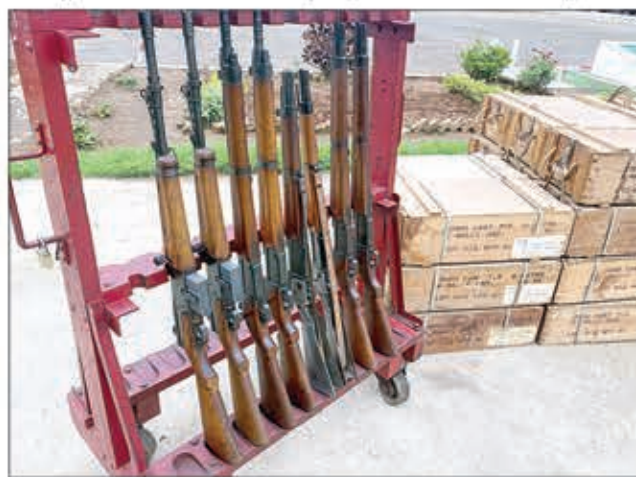
Ireo basy natolotry ny tafika ho an'ny polisily.

Mbola mipetraka ny firahalahina amin'ireo mpitandro ny filaminana. Izany dia maneho fa misy ny firaisankina entina mametraka ny fandriam-pahalemana maharitra. Manaporofy izany ny lanonaa niseho omaly dia ny fanoloran'ny miaramila na ny tafika malagasy fitaovampiadiana ho an'ny polisim-pirenena, teny amin'ny FIP Antanimora. Natao izao hetsika izao mba hoentina manatevina ny fitaovana efa eo am-pelatanan'ny polisily. "Ireo fitaovana ireo dia tsy natao hopotehina, satria volam-bahoaka, sady mbola misy ny ilana azy ho fiarovana ny vahoaka sy ny fananany. Fampitaovana ireo polisily izay misandrahaka