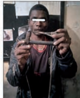
Ilay lehilahy niaraka tamin'ireo fitaovana famakian-trano.

Lehilahy iray 42 taona no tra-tehaka niditra an-keriny tao an-tranon'olona teny Anosipatrana ny alin'ny alarobia hifoha alakamisy lasa teo. Nandritra io alina io dia nanatona tao amin'ny trano iray ralehilahy ary rehefa nijerijery ny manodidina ka tsy nisy nahita izy dia handeha hamaky io trano io. Tsy araka ny noeritreritiny anefa ny zavaviseho, satria tsy nampoziny fa nandritra izany dia nisy olona nahatsikaritra soa aman-tsara teo am-panaovana ny asa ratsiny izy. Avy hatrany dia niantso antelefaonina ny polisy io nahita azy io ka nilaza fa misy lehilahy iray miditra an-keriny amin'ny trano iray eny an-toerana. Raha vao nahare izany ireo mpitandro filaminana dia nidina nijery ny zava-niseho ka tamin'izay indrindra no nahitan'izy ireo an-dralehilahy, tratra ambodiombony nanapitsoka varavarana. Tsy afa-nitsoaka intsony ilay olon-dratsy fa noraisim-potsiny teo. Nosavaina avy hatrany izy ka nandritra izany no nahitana maritao sy hety roa tany aminy. Taorian'ny fisamborana dia nentina tany amin'ny biraon'ny polisy izy. Mitohy ny famotorana.