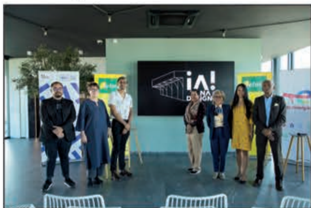
Ireo mpiara-miombona antoka amin'ity hetsika ity.