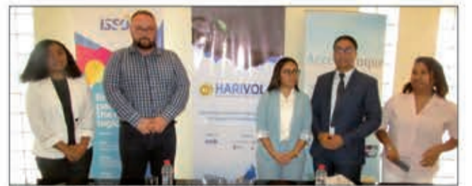
Notanterahina teny Ankadifotsy ny lanonana fanombohana ny Fandaharam-piofanana nasionaly.