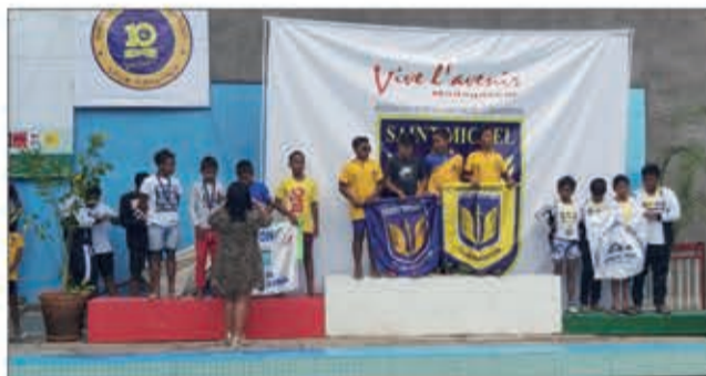
Anisan'ny hetsika efa manana ny toerany eto amin'ny firenena ny "Vive l'Avenir".

Hotanterahina amin'ny faran'ny herinandro izao etsy amin'ny dobo filomanosan'ny ANS Ampefiloha ny andiany faha-11 amin'ny fifaninanana "Vive l'avenir", taranja lomano. Manodidina ny 230 ny isan'ny mpanoratra anjara andrasana amin'ity, raha ny namberan'ny klioban'ny St Michel mpikarakara. Hampiavaka ity andiany ity, ny fanatantehana ny lalao famaranana manomboka amin'ny 7 ora hariva. Efa vonona amin'izany izy ireo. Misokatra ho an'ny klioba rehetra ny fifaninanana, manomboka amin'ny sokajy "avenir" ka hatramin'ny "seniors". Toy ny fanaony tamin'ny andiany teo aloha, ankoatra ny medaly hatolotra ny mpanoratra, hahazo amboara ihany koa ny mpilomano mendrika indrindra ho an'ny latsaky ny 13 taona midina (avenir, poussine, benjamines) sy ny mihoatra ny 14 taona (minime, cadet, junior, senior), izay nandrombaka