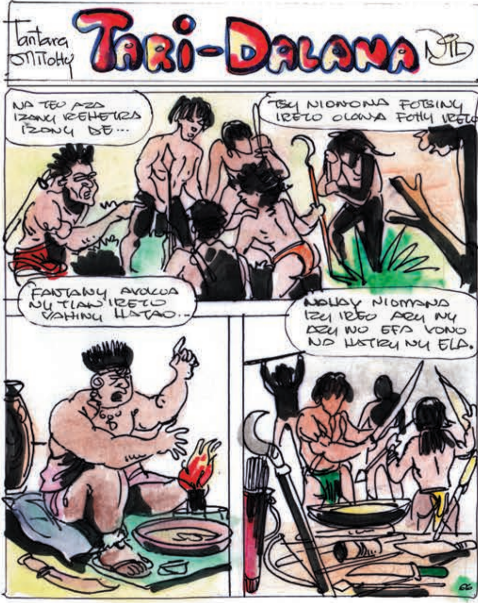
Tantara sy sary: Nil