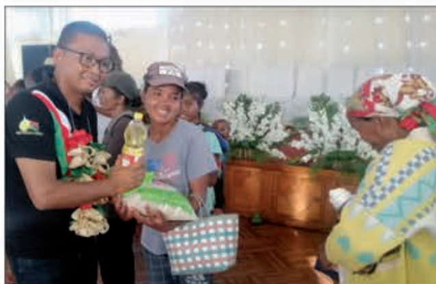
Tonga maro nanararaotra ny fisian'ny fitiliana maimaimpoana ireo vehivavy.

Vokatry ny fiaraha-miasan'ny fikambanana Destiny amin'ny orinasa tsy miankina eny Ivato, vehivavy sahirana an-jatony no ho afaka hisitraka asa fivelomana. Iarahan'ny rehetra mahita tokoa fa sarotra ny fiainana ary amin'ny alalan'ny asa ihany no hahafahana mitondra fampandrosoana ny ao an-tokantrano sy ny firenena. Nandritra ny andron'ny vehivavy dia nizara fanampiana ho an'ireo renim-pianakaviana sahirana 400 eo anivon'ny kaominina Ivato ny fikambanana Destiny tarihin'i Hoby Randrianarisoa,