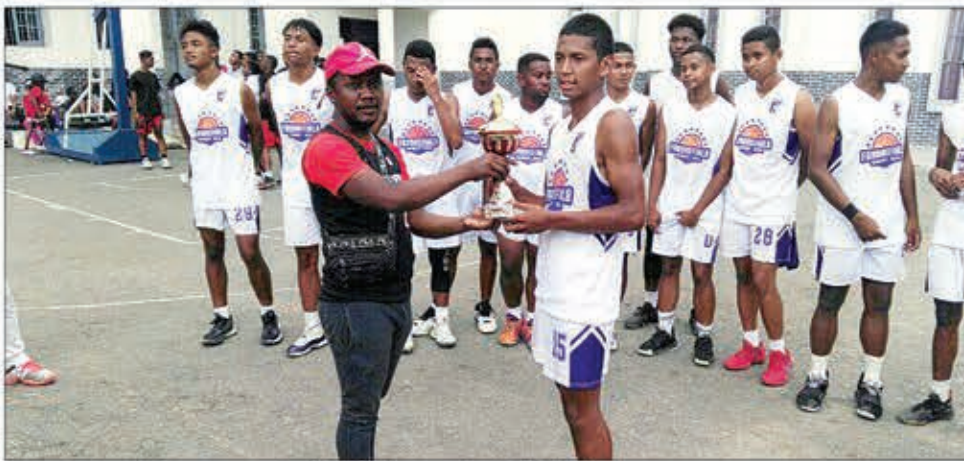
Mamokatra ekipa maro ny Section Antananarivo Renivohitra !

Hosantarina amin'ny fomba manetriketrika eny amin'ny kianja mitafon'i Mahamasina amin'ny sabotsy 14 janoary 2023 ho avy izao, ny taom-pilalaoavana 2023 amin'ny basket-ball, karakarain'ny Section Antananarivo Renivohitra. Ekipa 48, hiatrika ny fifaninanana ampanaovin'ny Section Antananarivo Renivohitra, no handray anjara amin'ny filaharana "carnaval" lehibe, entina manamarika ny fisokafan'izany taom-pilalaoavana izany. Ankoatra ny ambin'ny lalao famaranana