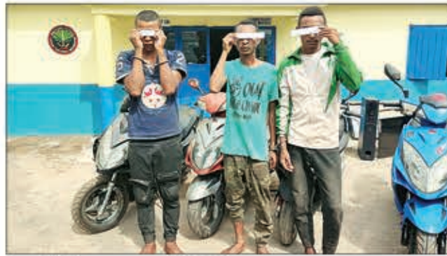
Ireo jiolahy namono nahafaty Sinoa.

Mbola maro ireo karohina ary araka ny fanamarinam-baovao hatrany dia misy mpianakavy ireto voasaringotra noho ny firaisana tsikombakomba tamin'ireo mpanao ratsy tamin'ity raharaha ity.