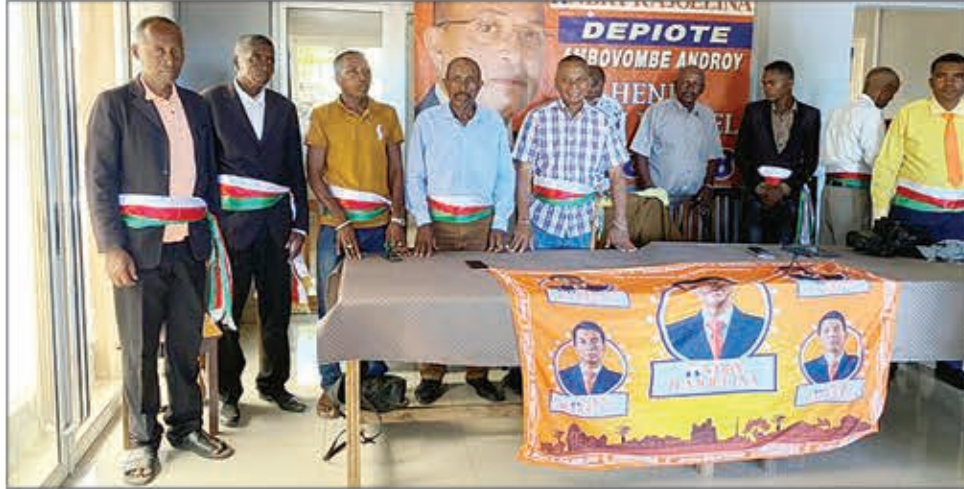
Ireo ben'ny tanàna maromaro ao amin'ny distrikan'Ambovombe Androy nanao fanambarana.