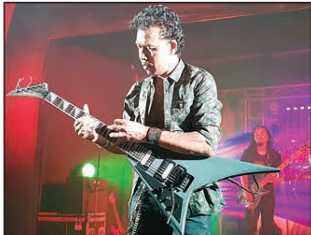
Vonona hitondra vazo mafana ry Dekap's Band.