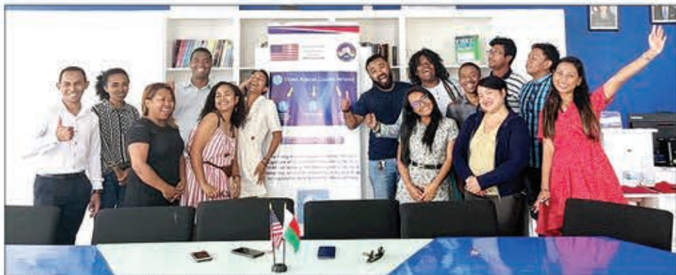
Amin'ny sary eto izy folo mianadahy efa any Afrika Atsimo miatrika ny fifanakalozana.

Tanora mpitarika Malagasy 10 mianadahy indray no voafantina amin'ny andiany faha-20 amin'ny programa "YALI Regional Leadership Center Southern Africa". Ny Alakamisy 9 Martsa lasa teo izy ireo no nihaona teny amin'ny "American Corner" Antananarivo ary nandray ny torolàlana momba ny fiofanana izay hatrehina nanomboka omaly any Pretoria, Afrika Atsimo. Fiofanana haharitra 4 hatramin'ny 12 herinandro ary hiompiana amin'ny asa fitarihana eny anivon'ny fiarahamonina sy fitantanan-draharahampanjakana ary fandraharahana no hataon'izy ireo any. Rehefa tafaverina eto Madagasikara ireto tanora Malagasy ireto dia avy