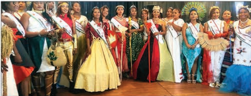
Ireo reny 33 hiatrika ny famaranana. amin'ity taona ity.

Misokatra ho an'ny reny rehetra ary nentina indrindra hanohanana ny vehivavy izay indraindray tsy omena lanja nefa manana ny maha izy azy ny fifaninanana « miss maman ». Nisy 314 ireo nisoratra anarana hanao izany fa ny 33 tamin'izy ireo ihany anefa no voatazona taorian'ny fidiavana nataon'ny olona tao anaty fesiboky sy ny sivana nataon'ny mpitsara. Ireo 33 ireo ihany koa araka izany no nanao ny fifaninanana voalohany tao amin'ny IKM tamin'ny 8 martsa teo ary tsy nisy ny fifanintsanana fa izy rehetra ihany koa no miara-miakatra amin'ny dingana famaranana izay ho tanterahana amin'ny 3 jona izao. Mandritra io famaranana io vao hisy fifanintsanana hatao ka ny 10 amin'izy ireo ihany indray no hiatrika ny dingana farany ka eo vao ho fantatra izay hisalotra ny « miss maman »