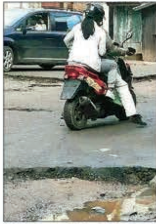
Voatery mandeha miodana ny fiara rehefa mandalo lalan-dratsy ka mitarika fitohanana lavareny izany.

Lasa aiza ny tamberin'andraikitra amin'ny hetra aloan'ny mponina sy ny FER.