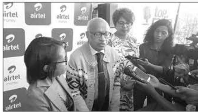
Fety tsy hanam-paharoa no hatolotry ny mpikarakara amin'izao fankalazana ny faha-90 taon'i Henri Ratsimbazafy izao.