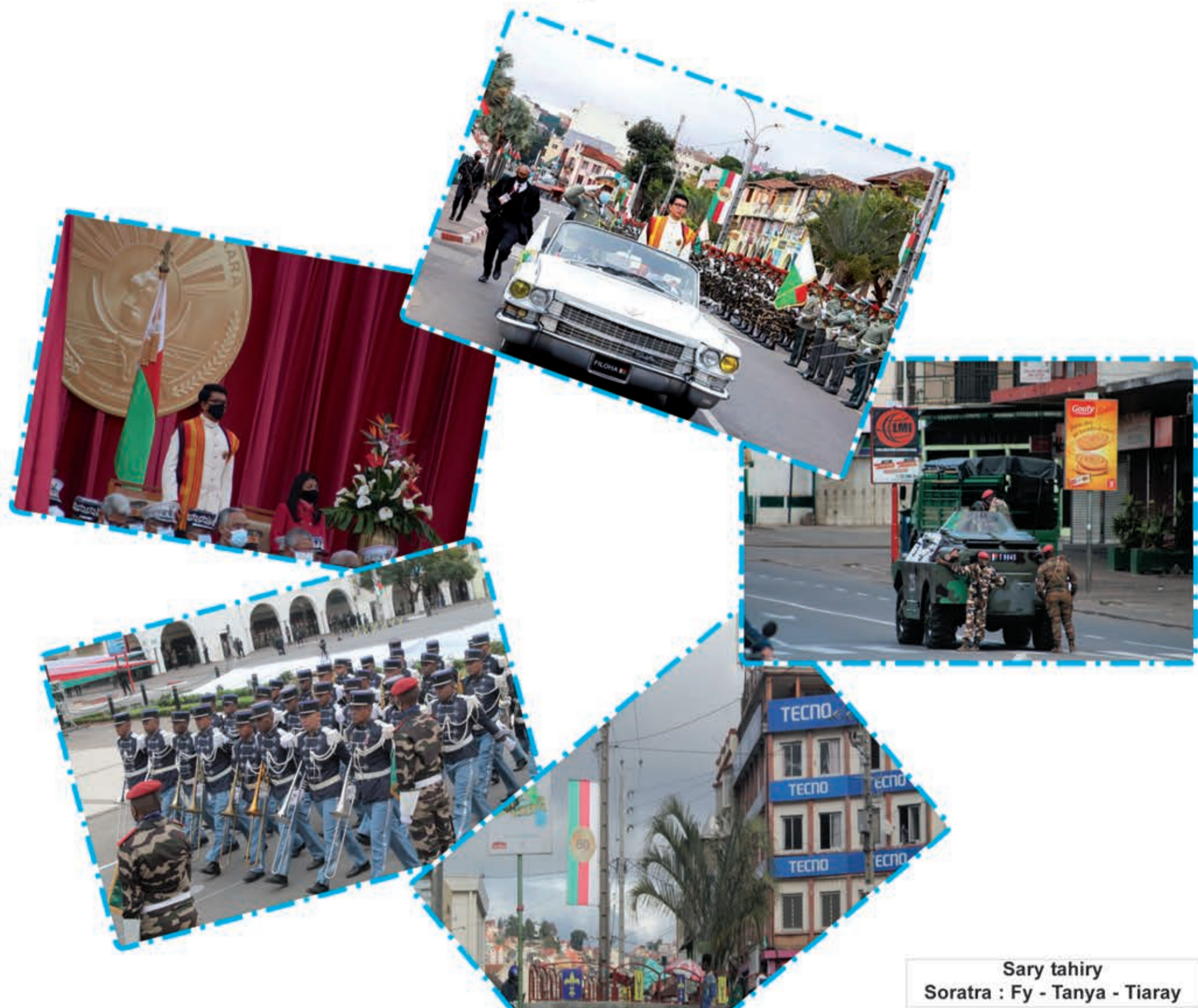
Sary tahiry Soratra : Fy - Tanya - Tiaray

Nangina ny tanàna nandritra ny fankalazana ny faha-60 taonan'ny fahaleovantena ny 26 jona 2020. Ny antony, tao anatin'ny krizin'ny aretina " covid-19 " isika. Nisy ny fihibohana, ka tsy nisy afaka nivezivezy ary noferana ny fivoahan'ny olona ny trano fonenany. Feno barazy avokoa ny ankamaroan'ny lalana. Hentitra ny fiambenana ny toerana nanatanterahana ny matso teo Analakely (Araben'ny Fahaleovantena). Ny filoham-pirenena Andry