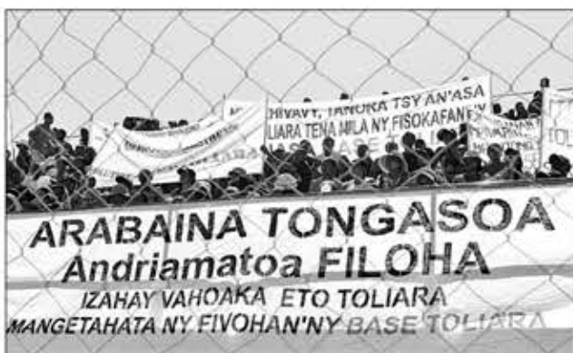
Ireo sora-baventy nataon'ireo vahoakan'i Toliara ho an'ny Filoham-pirenena.