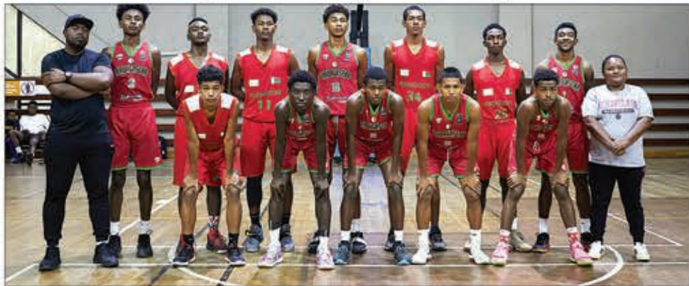
Iaina mihitsy ny fanomanan-tena any ivelany, alohan'ny hiatrehana ny " W.C ".

Tontosa omaly ny antsapaka, nahafantarana ny ekipa hiry vondrona amin'ny fiadiana ny tomondaka erantany amin'ny basket-ball, natokana ho an'ny zatovolaha latsaky ny 19 taona, izay hotanterahina any Debrece (Hongrie) amin'ny sabotsy 24 jiona 2023 ka hatramin'ny alahady 02 jolay 2023. Tafaraka amin'ny ekipam-pirenena'i Liban sy Etazonia (USA) ary Slovenie, ao anatin'ny vondrona B, ny ekipam-pirenentsika ANKOAY, izay tomondaka lefitr'i Afrika 2022 tamin'ny « U18 » natao teto amintsika ary taorian'i Egipte. Ampahatsiahivina fa tomondakan'i Amerika i Etazonia no sady tompon'ny amboara farany tamin'ny " World Cup U19 ". Nitana ny laharana faha-3 tany Azia