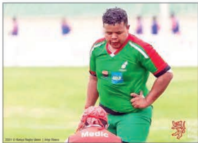
Nanana ny toerany tao anatin'ny klioban'ny Us Ikopa sy ny Ekipam-pirenena i Lanja be.