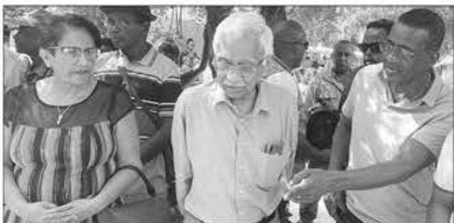
" Raha tsy misy ny hoenti-manana aza milatsaka hofidiana fa mandrebireby vahoaka ", hoy Ing Ratsirahonana tany Toliara.