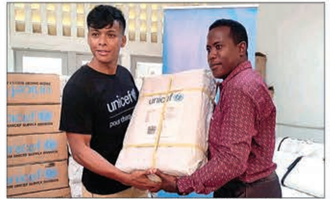
I Mirado, ambasadaoro nasionalin'ny Unicef manolotra ireo trano lay ho an'ny DREN Boeny.