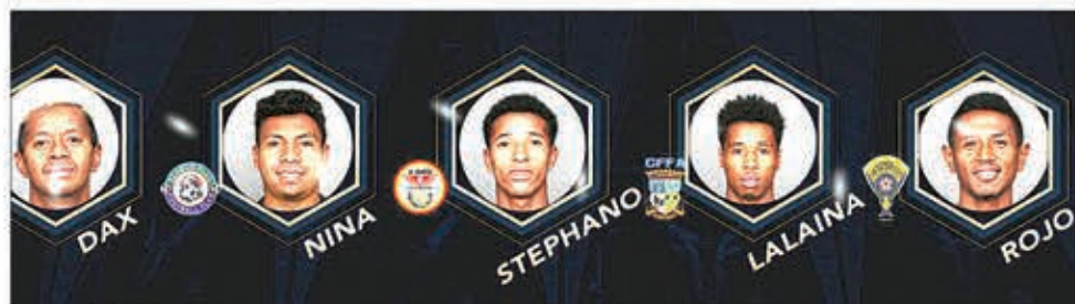
Ireo mpilalao hisafidianana izay mahay sy mendrika amin'ity.

Ho tanterahina eto amintsika ihany koa ny ny fifidianana ny mpilalao mendrika sy mahay, nandritra ny fiadiana ny tompondakam-pirenena tamin'ny taom-pilalaoavana 2021/2022. Hanaovana fifidianana amin'izany ny mpiandry tsatoby sy ny mpanafika, izay miainga eo amin'ny toeran'ny irakiraka ka hatramin'ny lohalaharana, nampitondraina ny lohateny hoe : « OPL Awards 2022 ». Somary nahagaga tamin'ity fifidianana ity dia ny tsy nanaovan'ny tomponandraikitra ny FMF / CFEM ny