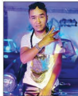
Manome fotoana antsika izy anio.