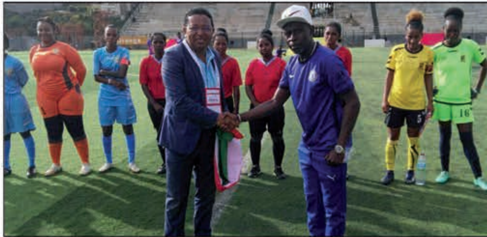
Ben'ny tanàna seriny amin'ny fampandrosoana ny baolina kitra.