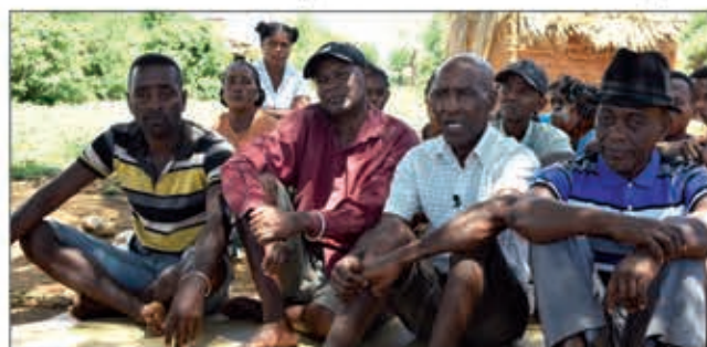
Miandrindra vahaolana haingana sy maharitra ireo mponina ao Benetsy.