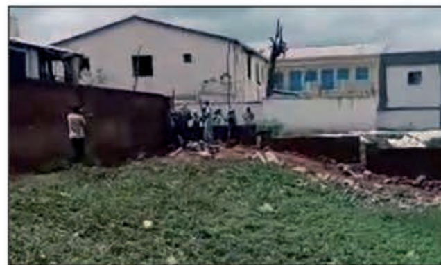
Ilay tany manan-tompo kasain'ny kaominina hanorenana.

Miantefa any amin'ny ben'ny tanàna sy ny filoham-pokotany ny hetsika fitakiana nataon'ny mponina satria toherin'ireto toponandraikitra ireto ny fampiasan'ny topony ny tany mitondra ny « référence FN:13_0/88 » eo amin'ny toerana atao hoe fokontany Avarantsena distrikan'i Tsiroanomandidy. Tsy nanaiky ny zanaka atsimo monina ao Tsiroanomandidy, fa heverin'izy ireo ho fananaraotampahefana izao ataon'ingahy ben'ny tanàna sy sefomponkontany izao. Nihetsika izy ireo araka izany ary nilaza ny tsy hilefitra fa hanohy ny fitakiany raha mbola mitohy ny fibodoana ilay toerana. "Nametrahanay tamboho teo mba hamaritana fa anay ny tany. Rehefa nandeha ny asa dia namoaka didy "arrêté communal" ny ben'ny tanàna hampit-saharana izany fa hoe tsy manara-dalana hono ka io no nampitokona ny fikambanana zanaka Antandroy. Marihina fa efa nisy ny fangatahana an'io tany io tamin'ny taona 19 88. Voafitaka ny ray amandreninay satria nolazaina fa tanim-panjakana ilay izy kanefa taty aoriana nisy