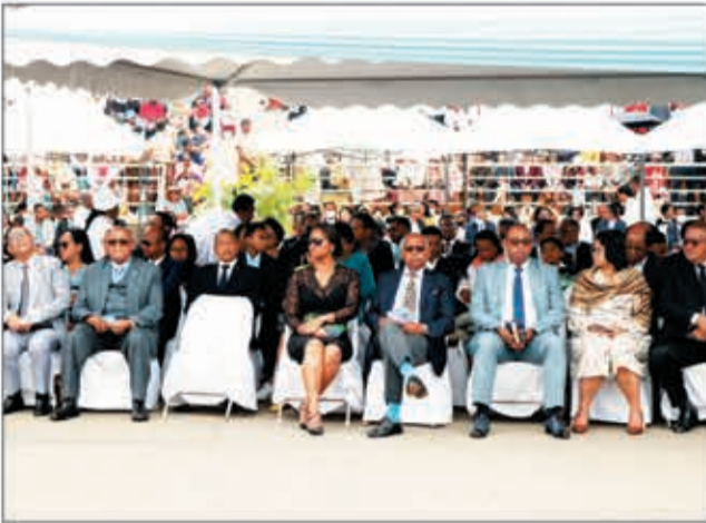
Tomponandraikim-panjakana maro no tonga nanotrona ny hetsika teny Antsonjombe omaly.

Nampiseho fahasahiana niteny ny zava-maharary eto amin'ny firenena ny fiangonana FJKM.