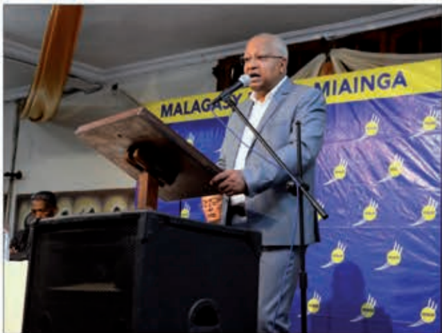
Tsy nisorona ny Filohan'ny antoko MMM raha naneho hevitra tao Betafo.