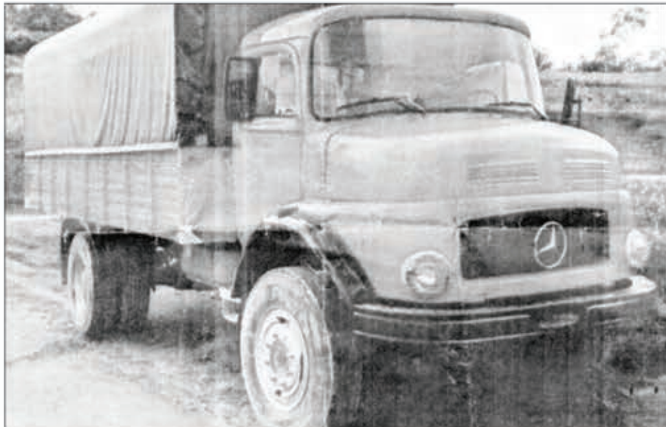
Ilay kamiao mbola tsy voaloha vola ara-dalana.

Fivadiham-pitokisana, mien-drika fisolokiana no azo ilazana ny zavatra ataon'ny renim-pianakaviana iray monina eny amin'ny fokontany Antaboka kaominina sy Distrikan'Arivonimamo. Tsy zoviana amin'ny maro ny anarany saingy ho fanajana azy dia noezahana tsy ho tononina. Vehivavy iray monina any amin'ny distrikan'Antanifotsy ilay voasolokiny. Nivarotra fiara tamin'io ramatoa avy any Arivonimamo io izy. Misy taratasy fifanarahana arabotra, sy fifanekena fa 50 tapitrisa ariary no vidin'ny kamiao be « 1313 » ireny. Efa herin-taona izao tsy voaloha ny vola izay mbola misy ambiny 14 tapitrisa ariary. Mihemotra lava ny fotoana handoavana azy ary tsy naloany hatramin'izao. « Fiara 50 tapitrisa ariary no namarotana azy ary 25 tapitrisa no vola nomeny voalohany. Taty aoriana dia nomeny tsipotipotiny ilay vola. Efa lafony ny fiara kanefa mbola misy antoka any amin'ny banky. Manana « carte grise » telo samihafa ilay ramatoa. Hafa ny laharan'ny fiara tany amboalohany. Rehefa tany aminy dia nosoloiny ho « 5039 TAR » ny laharany ary nosoratany tamin'ny reniny dia lasa « 1810 TAR » ary avy eo namidiny indray ka « 0091 TAA » amin'izao.