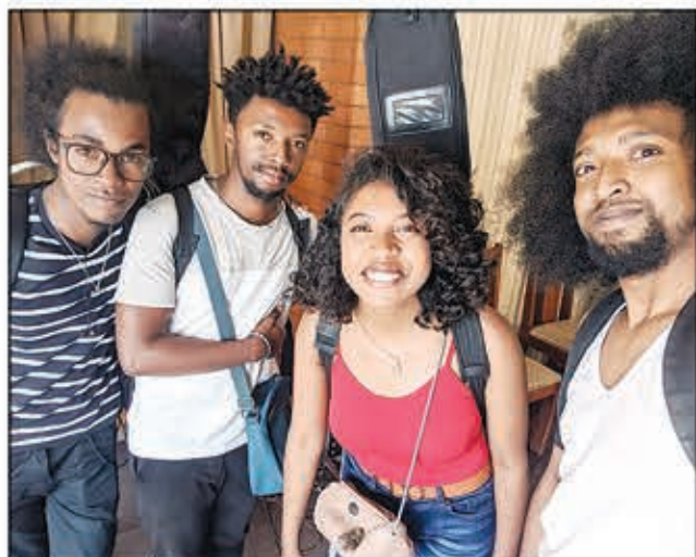
Ireo mandrafitra ny tarika.