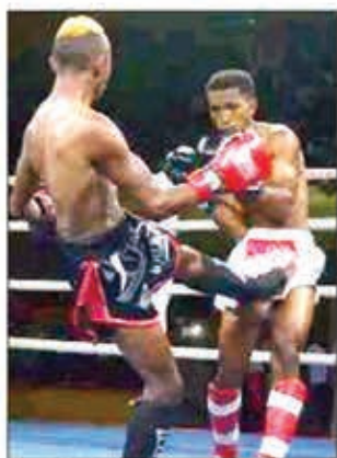
Isan'ny tena manavanana ny Malagasy ity kickboxing ity.

Faly sahirana ihany ny Federasiona Indrindra eo amin'ny hifantenana izay handrafitra ny ekipam-pirenena.