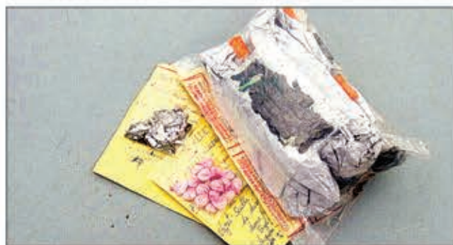
Ireo zava-mahadomelina sarena.

Lehilahy iray 37 taona sy vehivavy 31 taona no mitsindrona héroïne sady mivarotra izany zava-mahadomelina mahery vaika izany eny amin'ny IVO Antohomadinika. Ny alatsinainy izy ireo no sarena teny an-toerana ary nandritra ny fisavana dia mbola nahitana héroïne 2,30 grama tao amin'izy ireo. Nahazo loharanom-baovao ny polisy mikasika ny fisian'ny olona mivarotra sy mamatsy rongony mahery vaika eny amin'ny faritra IVO ka nandeha teny an-toerana nanamarina sy nijery ny zava-misy ary dia tratra tao izy ireo. Ankoatra io fitsindronana sy fivarotana héroïne io dia mifoka rongony ihany koa