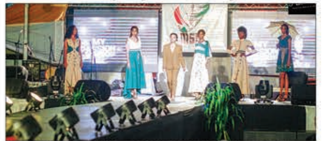
Sary nandritra ny "Mihamy Mada Fashion" andiany faha-2.

Hetsika hanomezana toska sy hampisongadinana ny sehatry ny haihaingo, natao hisarihana sy hanentanana ny mpiarabelona rehetra hanjifa ny zava-bita malagasy fonina sy vokarina eto Madagasikara, ny "Mihamy Mada Fashion". I Toamasina, ao amin'ny renivohitr'i Betsimisaraka, no handray ny andiany faha-4 amin'ity taona ity, izay hotanterahina ny 6-7-8 aprily 2023. Ny Ministeran'ny Serasera sy ny Kolontsaina no tompomarika amin'ny fikarakarana ny hetsika miaraka amin'ireo mpiara-miombona antoka aminy. Natao hampisongadinana ny tontolon'ny asa famoronana (industrie culturelle et creative) anatin'ny haihaingo sy ny zaitra. Tanjona ny hahafahan'ireo « styliste » matihanina na vao misondrotra hivelona amin'ny talentany amin'ny alalan'ny fampiroboroboana ny fandraharaharana ara-kolontsaina. Afaka mandray anjara amin'ity hetsika ity avokoa izay rehetra misehatra eo amin'ny famoronana lamaody sy ny zaitra ary ireo orinasa madinika sy salatsalany misehatra amin'ny hafaingo sy ny fikarakarana lanonana. Ho an'izay maniry ny handray anjara dia mila mandefa ny mombamomba azy sy ny zavatra ataony amin'ny adiresy mailaka "sedric2019@gmail.com" sy "samcdic2019@gmail.com".