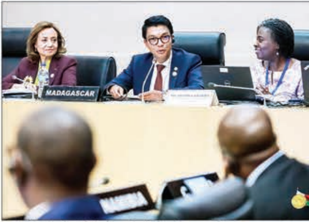
Ny Filoha Andry Rajoelina niady hevitra momba ny angovo tany Addis-Abeba.

Isan'ny nandray anjara sy nitarika ny delegasiona malagasy tamin'ny fihazana an-tampony faha-36 ho an'ny Vondrona Afrikana tany Addis-Abeba ny Filoha Andry Rajoelina. Nandritra ny dinika an-databatra boribory momba ny angovo no niresahany sy nitondrany vahaolana mikasika izany. « Tsy manan-tsafidy fa tsy maintsy mampitombo ny fahafahan'ny vahoaka mahazo herinaratra ny mpitondra eto Afrika », hoy ny Filoha Andry Rajoelina.