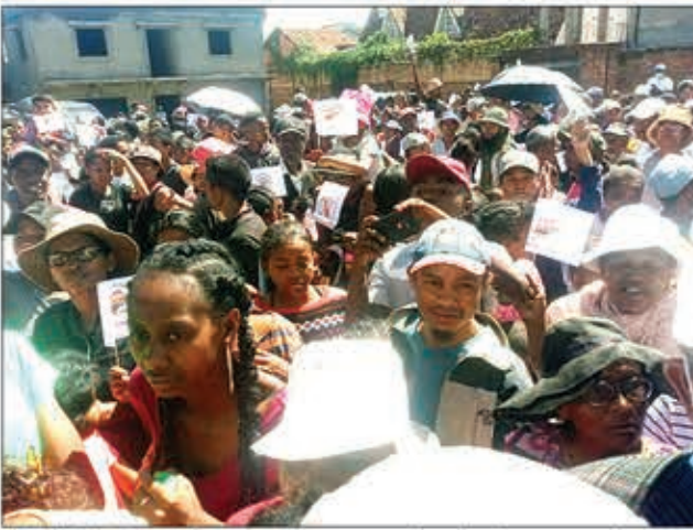
Ny Filoha teo aloha manoloana ny vahoaka tonga marobe, teny Faralaza.

Tontosa teny amin'ny tany malalaka, teny Faralaza (Talatamaty) ihany ny hetsiky ny antoko Tiako I Madagaskara, notarihin'i Marc Ravalomanana, rehefa nosakan-takanan'ny mpitondro filaminana, nanomboka omaly. Araka ny loharanom-baovao akaiky ny antoko TIM dia tamin'ny 8 ora maraina, talohan'ny nivoahan'ny Filoha teo aloha namonjy fiangonana, no efa tonga maro teny Faravohitra ny mpitondro filaminana, niaraka amin'ny fiara. Rehefa nanontanian'ny depiote avy ao amin'io antoko io izy ireo, araka ny loharanom-baovao etsy ambony ihany, dia nilaza fa manao fisafaoana. Taorian'izay dia nihazo ny « Soa Village »,