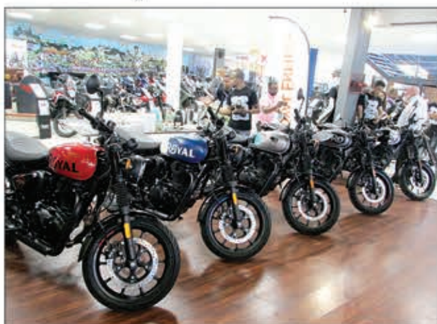
Maro ireo mpanjifa efa nanao famandrihana.

Efa fanta-daza amin'ny fana-pariahana ny marika môto "Royal Enfield" ny CT Motors. Nampahafantarina tamin'ny fomba ofisialy tamin'ny sabotsy lasa teo, teny Andraharo, ny fahatongavan'ny modely vaovao, dia ny "Royal Enfield Hunter 350". Nasaina nanatrika ny lanona ireo mpankafy môto, indrindra fa ireo tena mpampiasa ity marika ity eto Madagasikara. "Efa tao anatin'ny 10 taona no nampidirany ny marika "Royal Enfield" teto Madagasikara. Mandeha ny tsena, satria an-jatony no lafo tamin'ny modely teo aloha 500 ary toraka izany koa ny modely 350, izay nahalafosana teo amin'ny 250 hatramin'ny 300. Nivoatra be ny famokarana môto tamin'ity