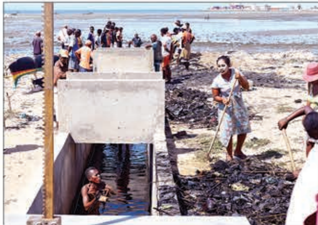
Nesorina avokoa ireo fako nanentsina ny tatatra.