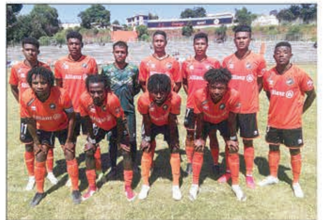
Efa manana elanelan'isa maro ny Fosa Junior FC.

Raha ny voka-dalao voaray tamin'ny andro faha-6, nanaovana ny lalao fifanintsanana amin'ny fiadiana ny tompondakan'ny " Orange Pro League 2022/2023 ", dia mivadibadika hatrany ny ekipa mitarika amin'ny laharana vonjimaika ao anatin'ny " Conférence Sud ". Tsy manam-piovana kosa izany hatramin'izao ao amin'ny " Conférence Nord ", dia ny fitarihan'ny ekipan'ny Fosa Junior (manana isa 18) avy any Boeny azy, izay nandavo ny USCAFoot 1 no ho 0 teo amin'ny kianja Alarobia. Mbola tsy manam-piovana ihany koa ny laharan'ny ekipa telo aoriany, ahitana ny COSFA Analamanga (11) sy ny USCAFoot Analamanga (9) ary ny AJESAIA Bongolava (8). Mbola manana lalao iray tsy vita ny ekipan'ny COSFA ary manana isa 11. Tahaka izao kosa ny voka-dalao (AJESAIA (2) # Ria Kitra FC (2) - COSFA (1) # AS Fanalamanga (0) - TFFC (4) # ASA (3)) sy ny laharana sasany ao anatin'ny " Conférence Nord " hatrany (5 / AS Fanalamanga Alaotra Mangoro (7) - 6 / TFFC Boeny (4) - 7 / Tia Kitra FC Atsinanana (4) - 8 / ASA Diana (2)). Amin'ireto ekipa