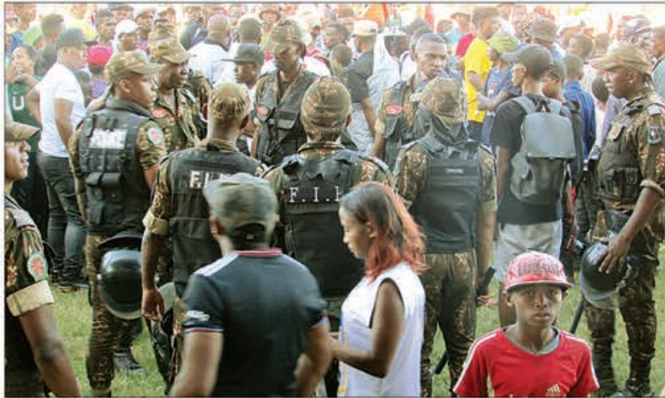
Efa lasa fahazaran-dratsy amin'ny taranja rugby ny firavana tsy lera !

Tezitra tamin'ny fanapahan-kevitra ny mpitsara lalao ny COSFA ka tsy nety nanohy ny lalao intsony.