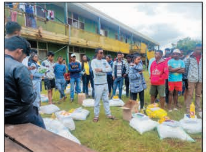
Nankasitrika ny fanampiana azo ireo mpianatra.

Nanatanteraka fizarana fanampiana ho an'ireo mpianatra ny Polytechnique Vontovorona may trano tao amin'ny (bloc 15), ny mpianatra maintimolaly mivondrona ao amin'ny "Reseau ESPA" ny asabotsy 14 janvier 2023. Ity fikambanana ity dia ivondronan'ireo mpianatra maintimolaly avy eto an-toerana sy avy any ivelany. Ho mariky ny fandraisana anjara biriky dia nanolotra vary 1 gony (25kg), stylo sy cahier maromaro, ary menaka 2 litra isan'olona. Efa hetsika faharoa moa ity hetsika ity, taorian'ny hetsika voalohany ny taona 2021 nentina nanohanana ireo zandriany nandritra ny valan'aretina Covid-19. Nisy ireo mpianatra tsy afaka niverina namonjy fodiana kanefa ny vatsy teo am-pelatanana tsy nisy, ka nahatsiaro nanana adidy ireo zoky namonjy ireo zandriany. Nanambara ny fikambanana fa hitohy hatrany ny asa sosialy kasain'izy ireo hatao.