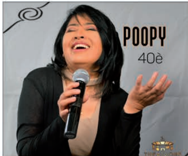
Manome fotoana antsika tsy ho ela i Poopy.

Taona manan-danja be eo amin'ny tantaram-piainanan'ny tarika Poopy ity taona ity. Amin'ity taona ity mantsy no feno 40 taona katroka ny niakaran'izy ireo an-tsehatra. Mbola tsy fantatra na aiza na rahoviana kosa aloha hatreto ny hankalazana izany, saingy mampantantena kosa ity mpanakanto ity fa tsy maintsy hanolotra zavatra goavana sy miavaka be ho an'ny mpanakanto izy ireo hanamarihana izany. Raha tsiahivina kely dia ny taona 1983 no niakatra an-tsehatra voalohany ny tarika. Tamin'izany dia efa betsaka ireo nankafy an'i