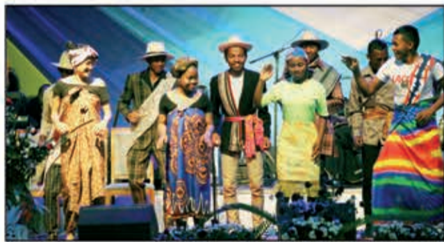
Nisy fanehoana ny talentan'ireo mpianatra omaly ary nofaranana tamin'ny fanompoam-pivavahana ny fankalazana.