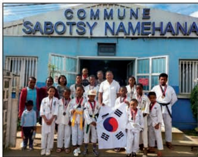
Mirobrobo ny taranja ara-panatanjahantena eny SAB NAM !