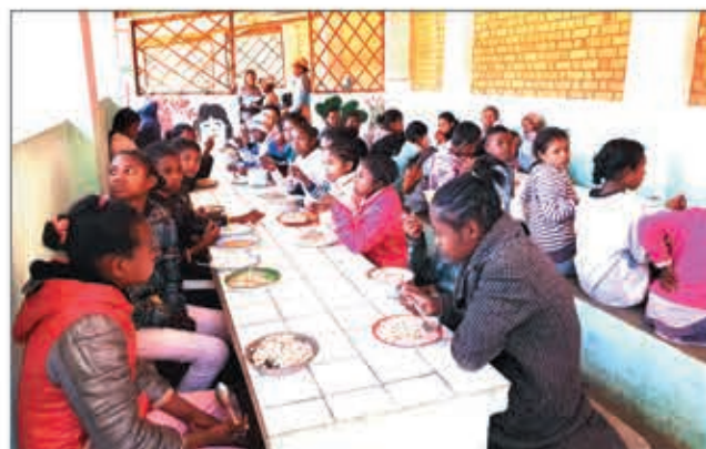
Les candidats au CEPE bénéficiaires des repas chauds de l'Imanga de Strasbourg.