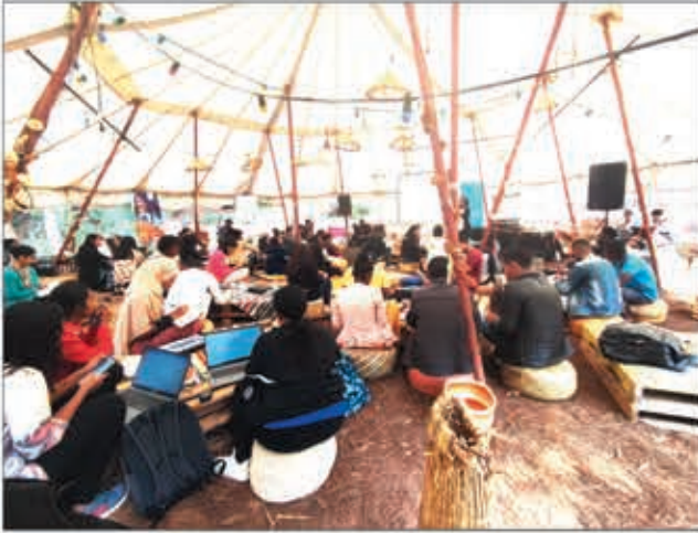
Le « bootcamp » (atelier), lors de la constitution de cette alliance, qui s'est tenu à Tana.