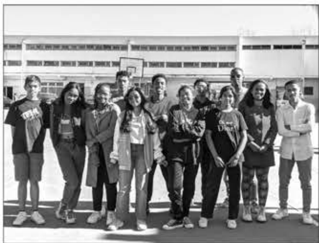
Les membres de la Compagnie théâtrale francophone du LMA Ampefiloha.