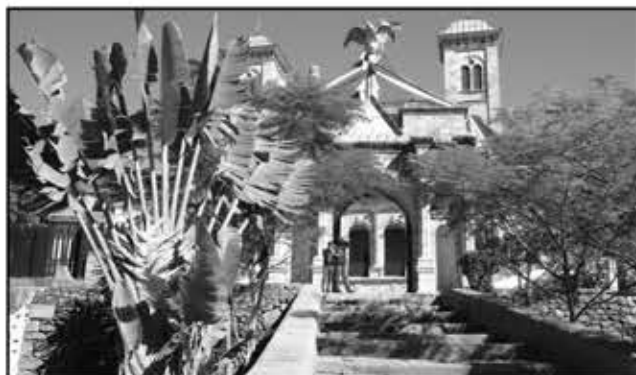
Le Musée de Madagascar ouvre désormais ses portes au public.

alimenté d'ici et d'ailleurs ira à l'encontre de l'Unité nationale, souhaitée par les aïeux. Sans équivoque, la ville des Mille est la capitale de Madagascar. Pourtant, cette vérité est dure à avaler pour les traditionalistes des régions. Car d'après eux, « Antananarivo n'est pas Madagascar ». Une phrase maintes fois répétée par les adeptes de la décentralisation mais surtout les fédéralistes. Ces derniers prouvent que « le Pays avait plusieurs souverains, leurs mœurs, leurs structures sociales ». Et le gouvernement doit absolument considérer ces paramètres. « Madagascar se développe à grand pas si nous nous reconnaissons. Malheu-