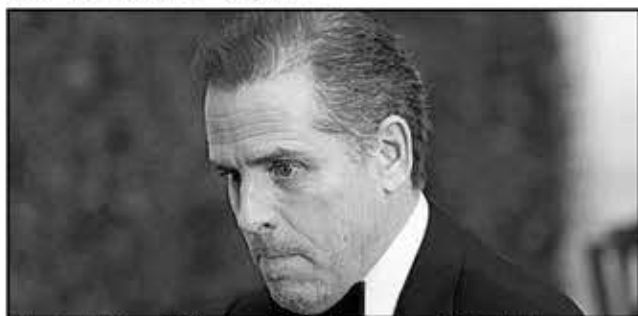
Hunter Biden, le fils du président, a accepté de plaider coupable de fraude à l'impôt sur le revenu dans le cadre d'un accord avec le ministère de la Justice.