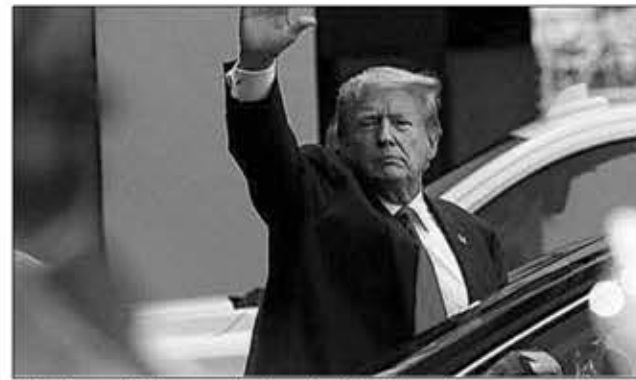
"J'ai parfaitement le droit d'avoir ces cartons", a affirmé Donald Trump.

L'ancien président républicain est accusé d'avoir mis la sécurité des États-Unis en péril en conservant des documents confidentiels, dont des plans militaires ou des informations sur des armes nucléaires, dans des toilettes ou débarras de sa résidence de luxe de Mar-a-Lago, en Floride, au lieu de les remettre aux Archives nationales.