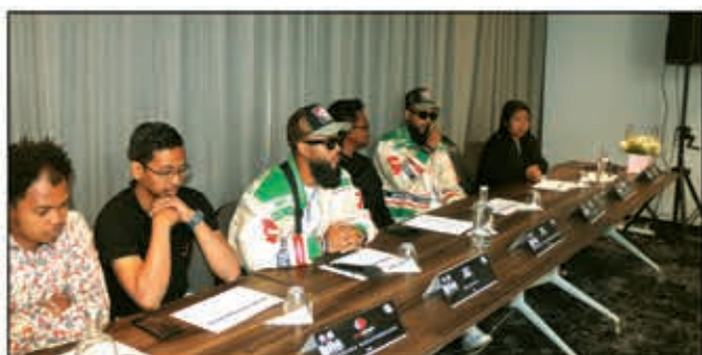
Le groupe JS Twins est dans nos murs, il va se produire le 1 er juillet à l'IFM.