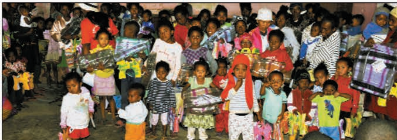
Fidèle à sa tradition, le groupe Midi Madagasikara n'a pas oublié les familles nécessiteuses du quartier d'Ankorondrano-Est à la veille de la Fête de l'Indépendance en leur offrant des lampions et des couvertures. Les enfants se sont régalez d'un repas chaud.