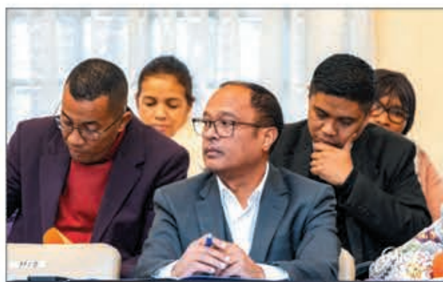
Le ministre Edgard Razafindravahy a présenté le projet de loi sur l'APEi à Tsimbazaza.