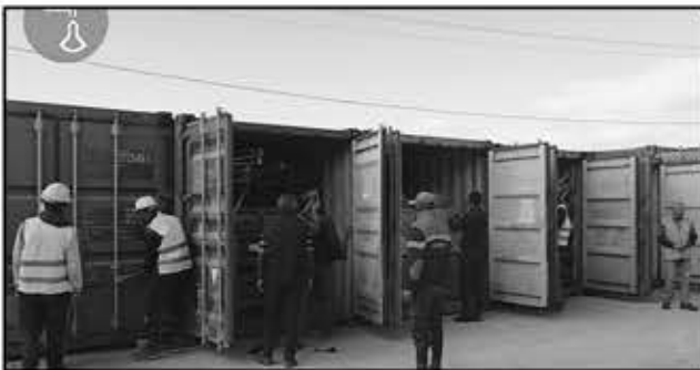
Les représentants de la Jirama et du MEH à la Centrale d'Ambohimanambola, lors de la réception des matériaux et équipements.

Capacité de production. L'objectif principal de cette extension est de résoudre les problèmes récurrents de pénurie d'électricité auxquels fait face la Jirama, la compagnie nationale d'électricité de Madagascar. La centrale électrique d'Ambohimanambola produira de l'énergie à moindre coût, offrant ainsi une solution durable pour répondre à la demande croissante en électricité dans la capitale. En étant directement financé par l'État malgache, ce projet permettra de réduire les coûts de production d'électricité par rapport aux importations. La nouvelle centrale thermique d'Ambohimanambola sera opérationnelle d'ici la fin de cette année, mais compte tenu de l'urgence de la situation, les groupes pourront fonctionner progressivement. Une fois achevée, elle mettra fin aux problèmes de déles-