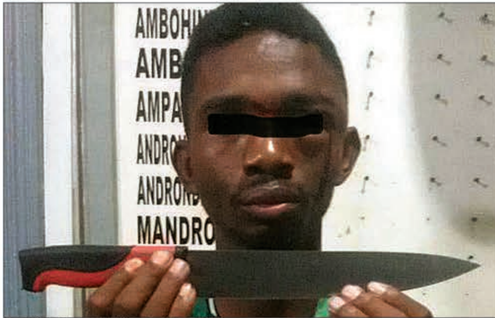
La police du 2 e arrondissement l'a arrêté.

Après le coucher du soleil, son deuxième travail commence : le vol à la tire. Son terrain de chasse est le quartier d'Ambohipo, un quartier populaire abritant principalement des migrants des côtes de l'île. Il utilise une arme tranchante d'au moins 50 cm pour ses méfaits. Cette fois-ci, après de multiples signalements, la police du deuxième arrondissement l'a discrètement suivi. Le jeune homme n'était pas conscient que des policiers l'avaient observé de près pendant tous ses déplacements. Lorsque le délinquant est passé à l'action, les policiers l'ont attrapé. Pris en flagrant délit, il n'avait d'autre choix que de se rendre. Les procédures ont été rapides et, à l'issue de l'enquête préliminaire, il a