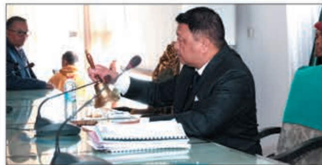
Le face-à-face gouvernement-Sénat a été placé sous la houlette du président du Sénat, Herimanana Razafimahefa.