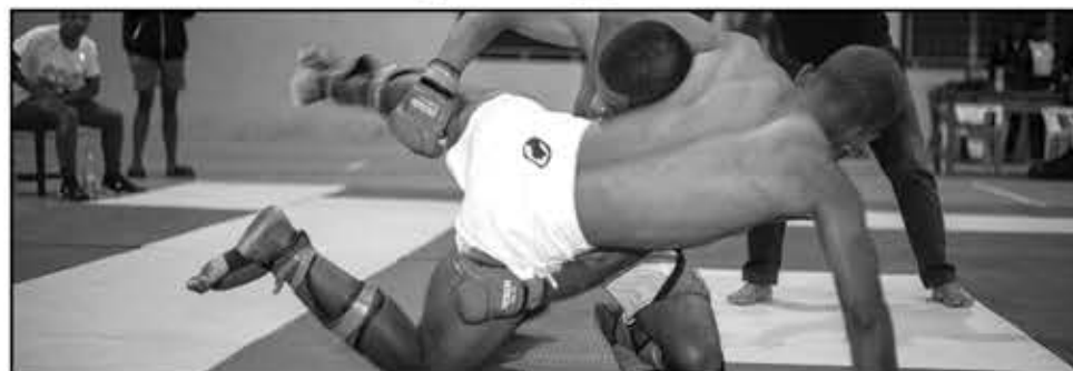
Une belle bagarre lors du grand combat, à Fianarantsoa.