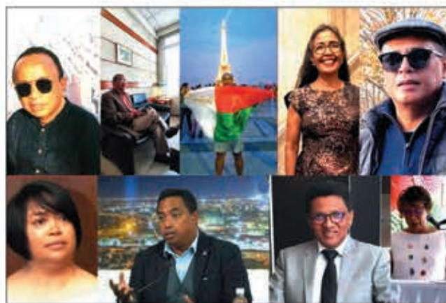
Collectif des citoyens d'origine malgache monde