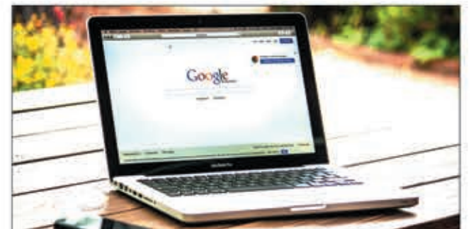
L'accès au prix d'internet est tributaire du pouvoir d'achat des Malgaches.