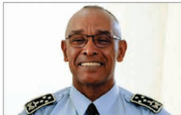
Tour à tour, les membres du gouvernement prennent la défense d'Andry Rajoelina.