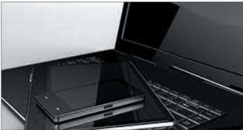
L'identifiant unique entend mettre fin à l'existence en nombre d'identifiants pour chaque Malgache.

D'ici fin 2024, l'Etat malgache ambitionne de « permettre à la moitié de la population de disposer d'un nouvel identifiant unique ». Cela a été avancé lors du lancement du concours Prototype à Ivandry hier. La perspective entre dans le cadre de la mise en œuvre du projet Prodigy ou Projet de gouvernance digitale et de gestion de l'identité malagasy, financé par la Banque Mondiale et qui entend correspondre au renouveau de l'administration publique malgache. L'annonce faite hier sonne comme une confirmation du discours selon lequel la mise en place de l'identifiant unique est en cours actuellement. Une des avancées majeures selon le ministère du Développement numérique, de la transformation digitale, des postes et de la Télécommunication serait l'élaboration de la feuille de route en collaboration avec l'Unité de Gouvernance digi-