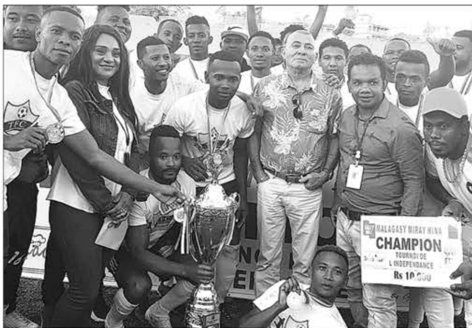
L'équipe championne avec l'association et l'ambassadeur.

REPOBLIKAN'I MADAGASIKARA Fitiavana - Tanindrazana - Fandrosoana