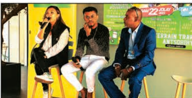
À l'initiative de l'artiste Dady Love, la 1 ère édition du festival Dona Be s'annonce grandiose à Antsohihy, du 21 au 23 juillet.