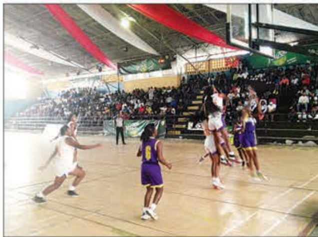
Mivoatra ny fifaninanana karakarain'ny SBBAR !

Na dia hisantatra ny andro voalohany amin'ny fiadiana ny tompondakany aza ny "Section de Basket-Ball Antananarivo Renivohitra" amin'izao faran'ny herinandro izao, dia efa nisy lalao fifanintsanana tamin'ny sokajy hafa, notanterahina tamin'ny herinandro lasa teo iny, iray andro taorian'ny lanonam-panokafana ny taom-pilalaoavana, teny amin'ny kianja mitafon'i Mahamasina. Amin'ity taom-pilalaoavana ity dia azo lazaina fa hangotraka ny fiadiana ny tompondakany 2023. Hita taratra izany