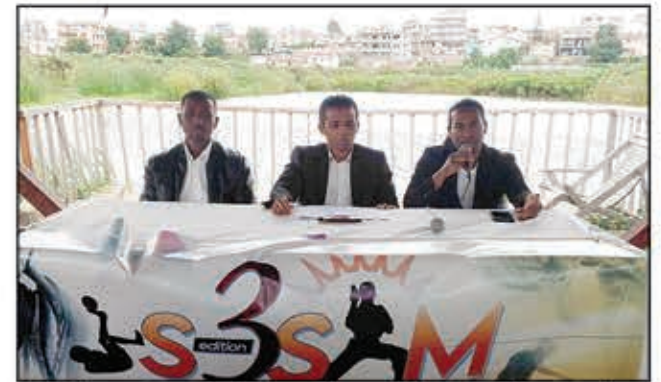
Nandritra ny fampahafantaran'ireto mpikarakara ireto omaly, ny fisian'ny hetsika andiany fahatelo.