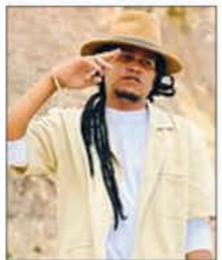
Mbola miketrika vokatry hafa indray izy amin'izao.

Mitohy indray ny tantara, nivoaka indray izao ny "ozona 2.0" an'i Tann Faya. Omaly izany no efa navoakany tamin'ny fomba ofisialy ary efa azo jerena ao amin'ny "you tube" ao. Raha tsiahivina tamin'ny efa-taona lasa izy no namoaka ny hirany mitondra lohateny hoe "ozona", io voalohany, hiram-pitiavana izay somary hafakely satria dia maniry ratsy olon-tiana izay niarahana taloha izy io ary dia maro no liana nihaino izany