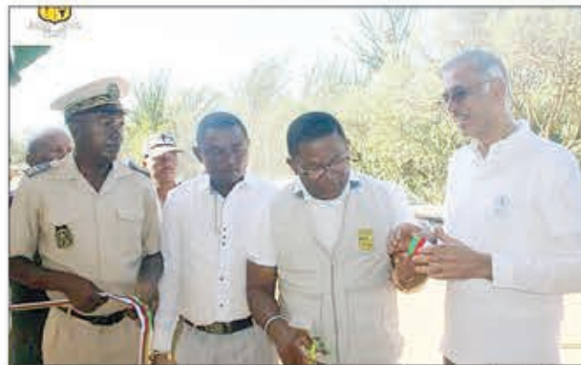
Ireo tomponandraikitra nandritra ny nanapahana ny "ruban".

Fotoan-dehibe ho an'ny distrikan'Amboasary atsimo ny nitokanana ny fotodrafitrasa ho fanatsarana ny fari-piainan' ireo mpiara-belona tany amin'ny fokontanin'Anjambahavelo, kaominina Ifotoka izay, notokanana omaly. "Tsy fanampiana amin'ny alalan'ny fizarana sakafo ho an'ireo mpiara-belona marefo ara-pivelomana araka sy fahafantarana azy ihany, no ataon'ny ny PAM, fa mitondra ny anjara birikiny amin'ny fanovana maharitra mankany amin'ny tsaratsara kokoa, ny fari-piainan'ireo mpiara-belona eny amin'ny tontolo ambani-vohitra amin'ny alalan'ny tetik'asa Transformation Rurale Rapide de Madagascar", hoy Atoa Raharimbola Jocelyn, Governoran'ny Faritra Anosy tany an-toerana. Isan'ny vita tamin'izany ny fanorenana ny fotodrafitrasa iray izay misy herinaratra azo avy amin'ny herin'ny masoandro ao amin'ny fokontany Anjambahavelo ao amin'ny distrikan'Amboasary atsimo izay vao notokanana omaly. Izany dia vokatra ny fiaraha-miasan'ny Fitondram-panjakana sy ny "Programme Alimentaire Mondial". "Voavaha ny olana amin'ny filàna herinaratra mba hiatrehana ireo asa fampidiram-bola ho an'ireo tantsaha ary fanamby napetraky ny Filoham-pirenena Andry Nirina Rajoelina, ny hitondrana hazavana ho an'ny Malagasy rehetra", hoy hatrany ny Governoran'ny Faritra Anosy Jocelyn Raharimbola nandritra ny fitokanana ity fotodrafitrasa ity. Tonga nanotrona izany lanonana izany koa ny Delegasiona eo anivon'ny PAM avy any Rôma izay teo ambany fitarihan'Atoa Manoj Jenuja izay tale mpanatanteraka lefitra ny PAM.