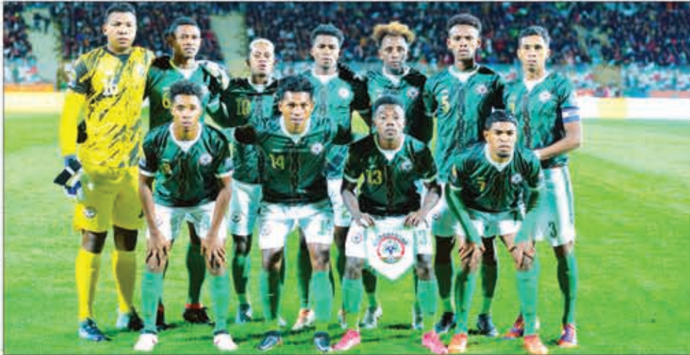
Tombony ho an'ireto mpilalaontsika ireto ny fananany firaisankina sy firaisan-tsaina !