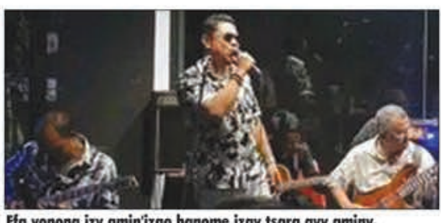
Efa vonona izy amin'izao hanome izay tsara avy aminy.