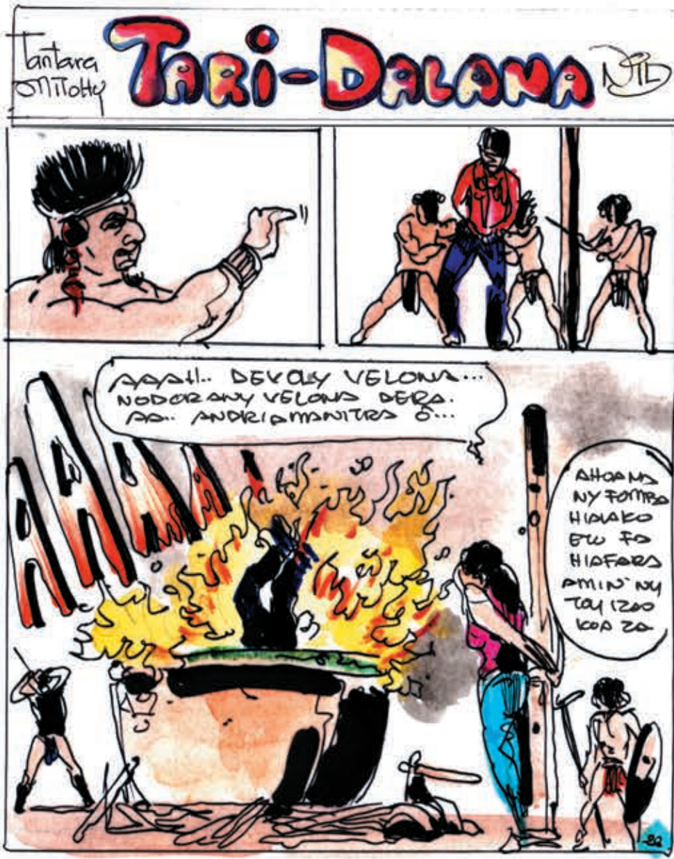
Tantara sy sary: Nil