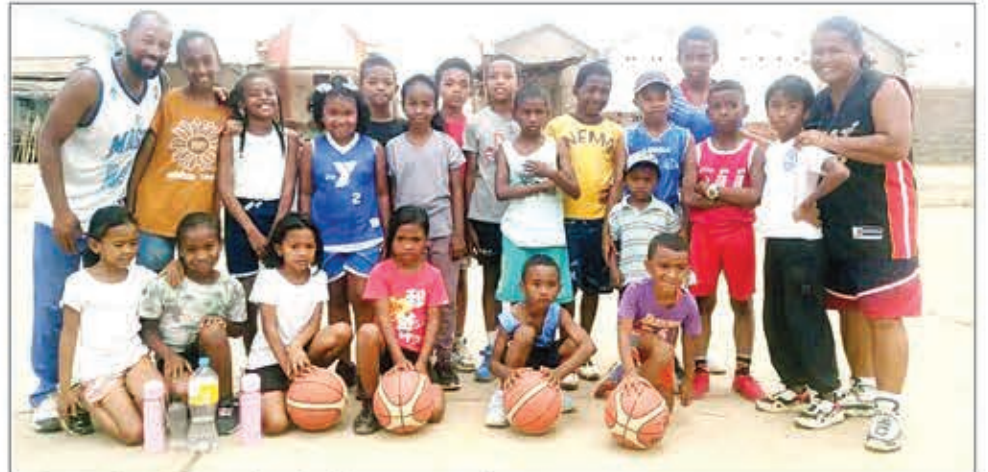
Zarina amin'ny lalana tokony halehany ny zaza !