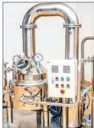
Hampiakatra ny lanjan'ny tantely ny fanodinana azy.

Manana ny lazany amin'ny famokarana tantely ny faritra Amoron'i Mania. Noraisana tamin'ny fomba ofisialy tao Ambositra tamin'ny faran'ny herinandro teo, tao anatin'ny tetikasa "Taninketsa Industrialy", ny fahatongavan'ireo fitaovana hoentina mametraka ny tetikasa fanodinana tantely ao an-toerana. Tonga nampiseho ireo fitaovana tany Ambositra ny minisitry ny fampirobo-roboana ny indostria sy ny varotra ary ny fanjifana. Avy hatrany dia natomboky ny minisitry tamin'io fotoana io