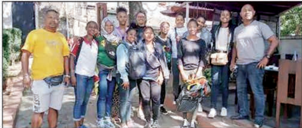
Miisa 16 ny delegasiona, ahitana mpilalao 12 sy mpitantana efatra.

Hatramin'ny, omaly, dia mbola tsy nahenoana vaovao ny klioban'ny Bi'As, izay ekipa efa nanambara ny amin'ny fandraisany anjara.