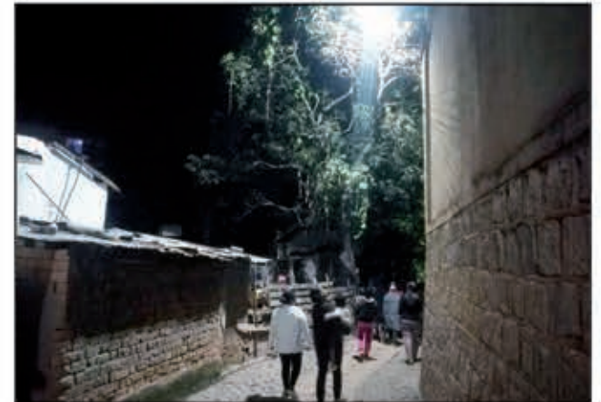
Nazava avokoa ireo elakelan-trano teny Andohananimandroseza.

Vina goavana napetraky ny fitondram-panjakana ny hanome hazavana ho an'ny daholobe. Natomboka tamin'ny alakamisy hariva teny amin'ny Fokontany Andohananimandroseza, Boriboritany faharoa, ny tetikasa "Hazavao ny elakelan-trano". Jiro "Cobras" teo amin'ny 20 no napetraka tamin'ny elakelan-trano isaky ny 50 metatra tao amin'ny kartie Andohananimandroseza Ambany Avaratra. "Zava-doza ny tsy fandriampahalemana taty aminay fony mbola tsy nisy jiro. Misy tranga tsy fandriampahalemana foana isan'andro isan'andro. Iraha-mahalala fa toerana mafanafana ao anatin'ny boriboritany faharoa ny ety. Ny vaky trano sy ny fanendahana ary ny hala-botry no tena ahazoana fitarainana matetika. Misaotra ny fanjakana nitondra ny hazavana taty aminay fa