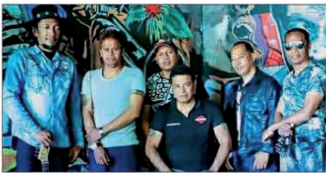
"Au grand complet" ny tarika amin'io.