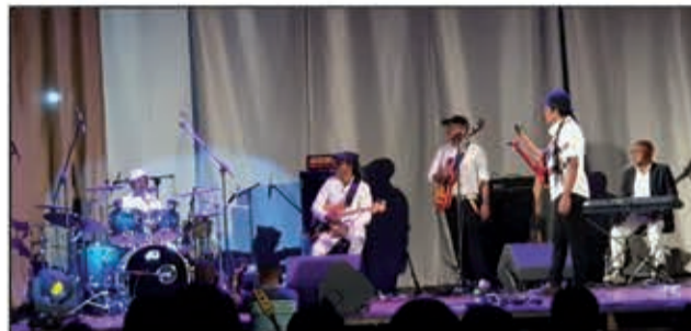
Mampanantena fiarahana milay be ry zalahy ireto, anio.