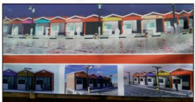
Tahaka izao ny endriky ny tsena vaovao.

Fanatanterahana ny tetikasa fananganana tsena vaovao no hitsenan'ny kaominina Ambovohitra Ambohidratrimo ny taona 2023, mba hanomezana fahafampo ny mpivarotra, ny mpi-vidy ary ny vahoaka amin'ny ankapobeny. "Box commercial" miisa 50 no hatsangana ao an-tampon-tanana ary hatomboka amin'ny volana febroary iny ny asa. Tetikasa novola-volain'ny kaominina hanesorana an'ireo mpivarotra amoron-dalana izay hita fa miha-betsaka eny an-toe-