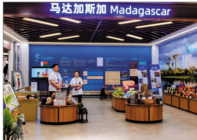
Amin'ny maha-firenena vahiny manokana an'i Madagasikara, nomena trano heva iray fanampiny izy tao amin'ny foiben'ny CAETE.