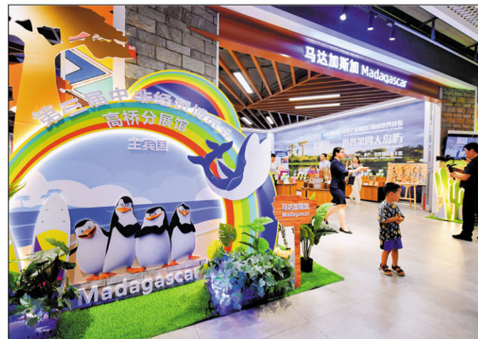
Nampahafantatra ny vokatra Malagasy tamin'ny alalan'ny fitantarana mivantana ireo orinasan-tserasera sinoa.