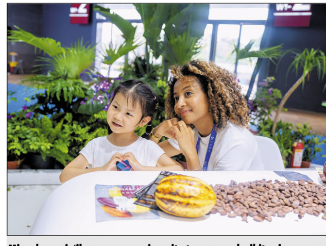
Miaraka amin'ilay zazavavy sinoa ity tomponandrika iray eo amin'ny trano heva ity manao sarin'ny fo amin'ny tanana.