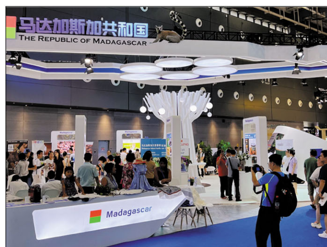
Ireo mpitsidika manoloana ny trano heva an'i Madagasikara.