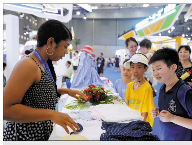
Manadihady momba ny akanjon'ankizy "vita Malagasy" ireo ankizy sinoa.