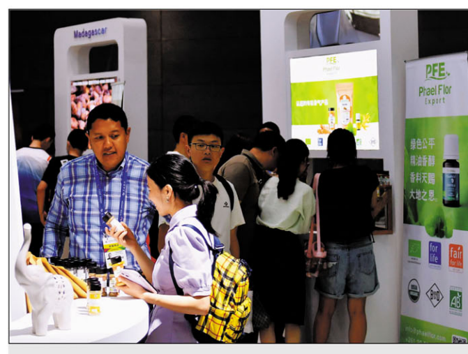
Isan'ny tena nahaliana sy tian'ny sinoa ny lohamenaka sy ny "épices" avy aty Madagasikara.