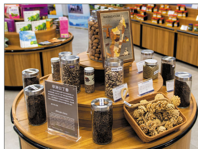
Ampahany amin'ireo vokatra Malagasy hita ao amin'ny trano heva.