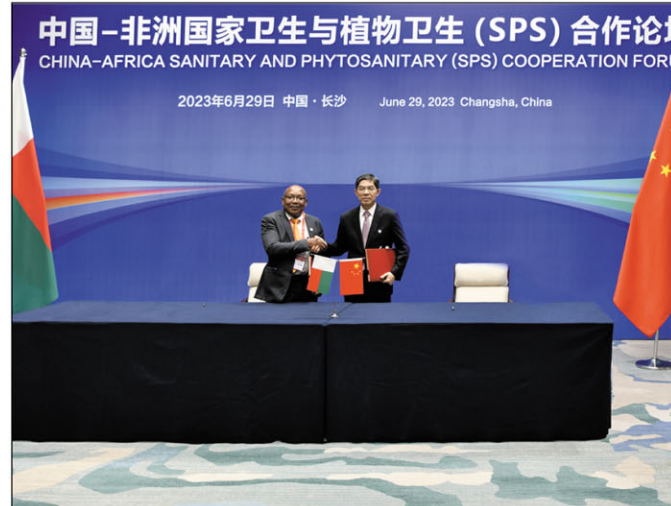
Ireo nanao sonia ilay fifanarahana momba ny fizahana sy fanakanana monina ny henan'ondry avy aty Madagasika ho any Chine nandritra ny Fampirantiana.