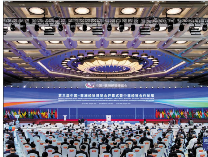
Nisokatra tamin'ny fomba ofisialy ny 29 jiona 2023 ny Fampirantiana ara-toekarena sy ara-barotra sinoa sy afrikanina fahatelo izay natao tao Changsha ao amin'ny faritanin'i Hunan.

Vonona aho hiara-miasa amin'ireo namana Malagasy hampiasa ireo fanararaotra vaovao nentin'ny Fampirantiana amin'ny fanatanterahana hatrany ireo tetikasam-piraha-miasa tafiditra ao anatin'ny "Fandaharana Sivy" eo anivon'ny FOCAC mba hitrandrahana lalina ny herijika eo amin'ny fiaraha-miasa ara-toekarena sy ara-barotra eo amin'ny firenena roa tonta ka hisitraka ny vokatra ny fiaraha-miasa ny vahoakan'ny firenena roa tonta.