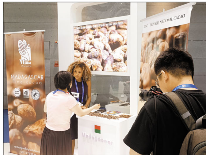
Mampahafantatra ny vokatra Malagasy ny mpiandry ny trano heva.