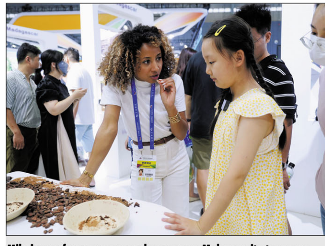
Mihaino ny fanazavana momba ny cacao Malagasy ity tovovavy sinoa ity.