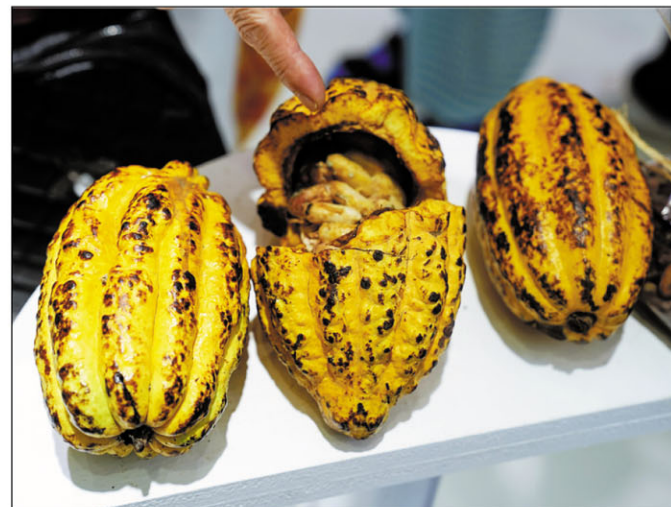
Isa ireo vokatra avy aty Madagasikara nahasrika olona ny cacao.