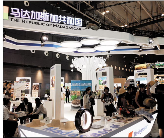
Mamantatra ny "Vita Malagasy" ire orinasa sinoa.