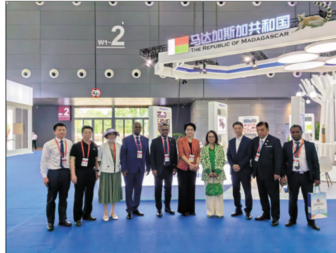
Ny delegasiona Malagasy tarihin-dRamatoa Ministiry ny Raharaham-bahiny miaraka amin'ireo sinoa mpikarakara ny Fampirantiana.