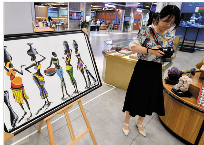
Maka sary eo amin'ny trano heva an'i Madagasikara.