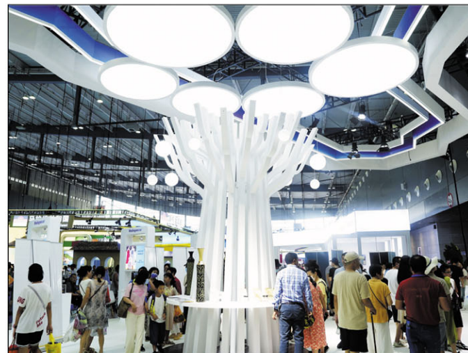
Manana endrika baobab ny zavatra naseho.