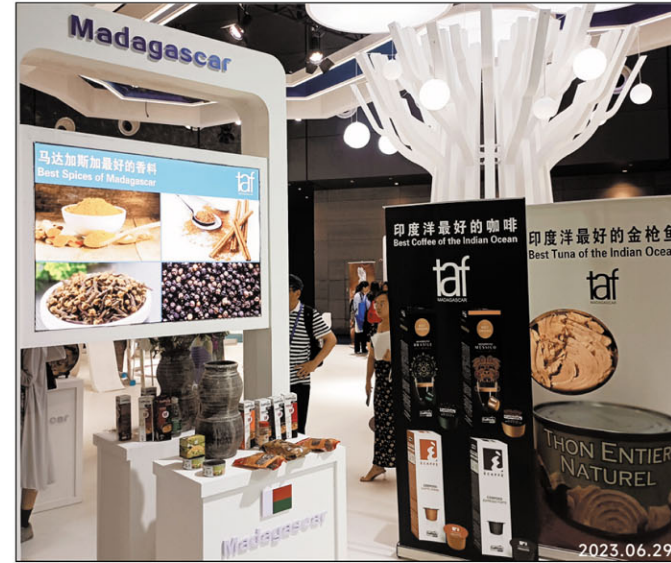
Ireo vokatra tsara sy mampalaza an'i Madagasikara.