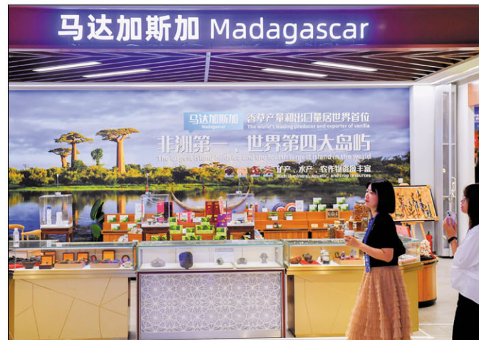
Miato kely eo anoloan'ny trano heva an'i Madagasikara ao amin'ny CAETE ireto mpitsidika ireto.