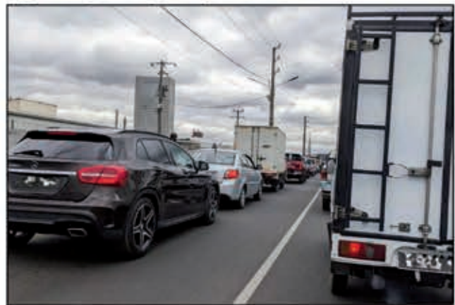
Toy izao ny fitohanana nitranga omaly tetsy Ankorondrano.

Nanomboka omaly, nampikaikaika olona maro ny fitohanana ny fiara teny Ankorondrano sy ny manodidina. Nandany ora maromaro mihitsy ny fiara avy any Ampasampito, Analamahitsy, Antanimena, Ankazomanga, sy ireo fiara avy any amin'ny manodidina vao afaka. Efa nisy filazana ihany nataon'ny fiadidiana ny tanan'Antananarivo Renivohitra fa misy ny asa atao amin'ny fametrahana ireo "pylone" ka tokony hanaraka fandaminana. Araka ny voalaza herinandro maromaro lasa izay, eo anelanelan'ny 26 jolay hatramin'ny 16 aogositra 2023, hisy ny fanapahan-dalana avy