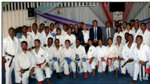
Nandritra ny fitsidihan'ireo minisitra mpiahy ny ekipam-pirenena tetsy amin'ny by-pass afakomaly.