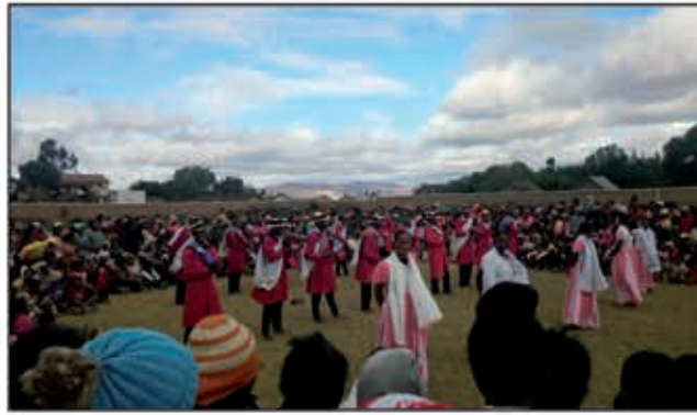
Hakotrokotroka ny fihainoana hira gasy amin'io.