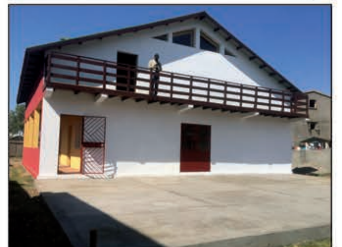
13 taona aty aoriana fa nanana trano ho azy manokana ny ONG Zara Aina.