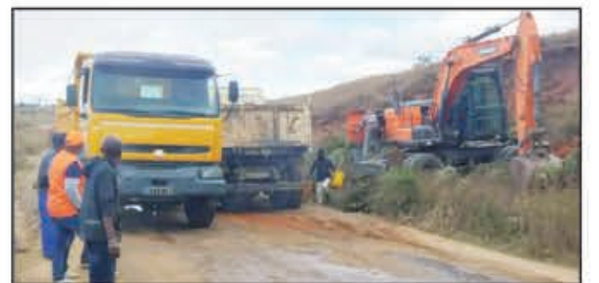
Nidina an-tsehata nijery ny fizotry ny asa ny governoran'ny faritra Analamanga.