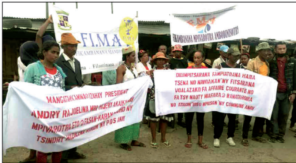
Ifandroritan'ireo mpivarotra ny resaka haban-tsena eto amin'ny tanànan'Antananarivo.