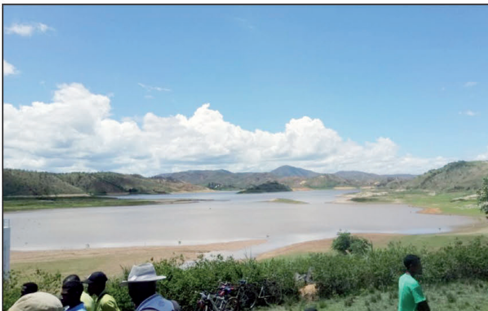
Tandindonin-doza ihany koa ny farihin'Alaotra.