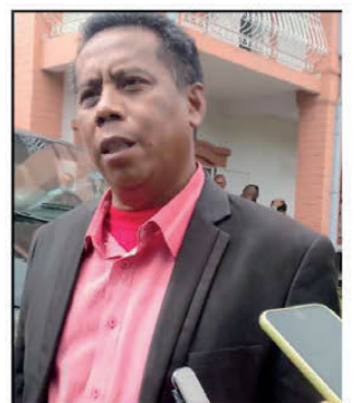
Vonona hampiakatra avo ny lontan'ny Taekwondo Malagasy ity filohan'ny federasiona ity.