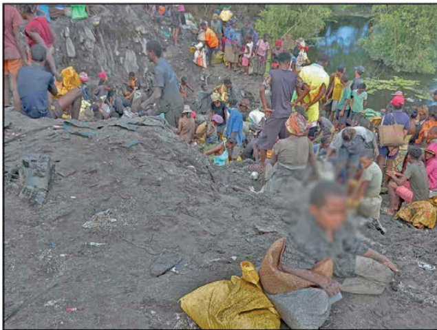
Ireo olona tonga namongatra ny vary tao Antsarimasina.

Tonia mpampanoa lalàna eo anivon'ny Fitarana ambaratonga voalohany ao Toamasina sy ny zandary ary ny pôlisy sy ny fitaleavamparity ny fampiroboroboana ny indostria sy ny varotra ao Atsinanana, anefa dia nisy andian'olona tonga namongatra ireo vary tao Antsarimasina ny alin'ny alatsinainy ihany. Tonga teny antoerana nanaparitaka ireo olona ireo ny mpitandro ny filaminana vantany vao naheno ny vaovao. Mbola niverina teny amin'io toerana io ihany anefa ireo olona ireo rehefa lasa ireo mpitandro filaminana. Tsy azo hanina intsony fa