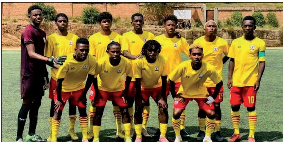
Ekipa mampiasa ny fahaiza-manaon'ny tanora.