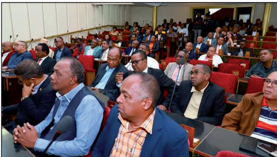
Ireo mpikamban'ny Antenimierampirenena ankehitriny.

Miainga amin'ny ambaran' ny andininy faha-68-n'ny Lalampanorenana dia natao hanara-maso ny asan'ny Andrimpanjakana mpanatanteraka ny Andrimpanjakana mpanao lalana, ahitana ny Antenimierampirenena sy ny Antenimieran-doholona. Niarahan' ny rehetra nahatsikaritra, nandritra ny fitondrana teo aloha fa tsy nisy loatra izay adivevitra izay, teny Tsimbazaza, nandritra ny fotoana anaovan'ny governemanta tatitra ny asa vitany sy nandritra ny fandanihana tolo-dalana. Ny zava-nisy dia na manasohaso ny mpikambana ao amin'ny governemanta ny solombavambahoaka na mangataka ny hanorenana fotodrafitrasa. Ireo depiote vitsivitsy mba nahasahy nanakiana ny governemanta dia toa fombafomba fotsiny ny ankamaroany