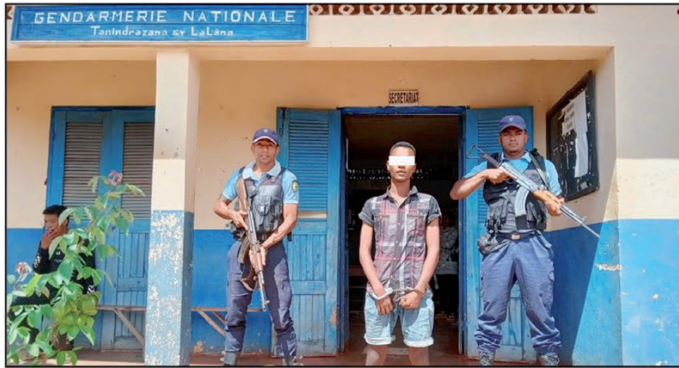
Ilay tovolahy !

Zary lasa fanaon'ny tanora amin'izao fotoana indray ity manità-kevitra mitsoaka ny tranon-dRay aman-dReniny ity. Ankizivavy iray mbola tsy ampy taona, satria tokony ho fito ambinifolo taona eo indray mantsy no nentin'ny tovolahy nitsoaka ny faran'ny herinandro teo iny. Raha ny fanazavàna azo dia mpisipa izy roa kely ireto ary tokony ho telo amby roapolo taona eo ilay tovolahy. Teny Ankadinandriana-Avaradrano no nahatratraran'ny zandary azy ireo. Voalaza fa nandeha taxi-môtô izy roa, izay avy any Miadanandriana, distrikan'i Manjakanandriana ary saika hiakatra ho aty Antananarivo. Teny andalana anefa dia efa tsy nifanaraka izy roa, satria nangataka tamin'ilay tovo-