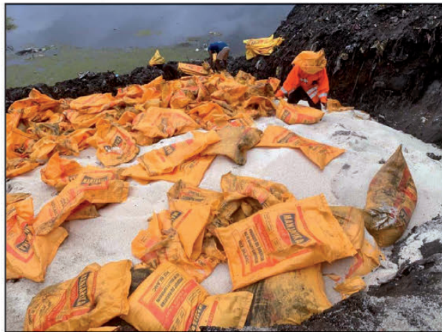
Famotehana ireo vary simba.

Nanao tampody fohy ireo olona rehefa lasa ny mpitandro filaminana.