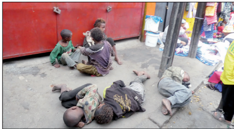
Ny arabe no mba hiankinana sy hatorian'izy enin-dahy.