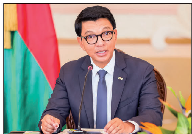
Ny Filoha Rajoelina no hitarika Filankevitry ny minisitra ao Toamasina.