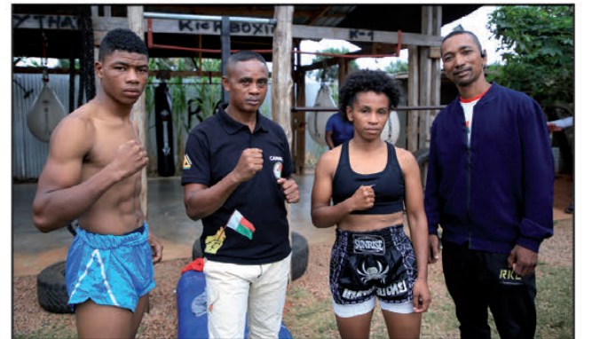
Vonona handrombaka vokatra tsara atsy La Réunion ny solontenantsika.