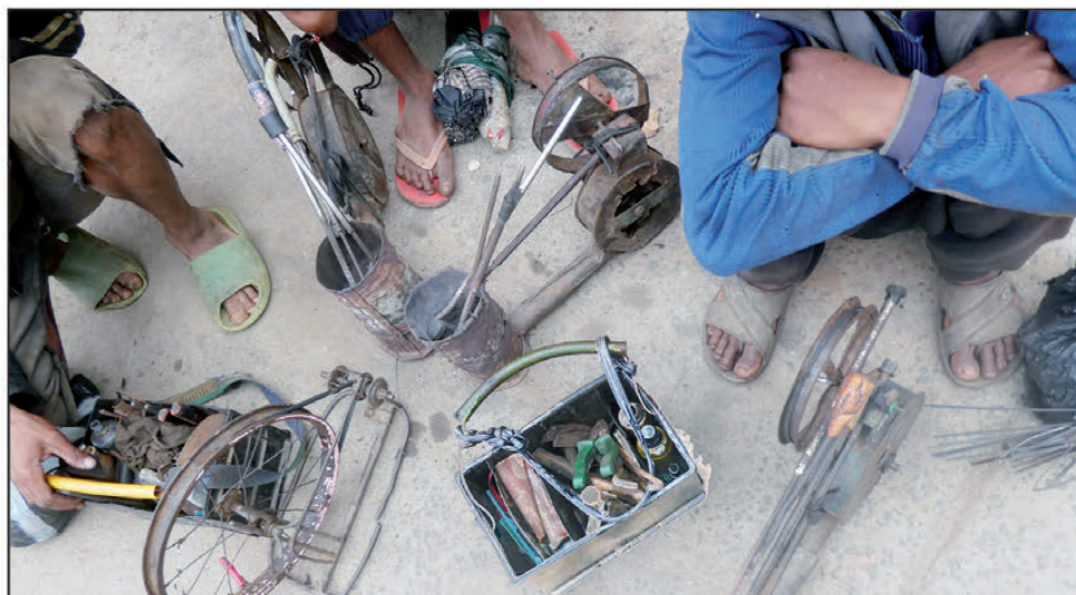
Tsy inona akory ireto fa fitaovana hahafahan'ny mpiray tanindrazana amintsika mivelona.