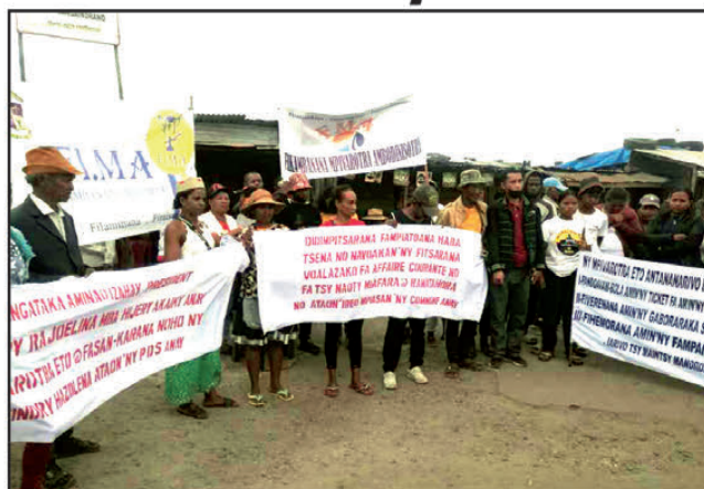
Nilanja sora-baventy ireo mpivarotra.

Tsy mety tapitra ny savoro-vooro mikasika ny raharaha haban-tsena eto Antananarivo Renivohitra. Omaly maraina, nifamotona teny amin'ny tobim-piantsonana rezonaly Fasan'ny Karàna ireo mpivarotra tsy mankasitraka ny fakana haban-tsena mivantana ataon'ny kaominina. Hita teny antoerana ny solontenan'ireo mpivarotra ao anatin'ity toby ity sy ny avy amin'ny FMA (Fikambanana Mpivarotra Ambodinisotry) ary ny FI.MA (Fikambanana Mandresy). "Ny fampiasana ilay karatra biometrika nape-traky ny mpitantana ny tanàna teo aloha dia antoka ho an'ny fahamarinan-toerana ny mpivarotra no sady hahafahana misoroka ny kolikoly amin'ny fikirakirana vola mivantana. Mitaintaina foana izahay teo aloha hoe hafindra ho aiza indray, kanefa rehefa nampiasa ilay karatra dia tsy voakitikitika