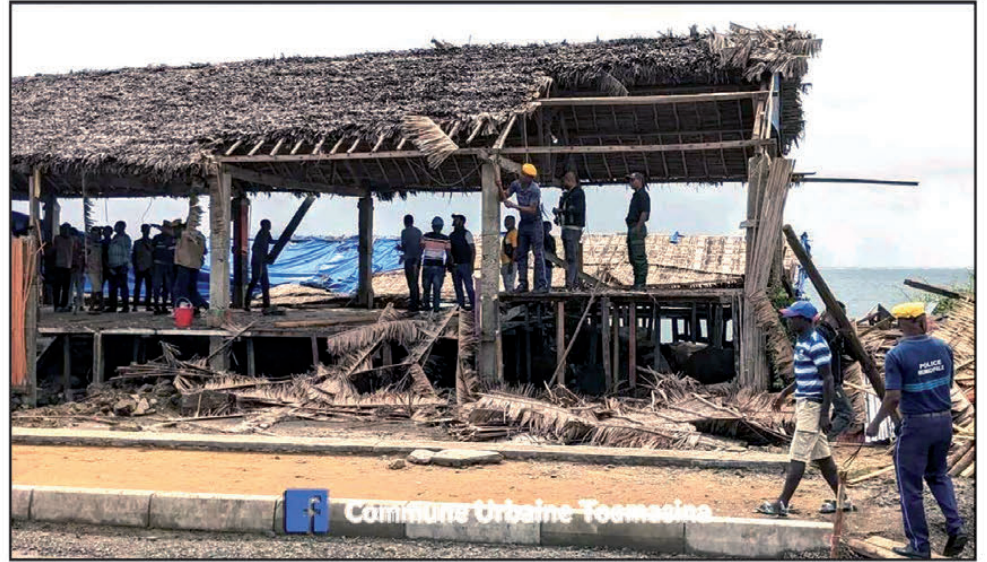
Maromaro ireo toeram-pivarotana noravaina tao Toamasina.

Nanomboka omaly ny fanesorana ireo trano fivarotana manamorona ny lalana Ratsimilaho rehetra nataon'ny kaominina andrenivohitr'i Toamasina. Anisan'ny voakasik'izany ny fivarotana Poisson d'or sy ny Chez moi, izay trano azo lazaina fa lehibe. Araka ny fanazavan'ny avy eo amin'ny kaominina dia efa am-bolana maro no nanomboka ireo dingana rehetra sy fifampiresahana nahatongavana amin'izao fandravana izao. Eo anatrehan'izany, mizotra tsara ny tetikasan'ny filoha, indrindra fa amin'ny fanarenana iny lalana iny, ary mendrika zavatra tsara sy milamina rahateo ny vahoakan'i Toamasina. Niarahan'ny rehetra nahita tokoa fa lasa feno toeram-pivarotana be amin'ny amorondranomasina iny, ka na ny endriky ny tanàna aza niova tanteraka sady hita mikorontana.