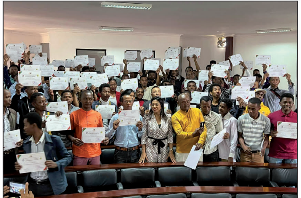
Nahatratra 85 ireo nahavita hatramin'ny farany ny fiofanana nomena azy ireo.

Nozaraina omaly ny fanamarinana nahavitana fiofanana, na "certificat" ho an'ireo mpianatra 85 mianadahy. Niofana mikasika ny asa vaventy sy ny fananganan-trano izy rehetra ireo. Nambaran'ny minisiry ny fiofanana araka asa sy fampianarana teknika Lalatiana Rakotondrazafy : "Nisy 400 mianadahy ireo naniry niatrika ity fiofanana ity ary avy amin'ny faritra maro manerana ny Nosy izy ireo. Ny 100 ihany anefa no azo noraisina tamin'ity andiany ity. Nisy 15 tamin'izy ireo anefa nitsoaka an-daharana noho ny antony manokana avy amin'izy ireo. Nomena fanamarinana nahavita fiofanana izy 85 mianadahy ka ny 27 tamin'ireo no tena nisongadina ka nahazo ny "mention très bien". Nomena sitraka manokana ireo tovo-vavy niatrika izany fiofanana izany, satria anisan'ny asa sarotra sy mila tanjaka, saingy tsy nihemotra izy ireo." Vokatry ny fiarahamiasa amin'ny sendikan'ny indostria, hiditra ao anatin'ny sehatr'asa avy hatrany ireo 27 mianadahy hita fa mendrika nandritra ny fiofanana. Ireo ambiny kosa mbola mandalo "entretien".