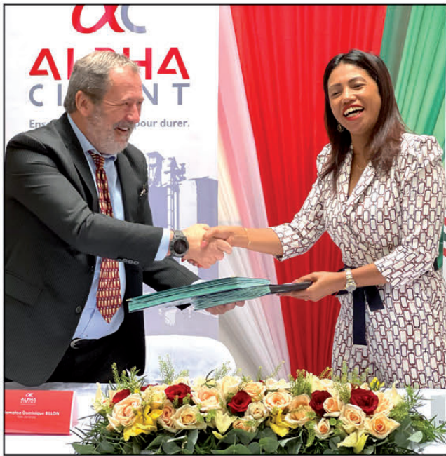
Tanjon'ny roa tonta ny hahafahan'ny tanora miditra amin'ny sehatr'asa avy hatrany.