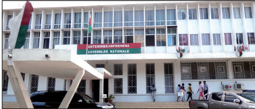
Ny toeram-piasan'ny minisiteran'ny fampianarana ambony. ( Sary tahiry )

Taorian'ny fanapahan-kevitra noraisin'ny fitsarana avo momba ny lalam-panore-nana, nanala ny filohan'ny Antenimieram-pirenena teo aloha tsy ho solombavambahoaka intsony, dia ny filoha lefitra zokiolona indrindra ao amin'ny birao maharitra no no miandraikitra vonjimaika ny fitantanana io andrimpanjakana io, izany hoe eken'ny lalàna hanao sonia ny taratasim-panjakana mahakasika ny Antenimierampirenena sy manan-jo hitarika fivorian'ny mpikambana ao amin'ny