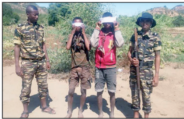
Ireo jiolahy voasambotra !

Efa maro loatra ny fitarainana voarain'ny mpitandro filaminana mikasika ireo jiolahy mpanakan-dàlana ao amin'ny distrikan'i Sakaraha. Mihorohoro tanteraka mantsy ny mponina amin'ny afitsok'ireo jiolahy. Nanoloana izany indrindra dia nisy ny hetsika nataon'ny zandary ka jiolahy mpanakan-dàlana roa lahy no voasambotra ny faran'ny herinandro lasa teo iny tao amin'ny kaominina Mihavatsy, distrikan'i Sakaraha. Mbola mitohy kosa ny fikarohana ny namany. Raha ny fanazavàna azo hatrany dia anisan'ireo jiolahy mpana-