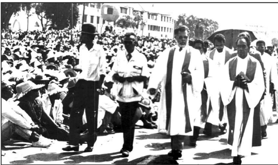
Le soulèvement populaire contre le président Didier Ratsiraka en 1991 a vu une forte implication du religieux avec le FFKM sur la place du 13 mai.

Les exemples les plus basiques chez les politiques sont d'insérer de petites références à la Bible dans les discours. Se faire prendre en photo avec un livre saint à la main. Partager des chansons de louanges sur les réseaux sociaux, à Pâques ou à Noël. Dans ce décorum en mutation, le bloc moral et théologique du rassemblement des quatre grandes Églises au sein du FFKM (Conseil des Églises chrétiennes de Madagascar) d'avant les années 2000 s'étiolent. Celui-ci a monopolisé depuis l'indépendance le discours religieux sur la politique. Un statu quo bouleversé à partir des années 90. La « démocratisation à outrance » initiée par le Zafy Albert (président de la République de 1993 à 1996) a servi de boulevard pour ceux ou celles qui se disaient « prophètes ». Ce professeur en médecine pensait démontrer au monde que la nation « verte, blanche et rouge » adopte pleinement