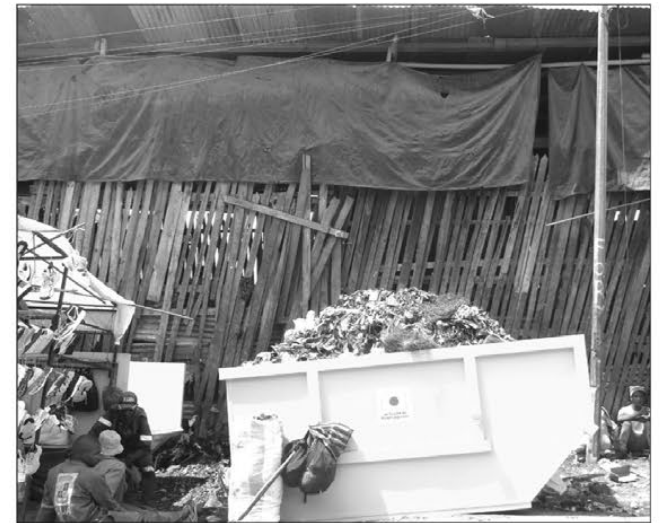
Les bacs à ordures se vident progressivement.