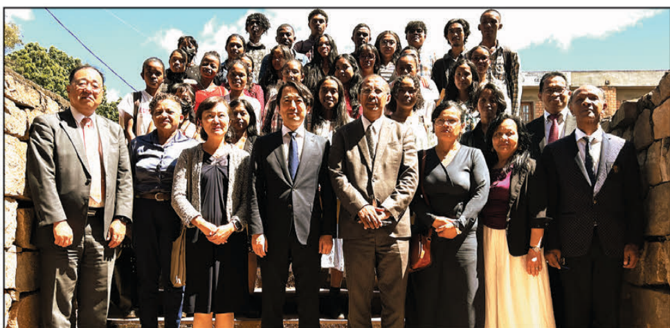
Photo de groupe lors de la remise des primes aux étudiants méritants du département de langue japonaise de la Faculté des lettres et sciences humaines de l'Université d'Antananarivo par Sumitomo corporation.