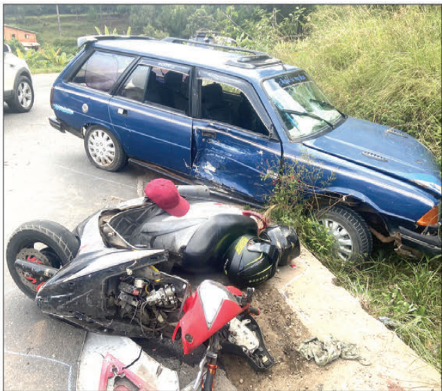
Nentina teny amin'ny hopitaly avy hatrany ny naratra.