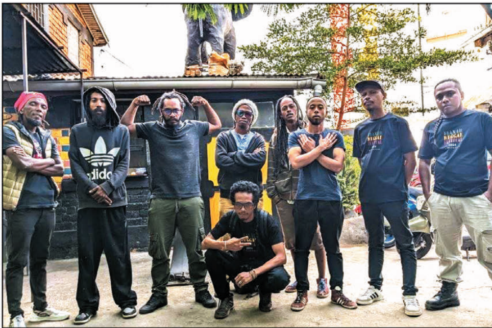
L'équipe d'organisation du « Fianar Reggae Festival ».

TR : L'idée de cet événement, car à la base nous pensions juste à faire un événement ponctuel, est né autour d'une petite table lors d'un apéro. Nous nous étions rendu compte qu'on avait tous les éléments réunis pour monter un événement. Nous l'avons tout bêtement baptisé festival car il se déroulait sur trois jours et sur différents sites. Nous étions loin de nous imaginer que nous devions en assumer les conséquences et le refaire tous les ans. Pour ma part, le moment marquant est sans aucun doute l'édition de 2017, où nous avons obtenu un financement du projet Dinika mené entre autres par l'Union européenne. Cette édition nous a permis de suivre les normes financières d'un projet de grande envergure, nous avons dépensé environ 70 000 euros en une dizaine de jours à travers des résidences de création, et des concerts en dehors de Fianarantsoa, Antananarivo et Antsirabe ont eu leur dose de reggae cette année-là. Quant à la déception, seul