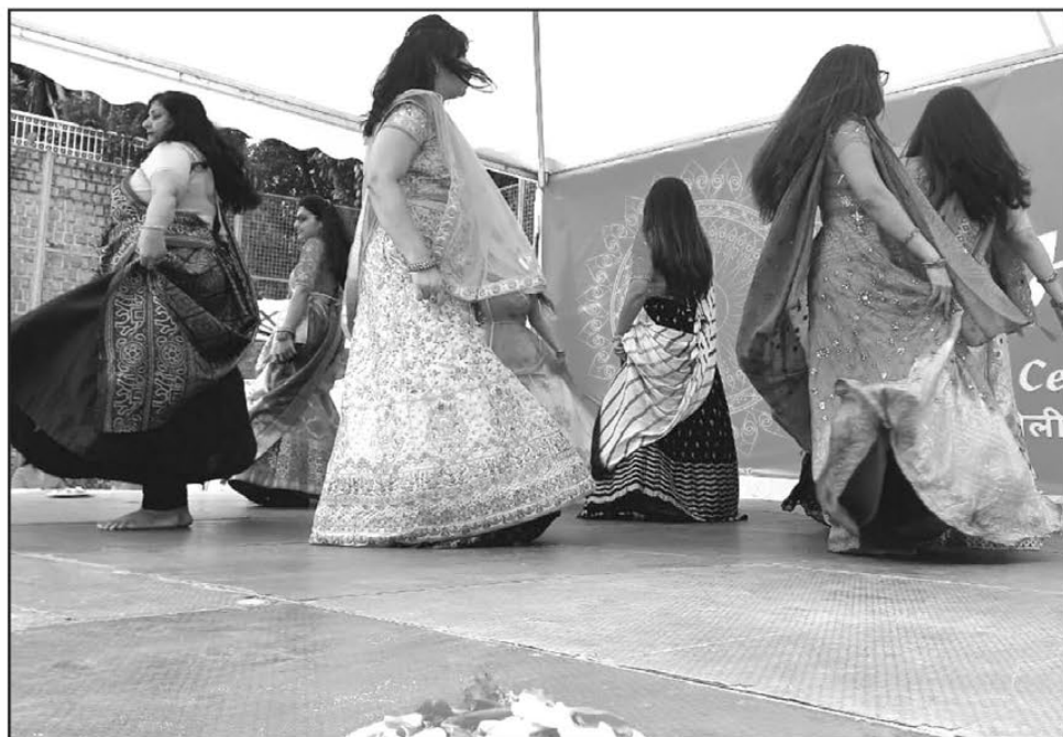
Les couleurs chatoyantes ont été reines durant le festival.