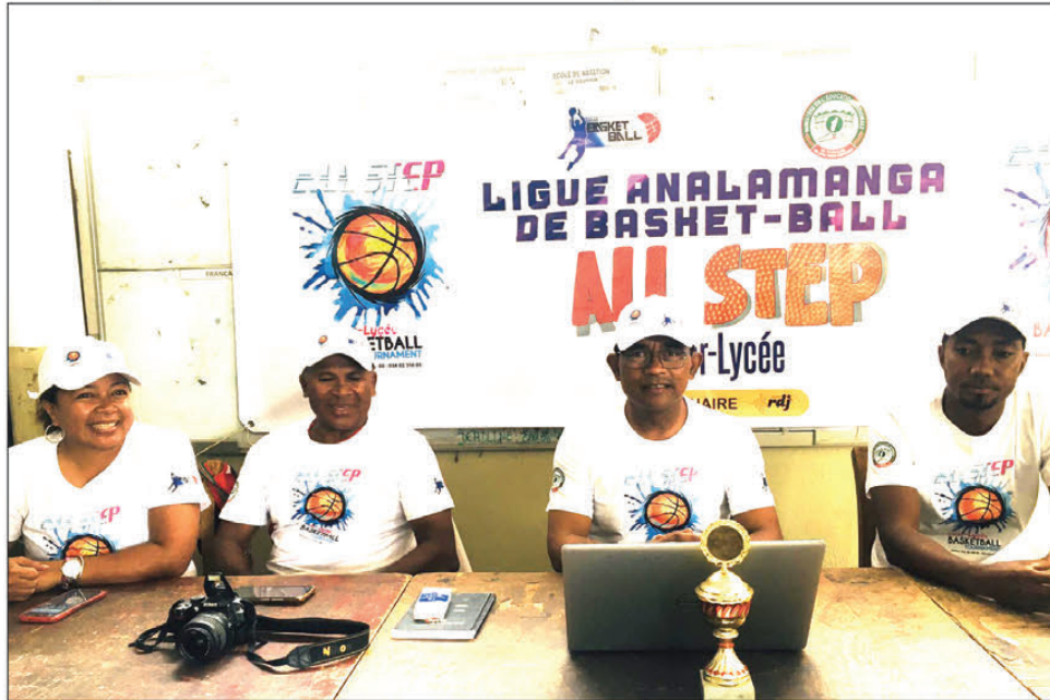
Présentation officielle, devant la presse, ce samedi au LMA Ampefiloha.

niveau de compétitivité des jeunes et à garantir un avenir brillant pour le basketball dans la région, voire au-delà. Nous exprimons notre gratitude envers tous les partenaires et les acteurs impliqués dans la réalisation de cet événement, démontrant ainsi notre engagement commun en faveur du développement du sport et de la jeunesse », poursuit-il. Le tournoi de basket 5x5