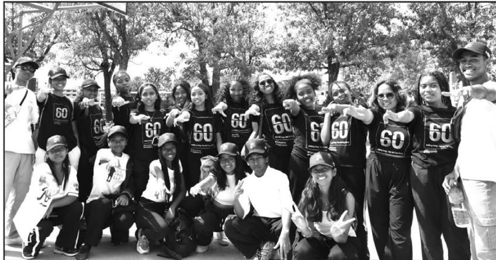
Les jeunes affichent un dynamisme exceptionnel dans les activités de lutte contre le déclin de la nature et du réchauffement climatique.

Les jeunes ont répondu présents, le 23 mars dernier, pour l'initiative "Earth Hour", Une heure pour la Terre, au cours de laquelle des activités mettant en avant les gestes et attitudes éco-responsables, les actions en faveur de la protection de la nature et de la lutte contre le réchauffement climatique. Samedi dernier, plusieurs mouvements de célébration ont eu lieu un peu partout sur le territoire national, d'Antananarivo à Sambava en passant par Toliara, Morondava, Bealanana ou encore Maintirano, Belo sur Tsiribihina, Antsiranana, et dans bien d'autres localités. Particulièrement dynamiques et actifs dans le domaine de la protection de