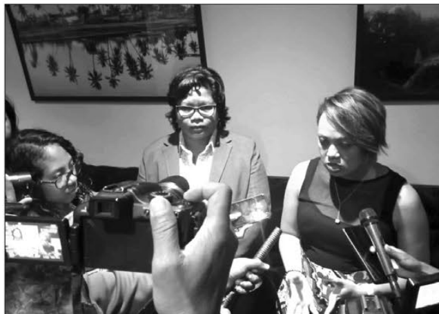
Le mouvement féministe « nifin'akanga » ne désespère pas et continue de lutter contre la culture du viol et de l'inceste.