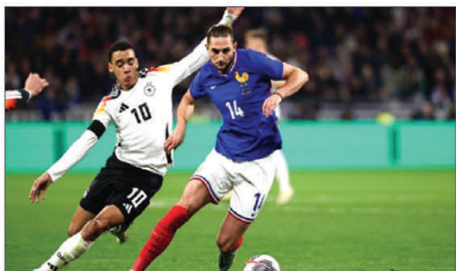
La France s'est inclinée contre l'Allemagne en match amical, à moins de trois de mois du début de l'Euro.

Une défense inquiétante. Sans Antoine Griezmann, une première depuis juin 2017, la France a semblé avoir égaré tous ses repères et sa boussole, le milieu paraissant par moments totalement hors du coup et incapable de mettre l'agressivité nécessaire pour contrer un opposant du calibre des quadruples champions du monde. Mais Deschamps va surtout devoir se pencher sur le chantier de la défense. L'attaque allemande a en effet mis en lumière les failles de la défense française, trop passive. Le premier but encaissé dès le coup d'envoi a souligné la passivité de l'arrière-garde bleue, qui a reculé devant Florian Wirtz. L'ailier du Bayer Leverkusen qui a pu frapper en pleine lucarne et toute la défense a semblé bien léthargique sur ce but, sentiment qui ne s'est jamais dissipé pendant les 89 minutes suivantes et le temps additionnel. Didier Deschamps avait pourtant redistribué pas mal de cartes dans ce secteur et n'a pas obtenu de réponse rassurante. Sur ses six dernières sorties, la France n'est parvenue à garder sa cage inviolée que contre la modeste équipe de Gibraltar au cours de la victoire record obtenue en novembre à Nice (14-0). Les Bleus joueront mardi un deuxième match amical contre le Chili à Marseille pour continuer de préparer l'Euro 2024 (14 juin-14 juillet).