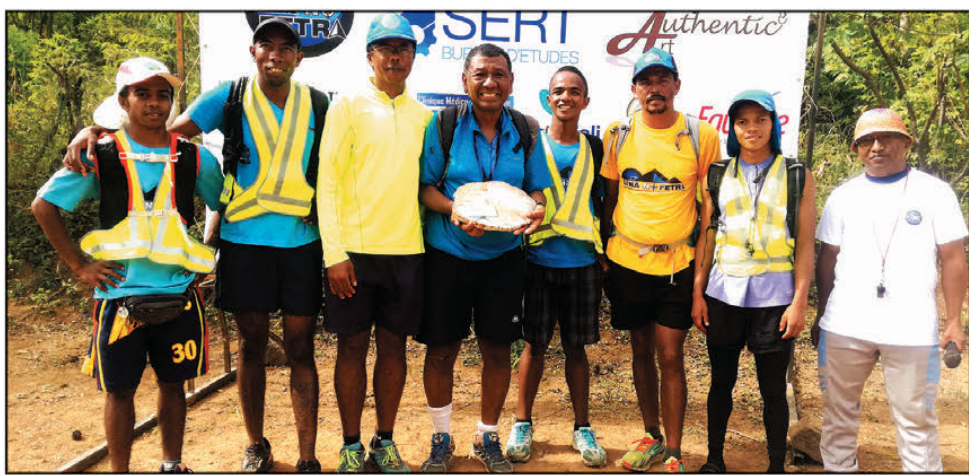
«Grâce à vous chers amis scouts du temple FJKM Analamahitsy, j'ai pu battre mon record personnel de trail de plusieurs minutes ! Encore une fois merci et à la 3 e édition de Aina no Fetra».