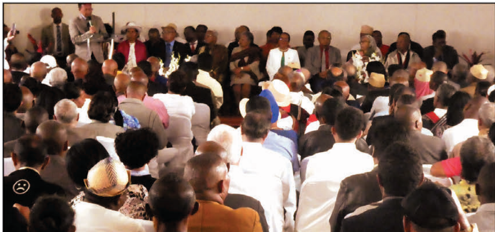
Présentation de vœux sur fond de discussion politique à Tsimbazaza, samedi dernier.