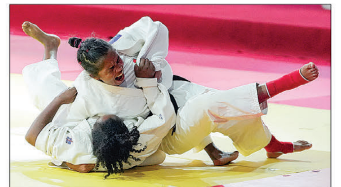
Avy hatrany dia tsy nifampitsitsy ireo judokas omaly.