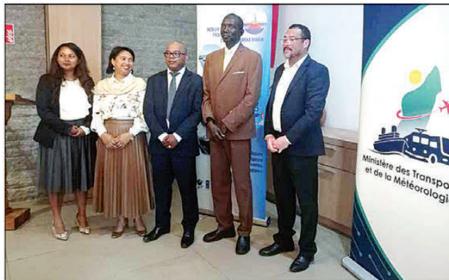
Tonga nanatrika ny fanokafana ny atrikasa ny solontenan'ny OMI (Faharoa ankavanana).

Manan-karena zavaboary ny fari-dranomasin'i Madagasikara. Tandindonin-doza anefa io haren-javaboary an-dranomasina io noho ny fiavian'ireo sambo avy any lvelany. Ireto farany, izay heverina fa matetika ahitana zavamananaina miraikitra amin'ny vatany, ka atahorana hanimba ny haren-javaboary aty amintsika. Tsihivina fa efa nisy ny tranga tamin'ny fahaton-gavan'ny radaka boka tao Toamasina. Eo anatrehan'izany indrindra, misy ny atrikasa karakaraian'ny OMI (Organisation Maritime Internationale) miaraka