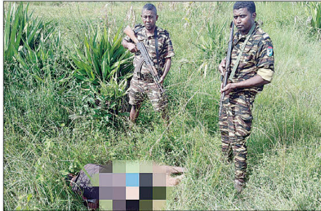
Ilay dahalo maty!

Vaky nandositra ireo dahalo ka ity iray ity no tavela rehefa lavon'ny balan'ny zandary.