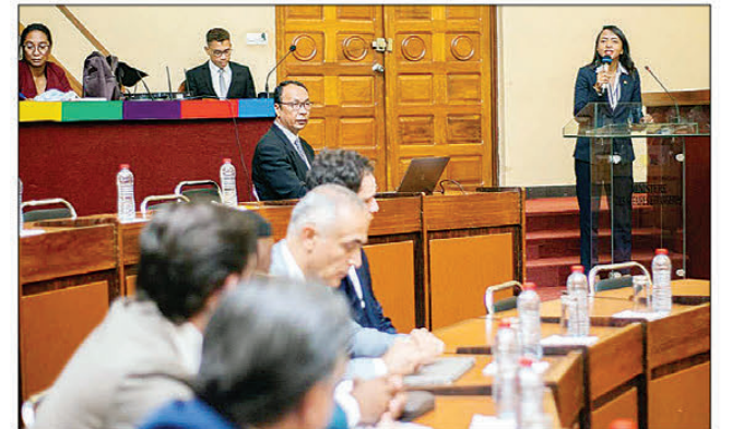
Fihaonana niaraka tamin'ireo mpandraharaha tiorka tao amin'ny Minisiteran'ny Raharaham-bahiny Anosy.

Nahomby ny iraka nataon'ny delegasiônina malagasy tany Antalya Torkia. Noraisina tao amin'ny Minisiteran'ny raharaham-bahiny eny Anosy omaly ny delegasiônina misy ireo mpandraharaha tiorka. "Fitohizan'ny fanasana natao tamin'ireo mpandraharaha tiorka tany Antalya ny fihaonana anio. Efa nisy rahateo ny fihaonana tamin'ireo mpandraharaha rehetra tao Torkia tamin'ny delegasiônina malagasy. Nohazavaina sy novelabelarina tamin'izy ireo ireo tetikasampampandrosoana hahafahany misehatra eto amintsika sy manampy amin'ny fampandrosoana ny firenentsika.", hoy ny Ministry ny raharaham-bahiny, Rafaravavafika Rasata. Mpikamban'ny governemanta vitsivitsy niaraka tamin'ny EDBM (Economic Development Board of Madagascar) no nidinika tamin'izy ireo tamin'io fotoana io. Tafiditra tao anatin'ny resaka nifanakalozan'ny andaniny sy ankilany ny fijerena ireo seha-pihariana tena mpampidi-bola vahiny eto amintsika, ny faritra ara-toekarena manokana, ary ny tetikasa Tanamasoandro an'ny Filoham-pirenena malagasy. Nana-mafy ny fahavononany hampiasa vola eto amintsika sy hifanome tanana amin'ny fampandrosoana an'i Madagasikara ireto mpandraharaha tiorka ireto.